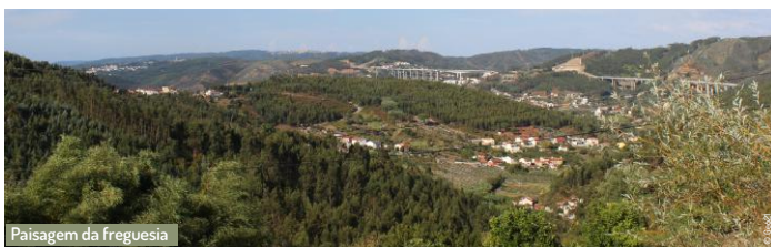
Paisagem da freguesia

O seu território divide-se em duas grandes áreas: uma com coberto florestal predominantemente preenchido por pinheiros e eucaliptos (área denominada de "zona do barro vermelho") mais a norte, que contrasta com a parte Sul, onde predomina a agricultura por excelência, tais como, a viticultura e olivicultura. Geomorfologicamente, toda a zona é bastante acidentada, com cotas que variam entre os 28 metros (zonas ribeirinhas junto a Cartaxos) e 320 metros próximo de Rio de Galinhas.