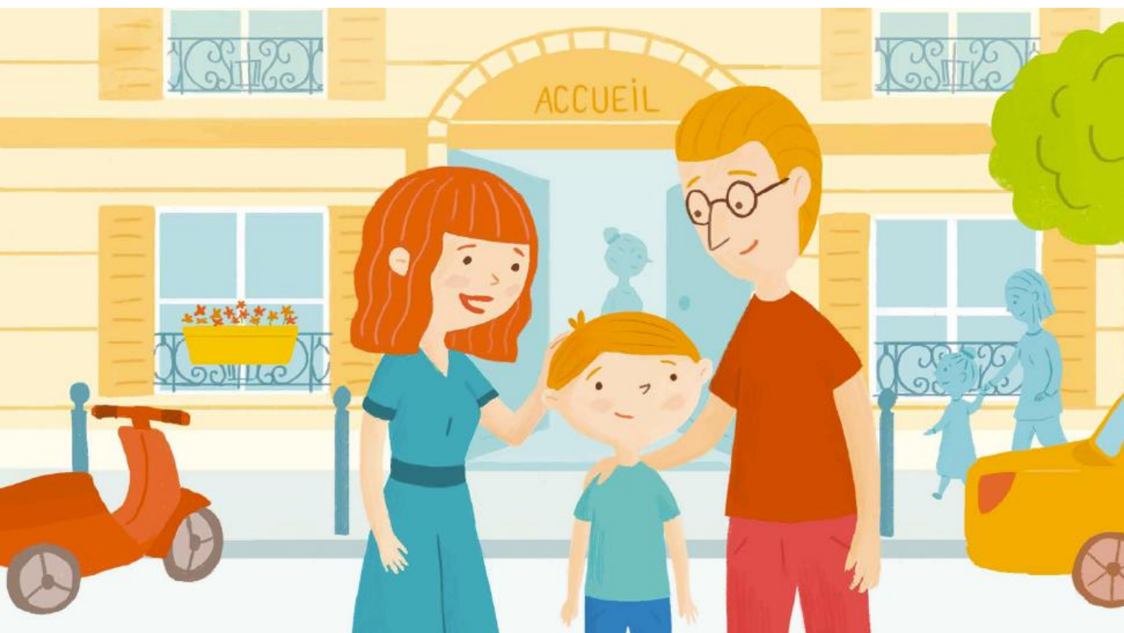
Illustration : couverture du livret élaboré par des parents de notre association Mon enfant va dans un hôpital de jour - Le handicap psychique au quotidien

Des métiers au service des enfants, des adolescents, des jeunes adultes et des familles