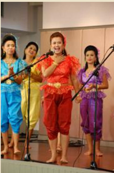
รูปที่ ๒ การร้องบทเกริ่นของฝ่ายหญิง

๒.๒ ขั้นตอนการร้องบทเกริ่นเป็นลำดับขั้นตอนการร้องต่อจากบทไหว้ครู ประกอบด้วย การร้องเพลงออกตัว เพลงแต่งตัว เพลงปลอบ หรือ เพลงชมโฉม ฝ่ายชายหรือ ฝ่ายหญิงจะออกตัวเชิงอ่อนน้อมถ่อมตนว่าเป็นเพลงหัดใหม่ยังไม่ชำนาญ และขอขมาอภัยหากร้องผิดพลาด พร้อมทั้งร้องขอกำลังใจจากผู้ชมให้ช่วยส่งเสริม เพลงแต่งตัวเป็นการสมมติว่าฝ่ายหญิงแต่งตัวออกไปพบฝ่ายชายด้วยความสวยงามและภาคภูมิใจ ฝ่ายชายก็อาจร้องตอบในบทชมโฉม เพื่อชมความงามของฝ่ายหญิง ช่วงขั้นตอนของการร้องบทเกริ่นนี้ อาจใช้เวลาพอสมควร แต่ทั้งนี้ขึ้นอยู่กับระยะเวลาของการแสดงทั้งหมดอีกเช่นกัน สาระความเข้มข้นของบทร้องจะเริ่มต้นในช่วงเกริ่นโดยต่อเนื่องไปสู่ขั้นตอนของการร้องในบทต่อไป