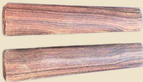
รูปที่ ๑๑ กรับ เครื่องดนตรีประกอบการแสดงเพลงอีแซว

๓. กรับ เป็นเครื่องดนตรีไทยประเภทเครื่องตีที่ทำด้วยไม้ ทำหน้าที่กำกับจังหวะ โดยการเคาะหรือตีไม้ให้เกิดเสียง ในจังหวะฉับของเสียงฉิ่ง