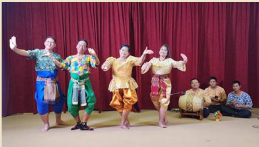
รูปที่ ๔ พ่อเพลงแม่เพลงแสดงท่าทางการรำประกอบการเล่นเพลงอีแซว

๒. ท่ารำตามทำนองหมายถึงท่ารำที่ผู้แสดงจะรำในขณะที่มิได้มีการขับร้องเนื้อเพลง ซึ่งหมายถึงอีกฝ่ายหนึ่งเป็นผู้ร้องแล้วฝ่ายหนึ่งจะยืนรำตามทำนองเพลงไปด้วย อันรวมถึงการรำของพวก ลูกคู่ ทั้งหลาย ซึ่งท่ารำส่วนใหญ่จะเป็นท่าร่างกายนุ่มรำให้เกิดความพร้อมเพรียงกัน เช่น ท่าสอดสร้อยมาลาแปลง ท่าพรหมสีหน้า ท่าจีบสองมือส่งด้านหลัง ท่าจีบส่งมือบน เป็นต้น โดยใช้การย่อเท้าให้ตรงตามจังหวะของทำนองเพลงในขณะที่เคลื่อนไหวมือ นับว่าการรำประเภทนี้สามารถสร้างความสวยงามเชิงสุนทรียภาพแก่ผู้ชมได้เป็นอย่างดี เพราะนอกจากจะได้ฟังการขับร้องแล้วยังได้เห็นท่าทางที่สวยงามหรือในบางครั้งอาจมีท่ารำแบบตลกโปกฮาของพ่อเพลง เช่น การรำต้อนรับแม่เพลง การรำย่อเข้า หรือในปัจจุบันอาจแทรกท่าเต้นที่กำลังเป็นที่นิยมเป็นการเสริมสร้างบรรยากาศของการแสดงให้ผู้ชมเกิดความสนุกสนานได้มากขึ้น