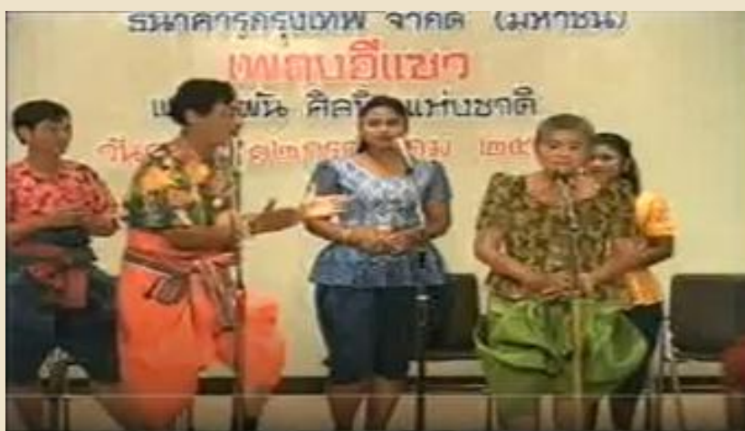
รูปที่ ๗ ภาพการแต่งกายของพ่อเพลงและแม่เพลง ที่เริ่มการแสดงในรูปแบบคณะหรือวงเพลง

๒. ในยุคที่เริ่มเป็นการแสดง นั้นหมายถึง ยุคของการยึดเป็น อาชีพระยะแรกของเพลงพื้นบ้านซึ่งรวมถึงเพลงอีแซวได้กลายเป็น มหรสพที่มีแสดงในงานต่าง ๆ คนนิยมรับชมและรับฟัง ดังนั้นเจ้าของ คณะจึงเริ่มปรับปรุงเรื่องของการแต่งกายให้มีสีสันสวยงาม แต่อาจจะ ไม่แตกต่างไปจากรูปแบบเดิมหากแต่มีการใช้ผ้าที่มีราคาสูงและมีความ สวยงามมาใช้ เช่นผ้าโจงกระเบนที่เป็นผ้าไหม เลือ้อาจมีลวดลายสีสัน เริ่มมีการแต่งหน้าของฝ่ายหญิงบ้างแล้วแต่ไม่มากและเมื่อต้องแสดง เป็นเรื่องราวประเภทเพลงทรงเครื่อง ก็จะนิยมแต่งกายตามท้องเรื่อง ที่แสดง ซึ่งสามารถหาเครื่องแต่งกายได้ในท้องถิ่นตามความเหมาะสม และทุนทรัพย์ของผู้แสดง