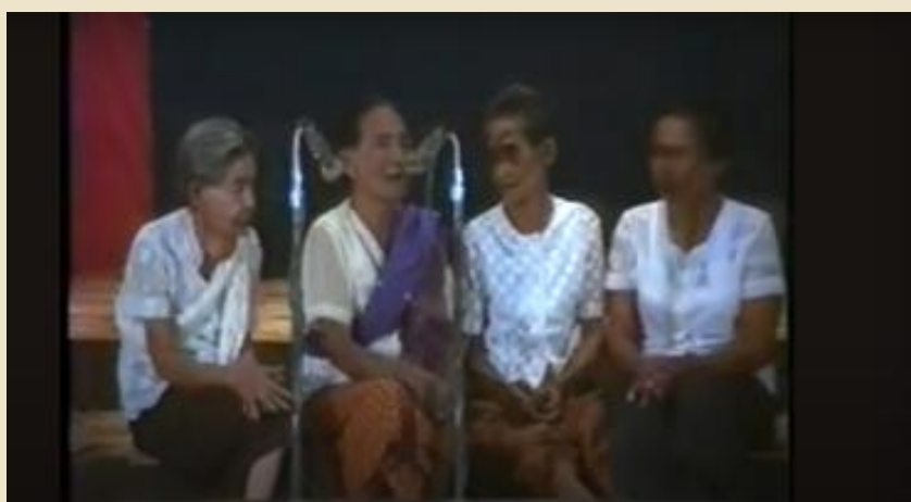
รูปที่ ๖ ภาพการแต่งกายของแม่เพลงในอดีต