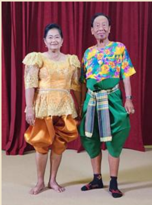
รูปที่ ๘ ภาพการแต่งกายของพ่อเพลงและแม่เพลงในปัจจุบัน

๓. ในยุคปัจจุบัน เป็นเพลงอีแซวที่แสดงเพื่อการยึดเป็นอาชีพ แต่ละคณะมีรูปแบบการแต่งกายที่คล้ายคลึงกัน ฝ่ายชายยังคงแต่งกายเหมือนเดิมแต่มีวิธีการนุ่งผ้าจับจีบให้สวยงามขึ้น สิ่งที่ยังคงสืบทอดในเรื่องของการแต่งกาย คือ การนุ่งผ้าแบบโจงกระเบนทั้งชายและหญิง ส่วนเสื้อที่สวมใส่ของฝ่ายหญิงมีความสวยงามมากขึ้น ใช้ผ้าอย่างหลากหลาย ออกแบบการตัดเย็บด้วยรูปแบบที่แตกต่างกัน เช่น การจับจีบระบาย การปักฉลุ การประดับตกแต่งด้วยเลื่อมหรือลูกปัด เป็นต้น นอกจากนี้มีการสวมใส่เครื่องประดับ เช่น สร้อยคอ ต่างหู เข็มขัด และทัดดอกไม้ นับว่าเป็นวิวัฒนาการด้านการแต่งกายที่ช่วยส่งเสริมให้การละเล่นเพลงอีแซวน่าชมมากยิ่งขึ้น