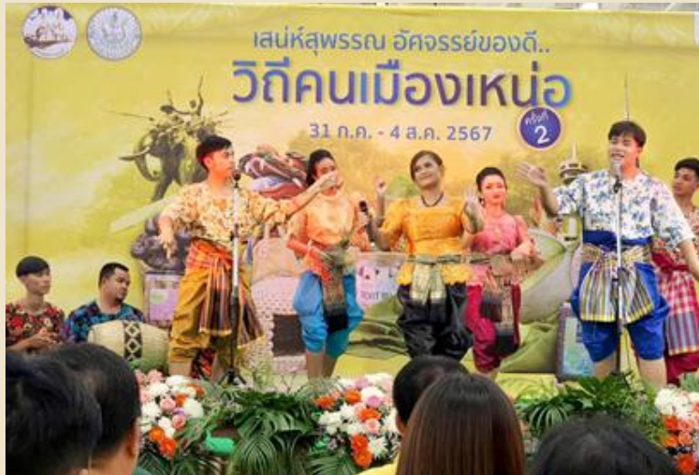
รูปที่ ๑๔ การแสดงเพลงอีแซวในงานของวิทยาลัยนาฏศิลปสุพรรณบุรี

๔. จัดทำองค์ความรู้เรื่องเพลงอีแซวสุพรรณบุรีเพื่อการศึกษาในรูปแบบสื่อ นวัตกรรม เป็นสื่อการเรียนรู้ที่อธิบายประวัติเพลงอีแซวตลอดจนลำดับขั้นตอนของเพลงอีแซวแบบโบราณ อันประกอบด้วย บทไหว้ครู บทเกริ่น บทประและบทลา , จาก เป็นต้น