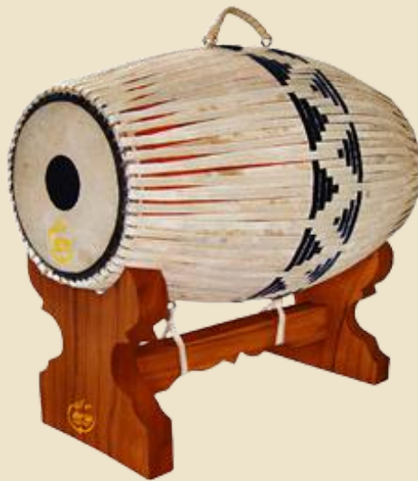
รูปที่ ๙ ตะโพน เครื่องดนตรีประกอบการแสดงเพลงอีแซว

๑. ตะโพน ตะโพนมีลักษณะเป็นกลองสองหน้า รูปทรงกระบอก ส่วนกลางป่อง มีหุ้ที่ทำจากไม้เนื้อแข็ง ซึ่งด้วยหนังวัวสองหน้า หน้าใหญ่เรียกว่า "หน้าเท่ง" หรือ "หน้าเท่ง" และหน้าเล็กเรียกว่า "หน้ามัด" โดยหน้าเท่งจะอยู่ทางขวามือของผู้ตี มีการถ่วงเสียงด้วยข้าวสุกบดผสมขี้เถ้าตรงกลางหน้ากลอง และมีหูหิ้วด้านบน ส่วนตัวกลองจะวางอยู่บนเท้าไม้ ตะโพนถือเป็นเครื่องดนตรีสำคัญในวงปี่พาทย์ ทำหน้าที่กำกับจังหวะหน้าทับต่าง ๆ