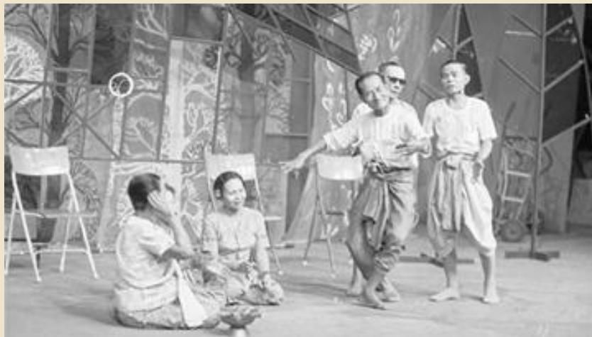
รูปที่ ๕ ภาพการแต่งกายของพ่อเพลงและแม่เพลงในอดีต