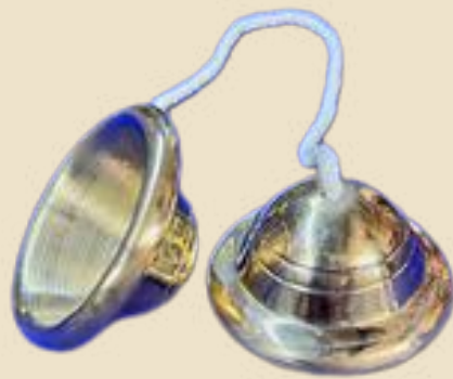
รูปที่ ๑๐ ฉิ่ง เครื่องดนตรีประกอบการแสดงเพลงอีแซว

๒. ฉิ่ง เป็นเครื่องดนตรีไทยประเภทเครื่องตีที่ใช้กำกับจังหวะ ในวงดนตรีต่าง ๆ ทำจากทองเหลืองหรือสำริด มีสองฝาประกบกัน โดยแต่ละฟามีรูตรงกลางสำหรับร้อยเชือกเพื่อจับตี มีสองเสียงหลักคือเสียง "ฉิ่ง" ที่ได้จากการกระทบแล้วยกขึ้น และเสียง "ฉับ" ที่ได้จากการกระทบแล้วประกบกันอย่างรวดเร็ว