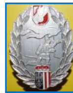
Rechts im Bild: Abzeichen der Stufe 2

Jeder Atemschutztrupp der diese Leistungsprüfung erfolgreich abschließt, erhält diese begehrten Abzeichen mit Urkunde.