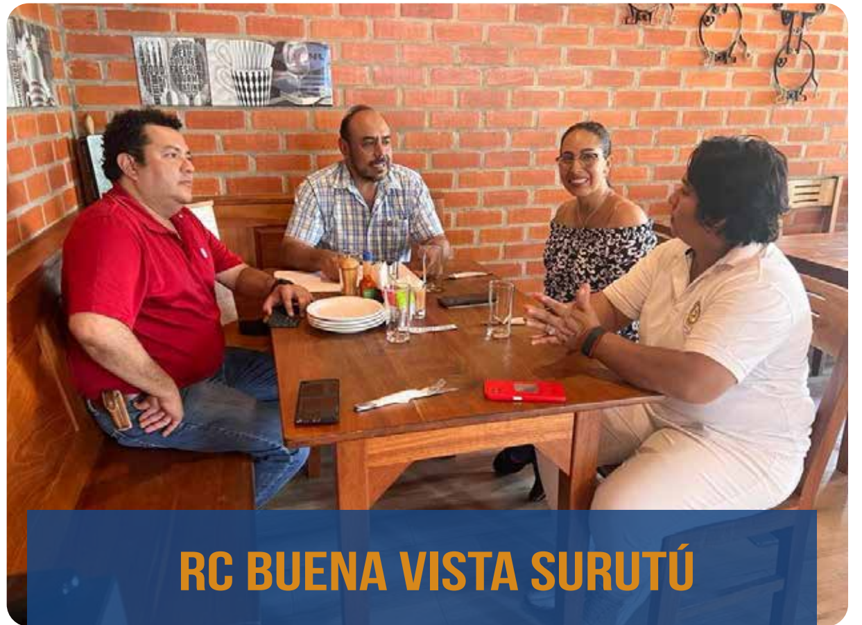
RC BUENA VISTA SURUTÚ