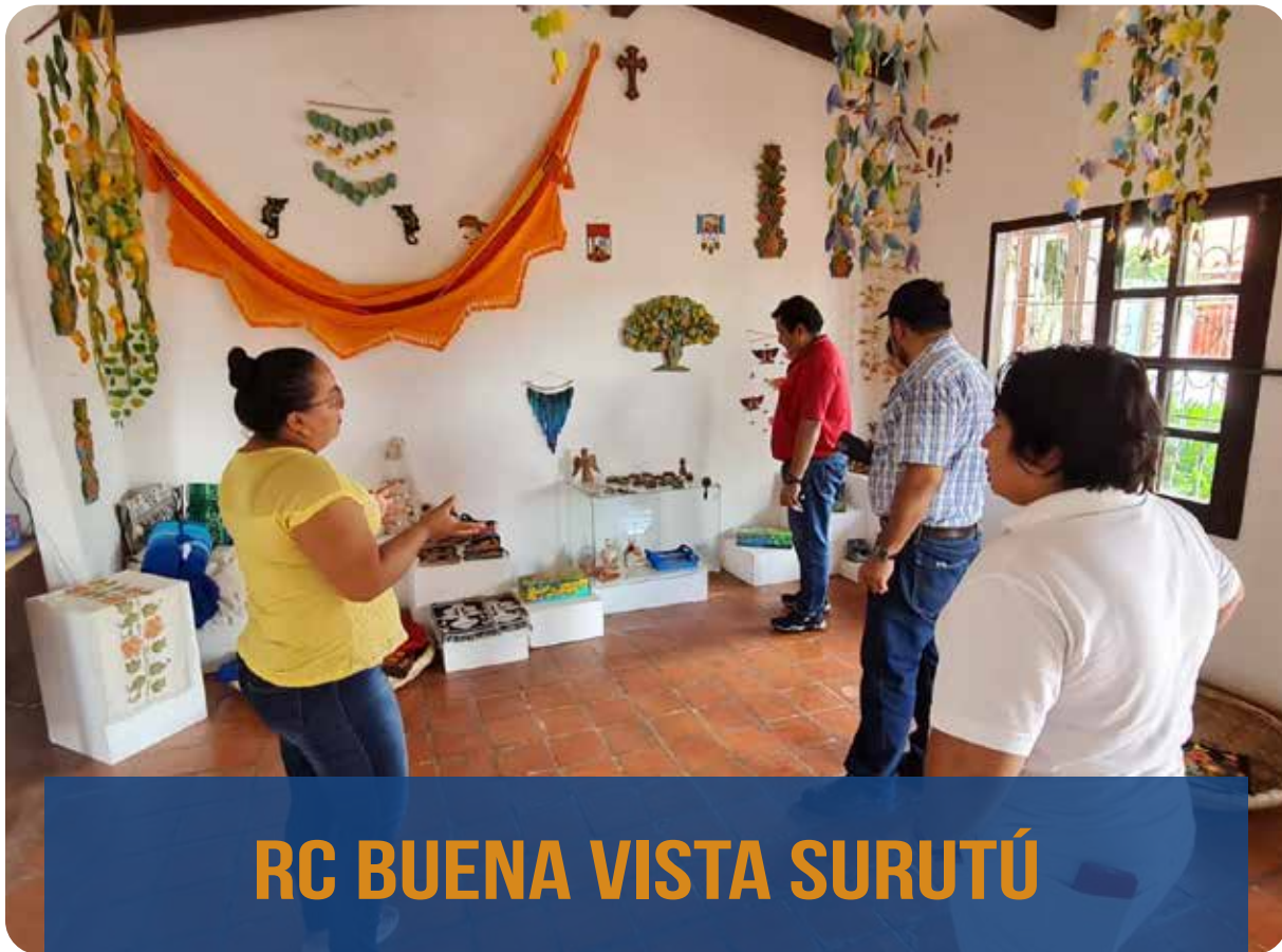
RC BUENA VISTA SURUTÚ