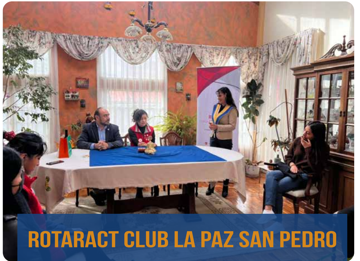
ROTARACT CLUB LA PAZ SAN PEDRO