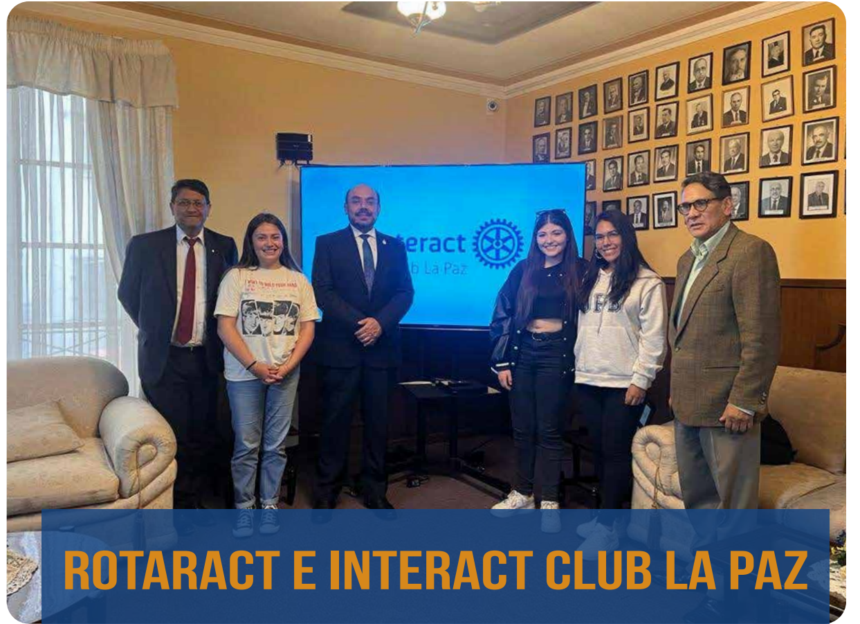
ROTARACT E INTERACT CLUB LA PAZ