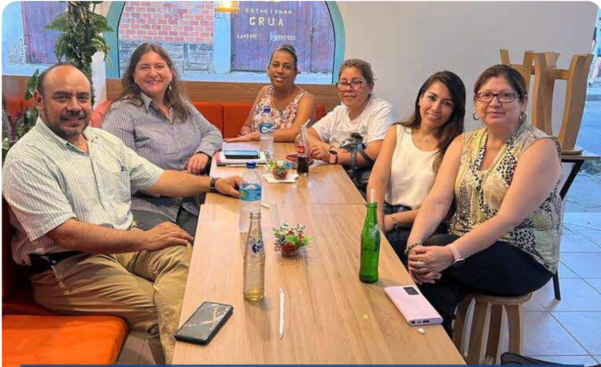
RC SATÉLITE TARIJA SOLIDARIA