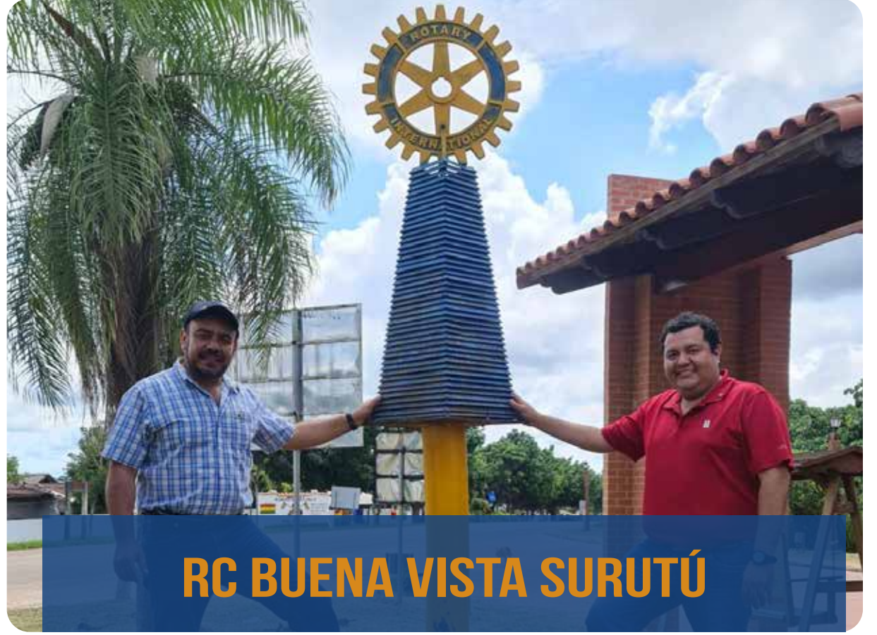
RC BUENA VISTA SURUTÚ