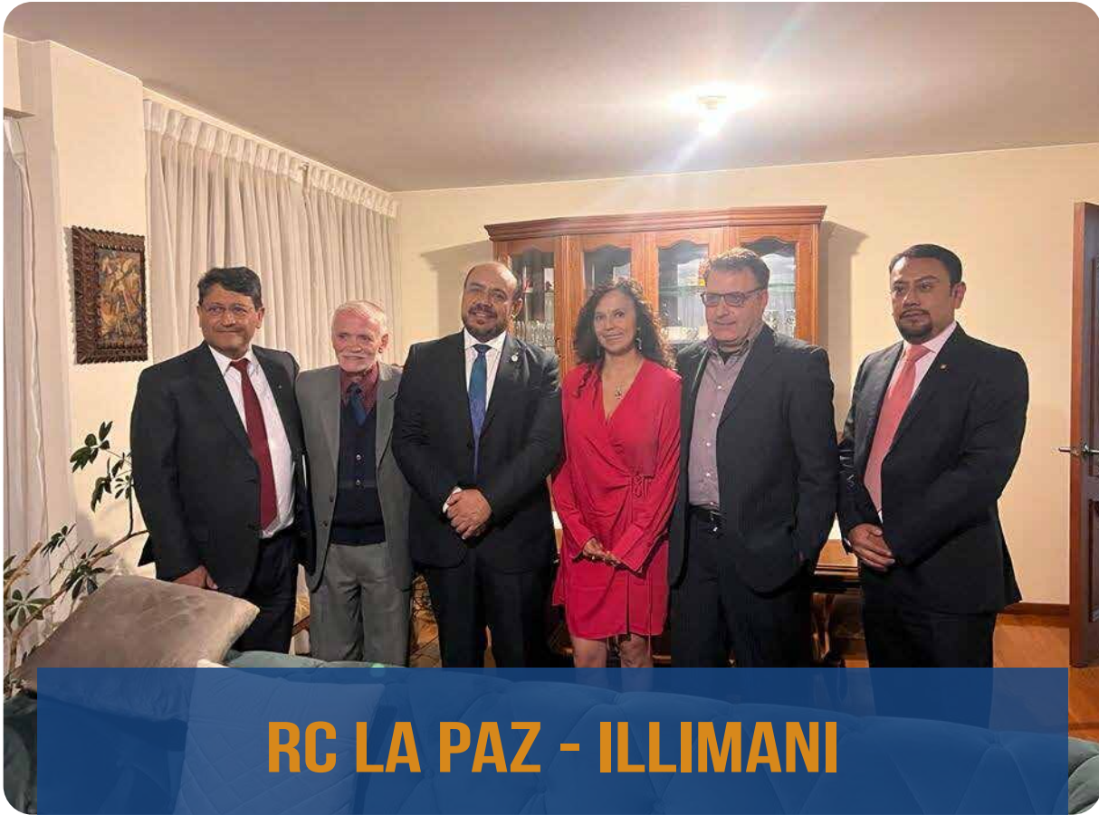
RC LA PAZ - ILLIMANI