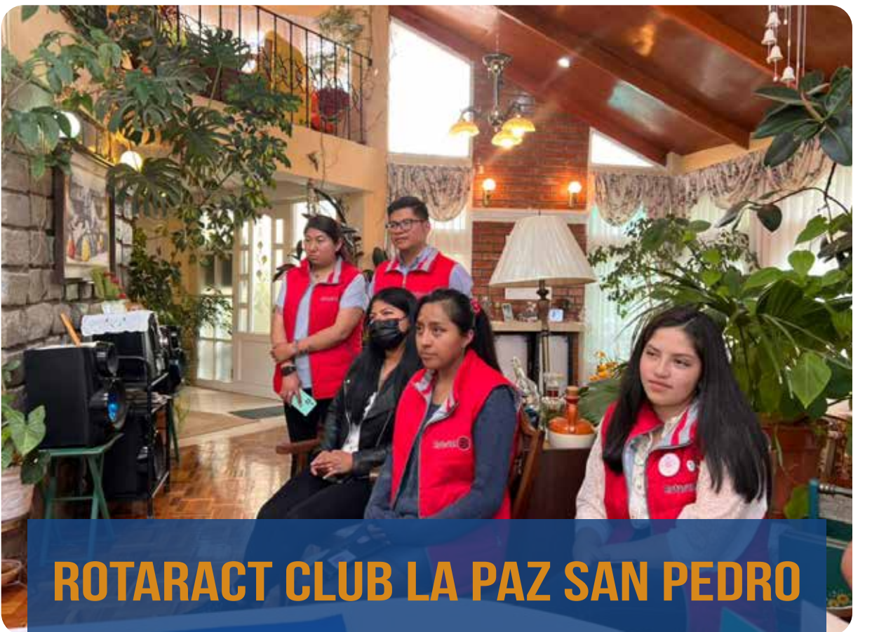
ROTARACT CLUB LA PAZ SAN PEDRO