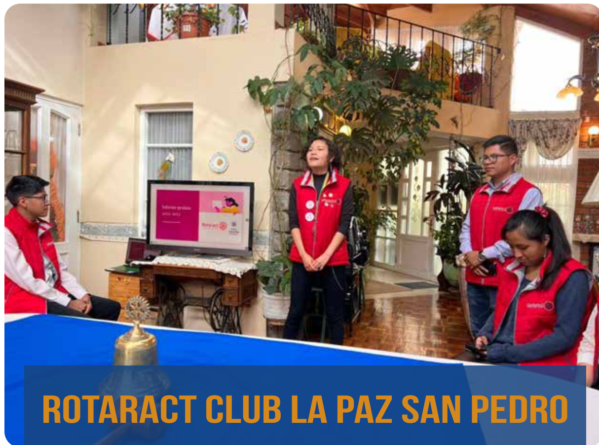
ROTARACT CLUB LA PAZ SAN PEDRO