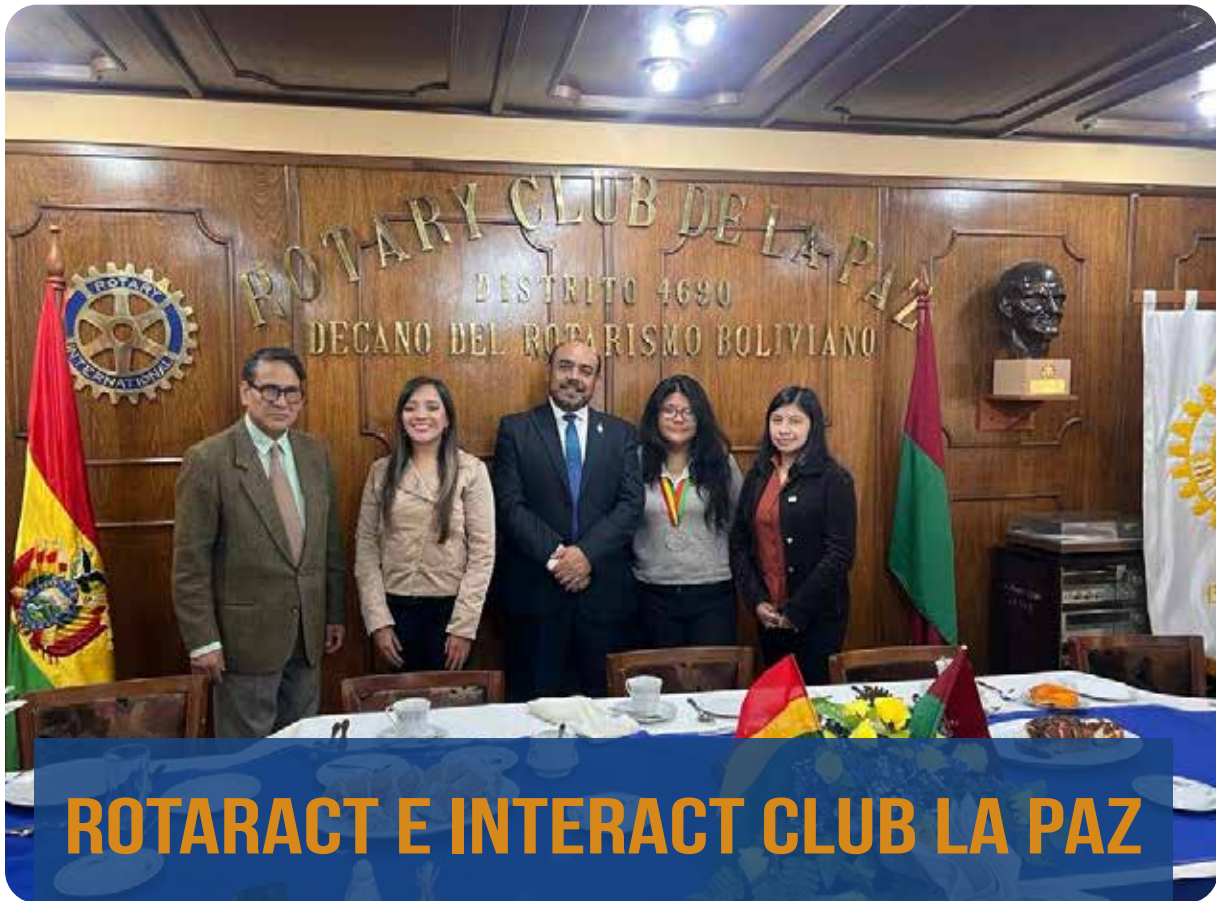
ROTARACT E INTERACT CLUB LA PAZ