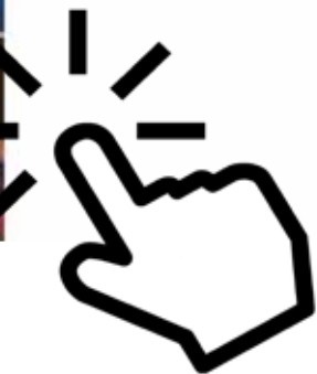
Rotaract Club Cochabamba