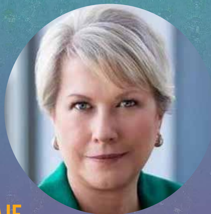
MENSAJE JENNIFER JONES PRESIDENTE 2022-2023 ROTARY INTERNATIONAL