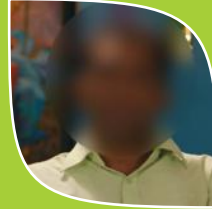
Case No.4 Name Changed (Employee)