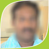
Case No.1 Name Changed (Manager in Private Company)