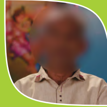
Case No.4 Name Changed (Renowned Farmer)