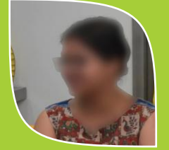
Case No.6 Name Changed (Student)