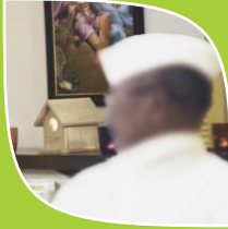
Case No.2 Name Changed (Renowned Farmer)