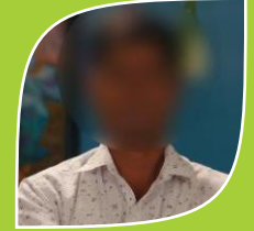
Case No.11 Name Changed (Renowned Farmer)