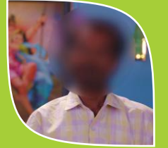
Case No.6 Name Changed (Renowned Farmer)