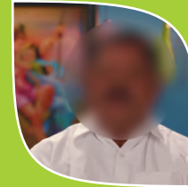
Case No. 10 Name Changed (Renowned Farmer)