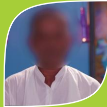
Case No. 9 Name Changed (Guruji)