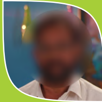
Case No.8 Name Changed (Farmer)