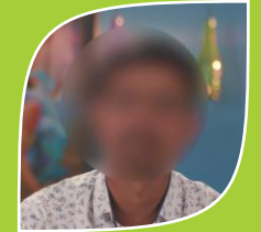
Case No. 11 Name Changed (Businessman)