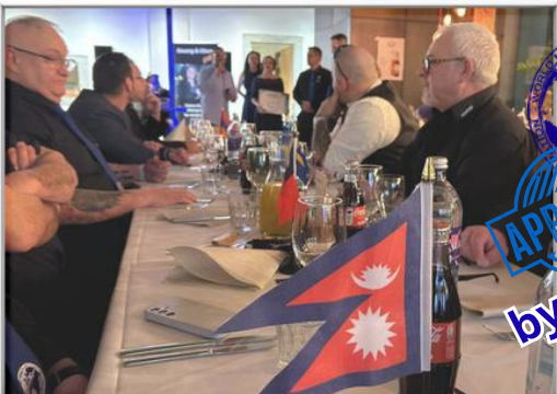
WMAC WORLD CONVENTION DINNER - Hotel Lamm (Jan.25)