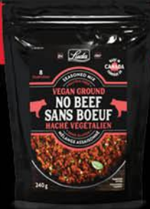
Haché végétalien sans boeuf