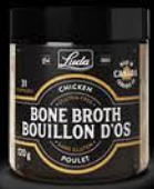
Bouillon d'os de poulet