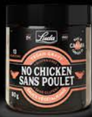
Sauce végétalienne sans poulet