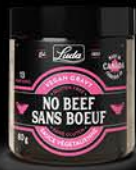
Sauce végétalienne sans boeuf