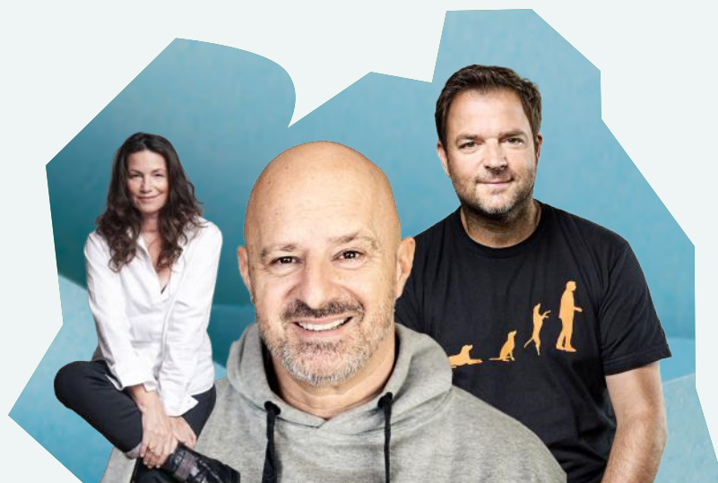
V.l.n.r.: Sabine Vitua, Detlef Steves, Martin Rütter.

Mit ihren Stimmen, ihrer Medienpräsenz und ihren persönlichen Erfahrungen unterstützen sie uns dabei, unsere Anliegen sichtbar zu machen. Alle drei eint, dass ihre Mütter an Demenz litten. Für sie ist klar, dass Erkrankungen des Gehirns und des Nervensystems zu den großen Herausforderungen unserer Zeit gehören. Im Gespräch mit der DZNE-Stiftung sagt Detlef Steves: „Unsere Gesellschaft wird