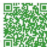
Beispielhafte Spendenaktion.