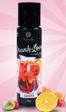
Sangria | Sangria | Sangria 340000092681