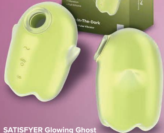
SATISFYER Glowing Ghost yellow 410000071661