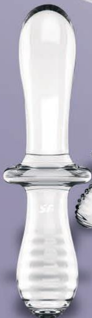
SATISFYER Double Crystal transparent 410000071052