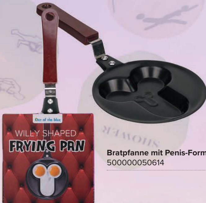
Bratpfanne mit Penis-Form 500000050614