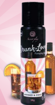
Whiskey und Cola | Whiskey & Coke | Whisky et Cola 340000092682