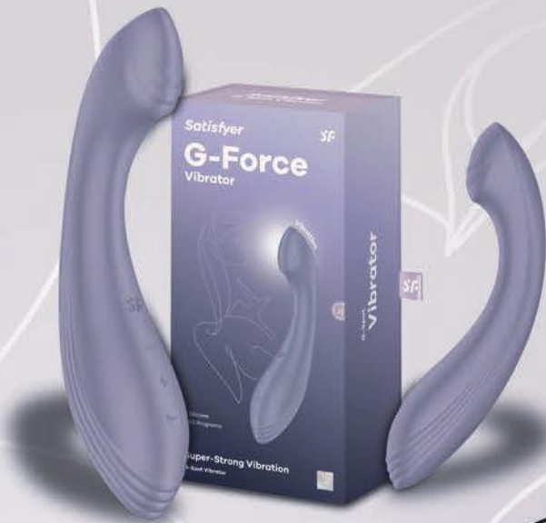
SATISFYER Vibrator G-Force violet 410000071294