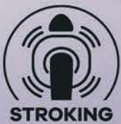
SATISFYER Seal You Soon 410000071784