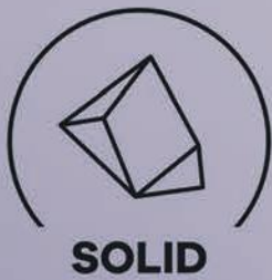
SATISFYER Sparkling Crystal transparent 410000071054