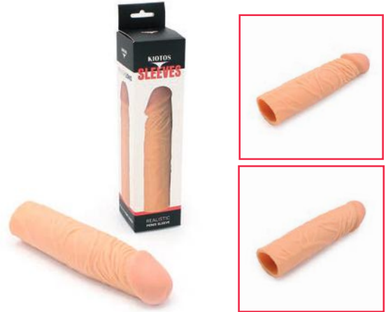
Kiotos Realistic Penis Sleeve 670000032405 📏 185 mm | Ø 42 mm