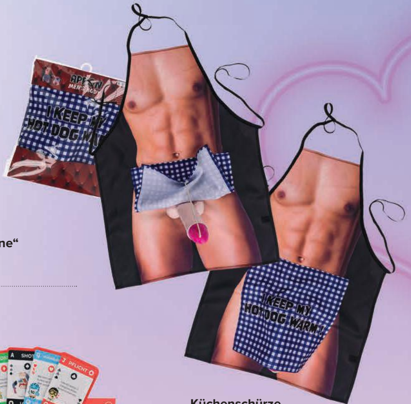
Küchenschürze „I keep my hot dog warm“ 500000050615