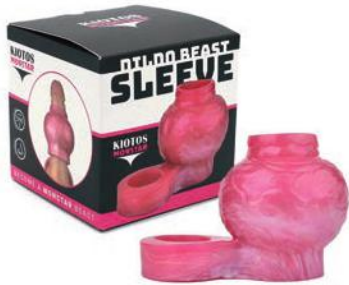
Monstar Sleeve 12 670000032420 76 mm | Ø 72 mm