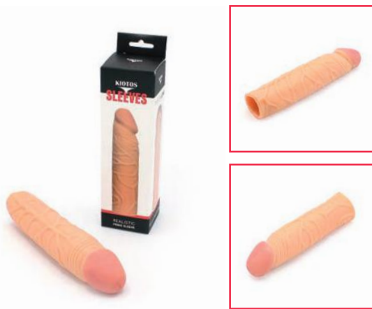
Kiotos Realistic Penis Sleeve 670000032406 📏 165 mm | Ø 36 mm