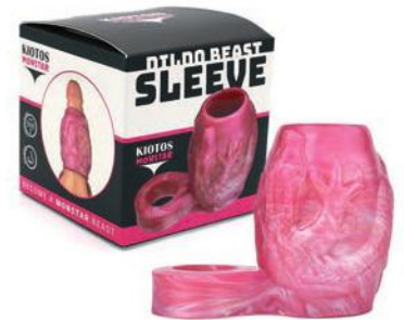
Monstar Sleeve 14 670000032422 87 mm | Ø 68 mm