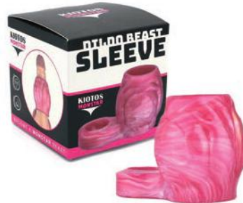
Monstar Sleeve 13 670000032421 73 mm | Ø 65 mm