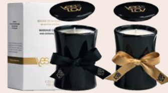
MASSAGE CANDLE Bougie / Kerze Fragrance titillating / affolante 340000093165