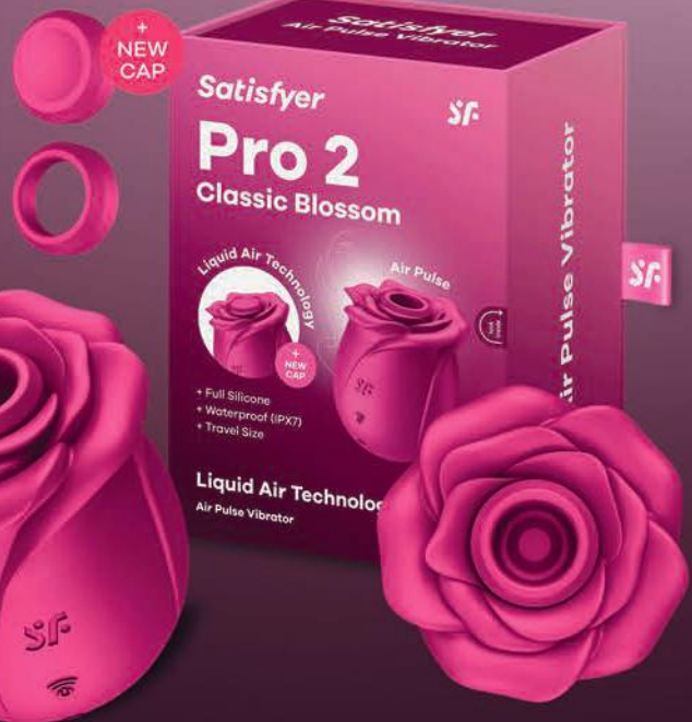
SATISFYER Pro 2 Classic Blossom 410000071778