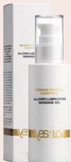
ALLOVER Integral Ganzkörper Silicon based 340000093171