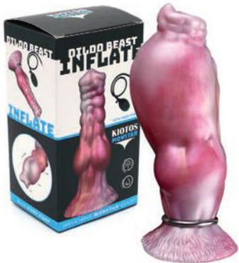
Kiotos Monstar Dildo Beast 87 - Inflatable 670000032431 180 mm | Ø 58/66 mm