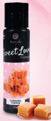
Karamell-Toffee Caramel Toffee Caramel Toffee 340000092674