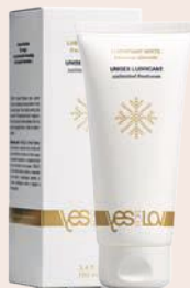
COOLING Fraicheur Erfrischend 340000093151