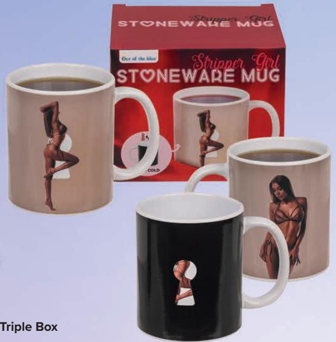
Becher Stripper Girl 550000990011