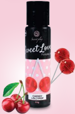
Kirschlutscher Cherry Lollipop Sucette à la Cerise 340000092670