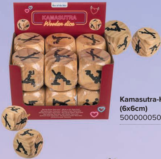
Kamasutra-Holz-Würfel (6x6cm) 500000050009