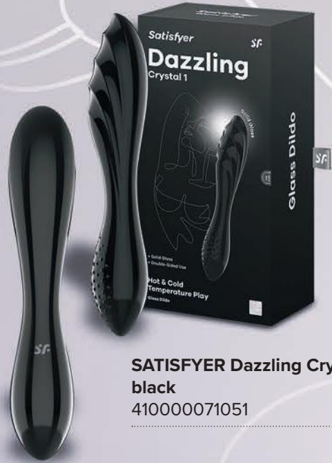
SATISFYER Dazzling Crystal 1 black 410000071051