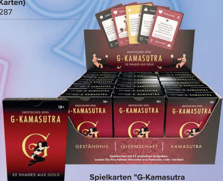
Spielkarten "G-Kamasutra aus Gold" (57 Karten) 500000050285