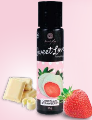
Schokolade Erdbeere und weiße Strawberry & White Chocolate Fraise et Chocolat Blanc 340000092671