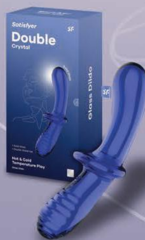
SATISFYER Double Crystal blue 410000071053