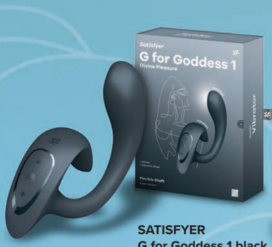
SATISFYER G for Goddess 1 black 410000071812