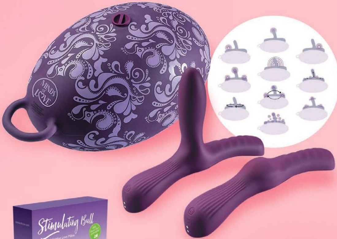
MINDS of LOVE Stimulating Ball 670000031384