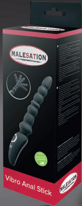
MALESATION Vibro Anal Stick 670000031607