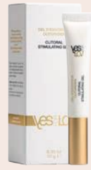
CLITORAL STIMULATING GEL 340000093182