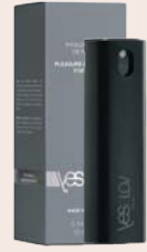
PLEASURE-PROLONGING FORMULA FOR MEN 340000093184