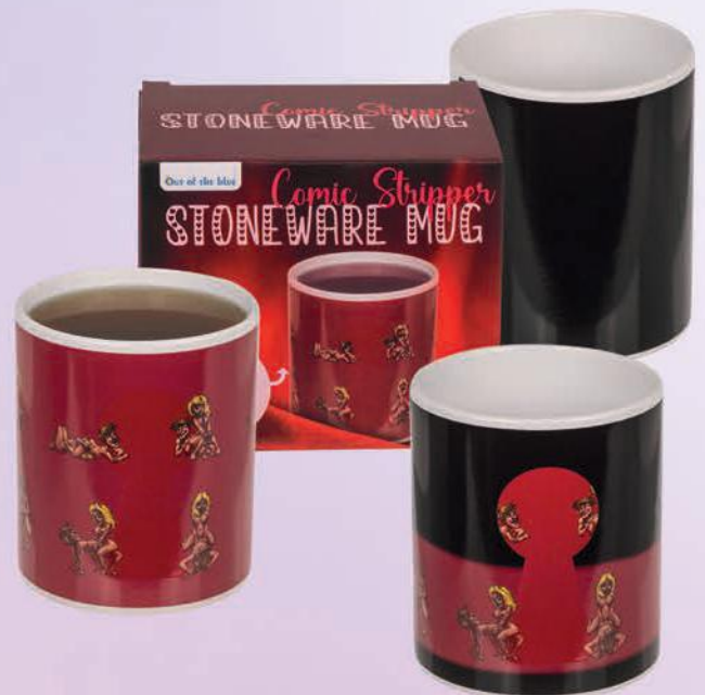
Becher Comic Stripper 550000990010