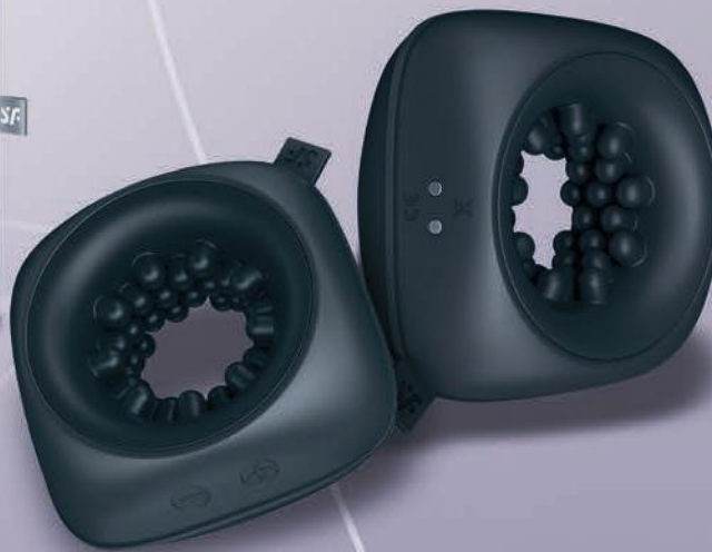
SATISFYER Ring Stroker 410000071416