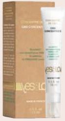
CBD CONCENTRATE BIO Organic 340000093185