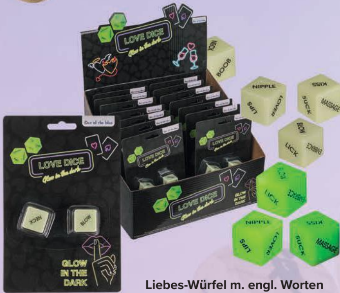
Liebes-Würfel m. engl. Worten GLOW-IN-THE-DARK 500000050010