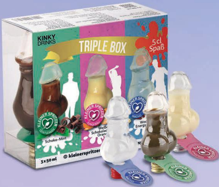
Kleiner Spritzer Triple Box (3 x 50ml) 560000050777