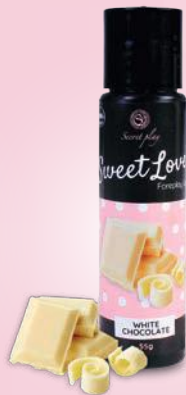
Erdbeere und weiße Schokolade White Chocolate Chocolat Blanc 340000092673