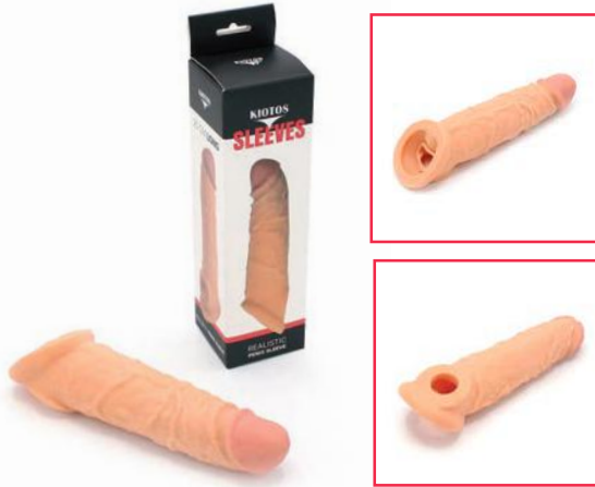
Kiotos Realistic Penis Sleeve 670000032404 📏 200 mm | Ø 42 mm