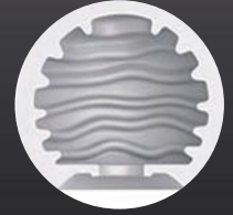
01 | MALESATION Masturbation Cup Lucky Ball type 1 680000040398