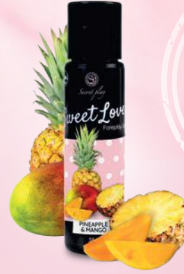
Ananas und Mango Pineapple & Mango Ananas et Mangue 340000092675