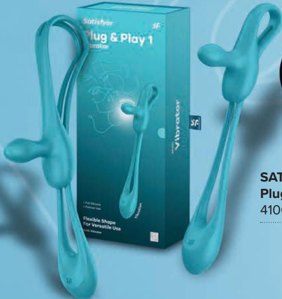
SATISFYER Plug & Play 1 410000071809