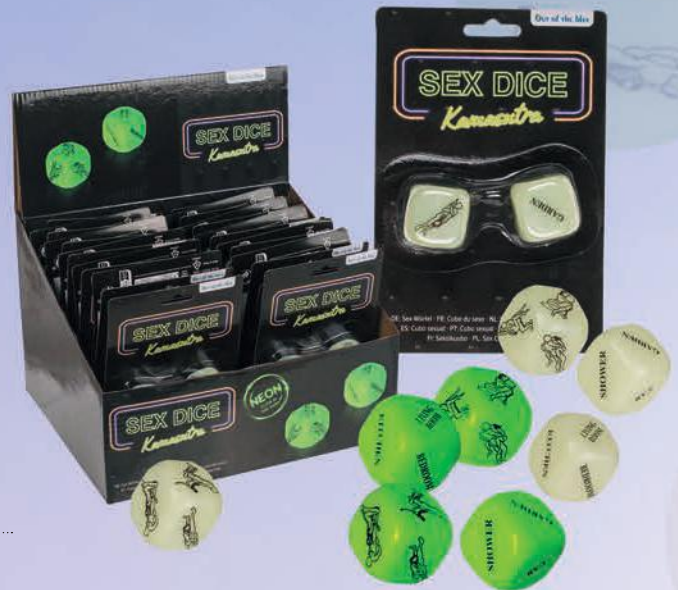
Liebes-Würfel Kamasutra GLOW-IN-THE-DARK 500000050012