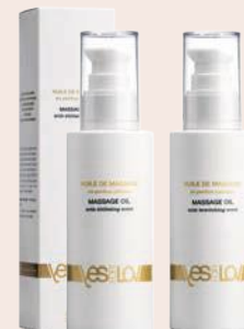
MASSAGE OIL Huile / Öl Fragrance titillating / affolante 340000093173