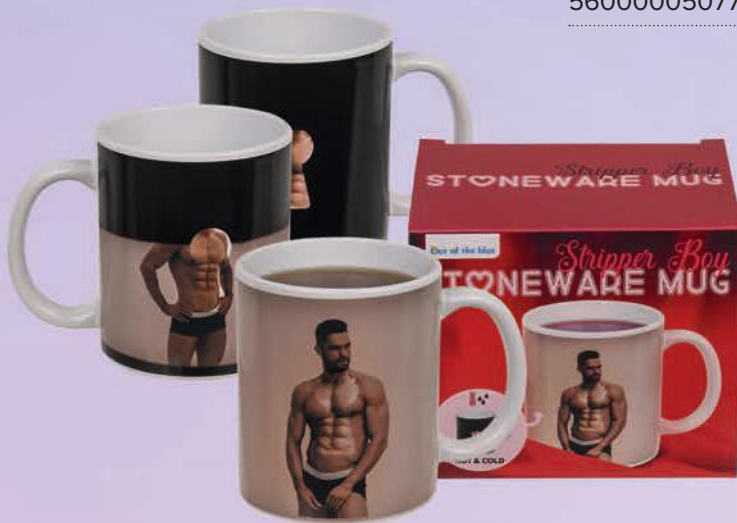
Becher Stripper Boy 550000990012