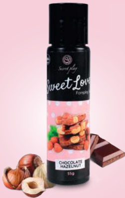
Haselnuss Schokolade Chocolate Hazelnut Chocolat - Noisette 340000092672