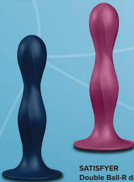
SATISFYER Double Ball-R dark blue 410000071862