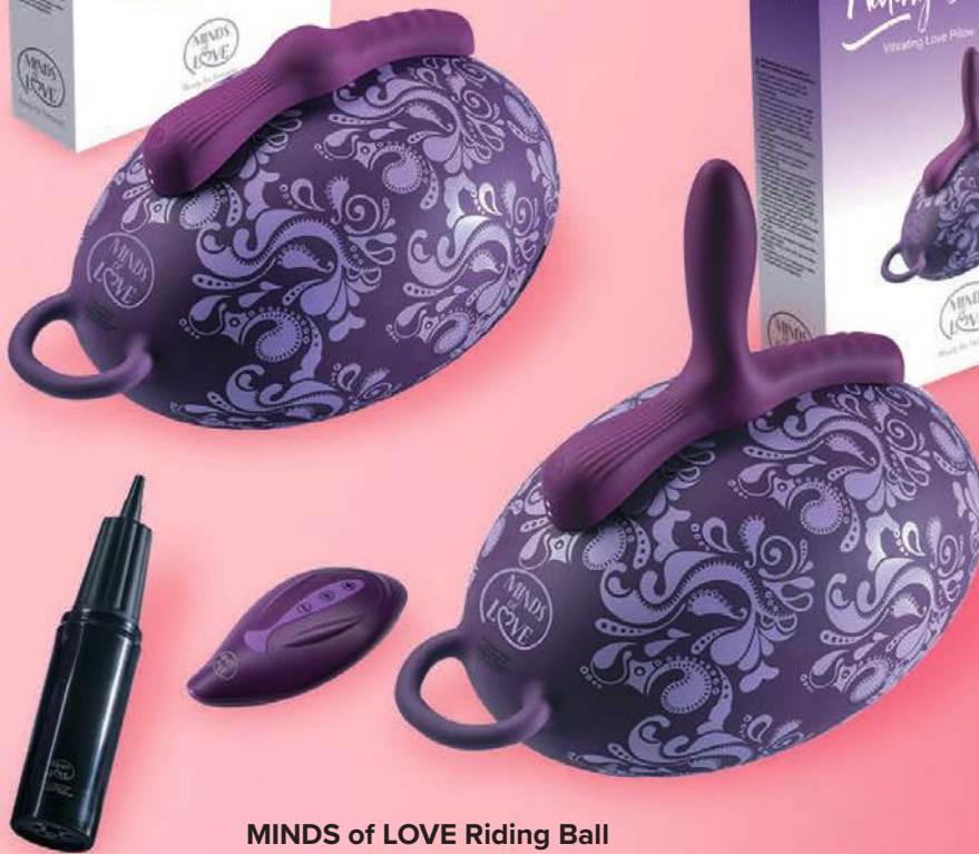
MINDS of LOVE Riding Ball 670000031383

Aufblasbares Liebeskissen mit kraftvollem Vibrationsaufsatz hergestellt aus Silikon, das durch seine Optik und Funktionalität besticht.