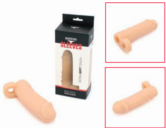
Kiotos Realistic Penis Sleeve Extra Soft Touch 670000032407 📏 160 mm | Ø 45 mm