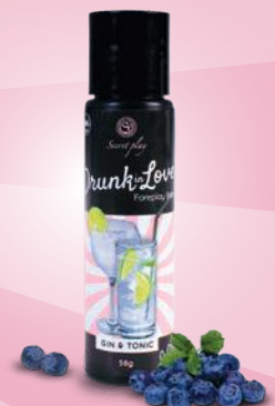
Gin Tonic | Gin & Tonic | Gin Tonic 340000092683