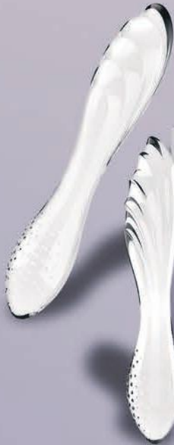
SATISFYER Dazzling Crystal 1 transparent 410000071050