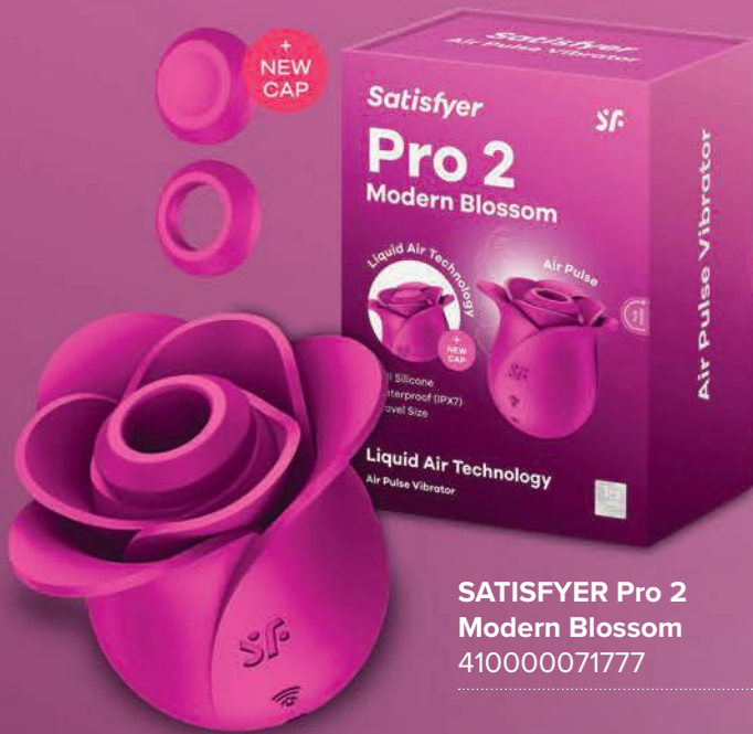
SATISFYER Pro 2 Modern Blossom 410000071777