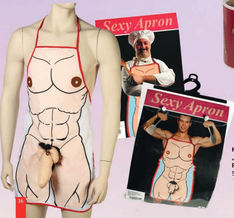
Küchenschürze „Sexy-Apron mit Plüsch-Penis“ 500000050617