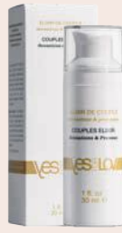
COUPLES ELIXIR 340000093180