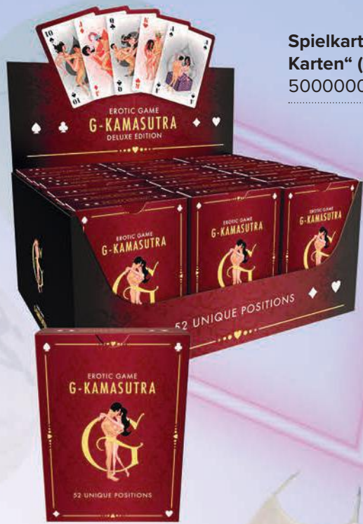
Spielkarten „Kamasutra Poker Karten“ (54 Karten) 500000050287