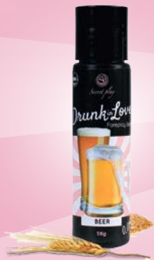
Bier | Beer | Bière 340000092680