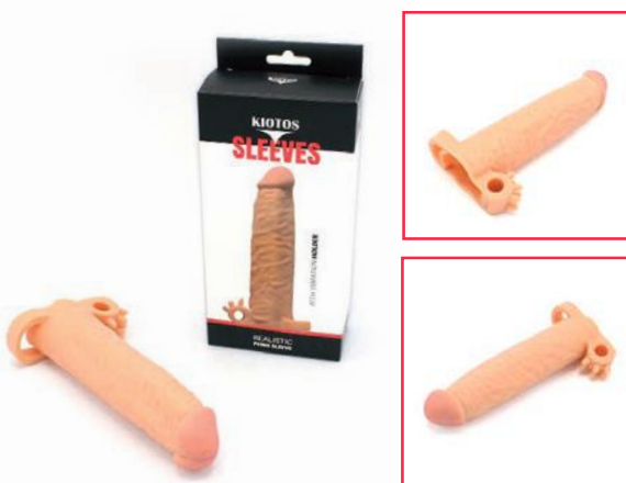
Kiotos Realistic Penis Sleeve Bullet Holder 670000032408 📏 190 mm | Ø 42 mm