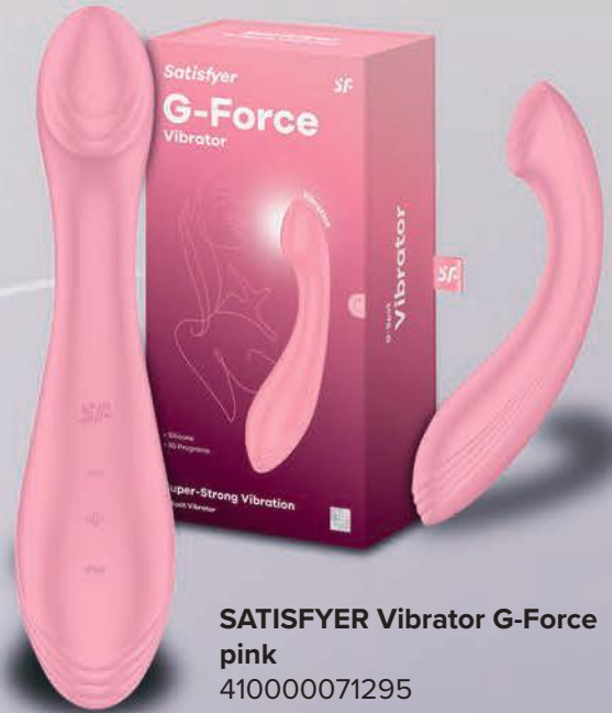
SATISFYER Vibrator G-Force pink 410000071295