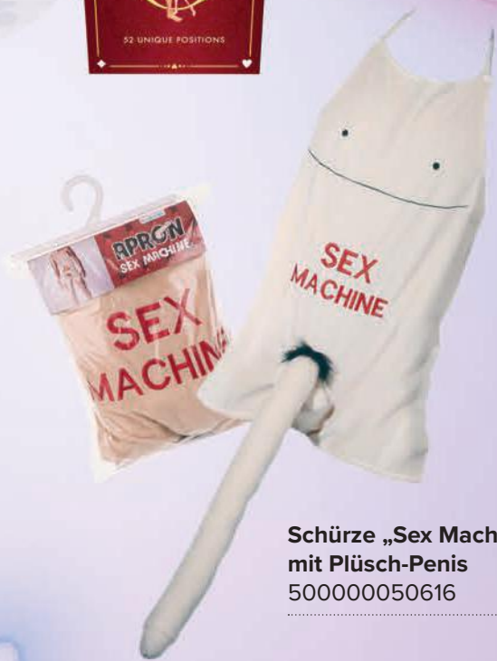
Schürze „Sex Machine“ mit Plüsch-Penis 500000050616