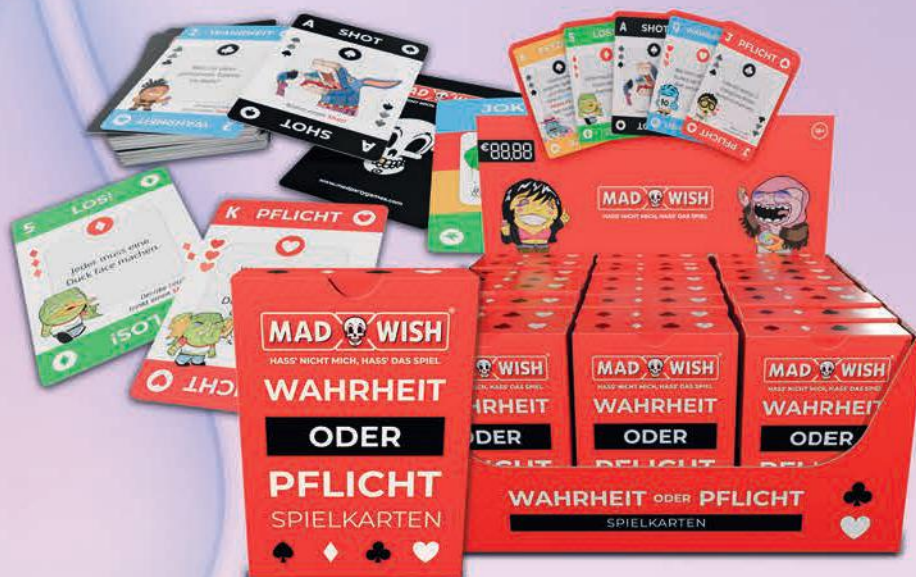
Spielkarten "Wahrheit oder Pflicht" (57 Karten) 500000050286