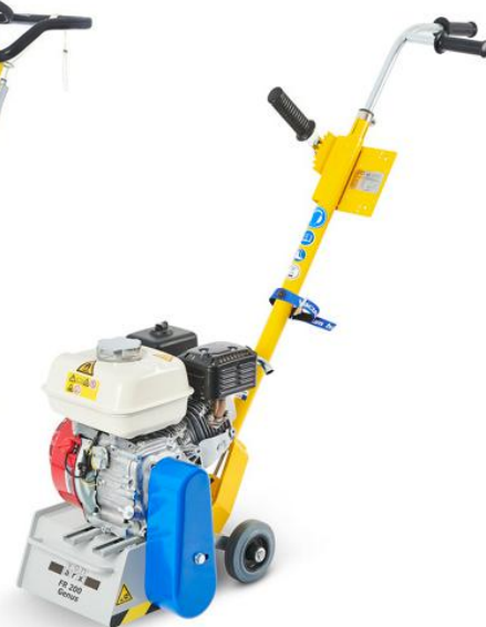
Fresemaskin Von Arx FR 200 Genus bensin