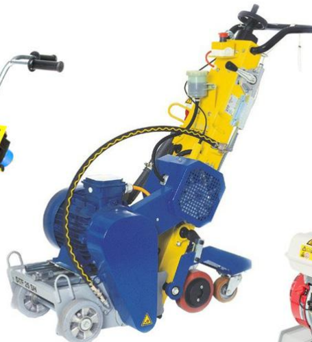
Fresemaskin Von Arx DTF 25 SH