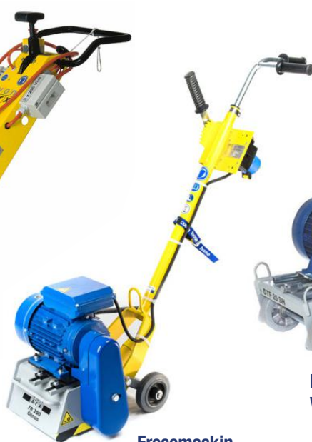
Fresemaskin Von Arx FR 200 Genus