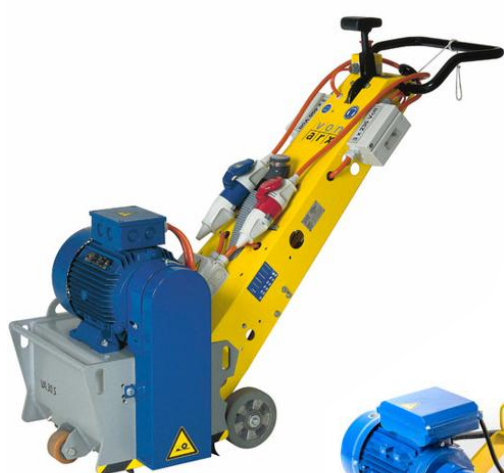
Fresemaskin VA 30S DUAL

Vi er stolte av å representere Von Arx med sin enestående teknologi og tilbyr maskiner og tilbehør med service og delelager på Alnabru.