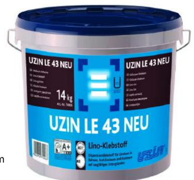
Varenr: U74906 Nobnummer: 53087485