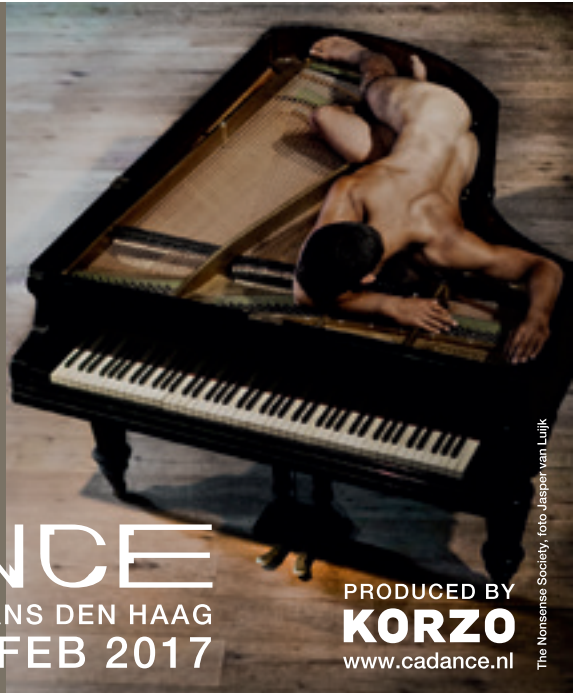
The Nonsense Society