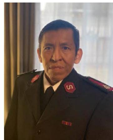
Mayor Juan Carrera Cuerpo Avenida Matta Santiago, Chile

Cualquier persona que se acerca a la Biblia necesita responder la interrogante: ¿De qué manera permito que la Biblia transforme mi conducta?