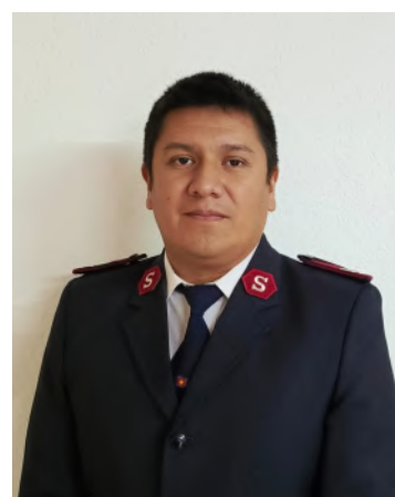
Mayor Remberto Mayta Cuerpo La Colmena Ecuador