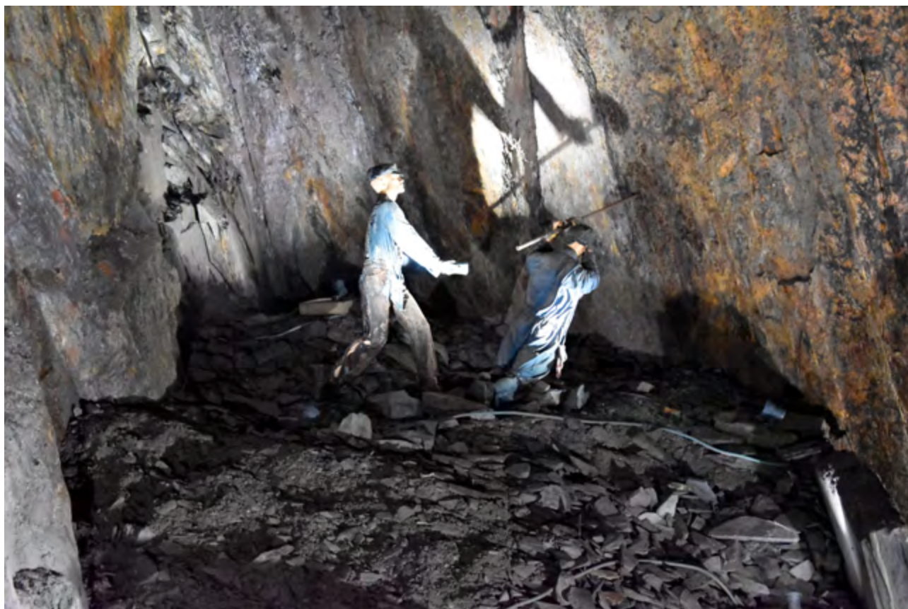
△ Des statuettes illustrent le travail des mineurs ▽ Une impressionnante galerie