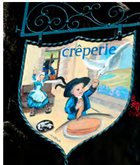
△ Crêperie ▽ Maison Henriot à Quimper

En remontant vers la Bretagne je m'arrête à Beg-Meil où j'ai réservé un bungalow dans le parc de Renouveau vacances. Locronan est une petite cité authentique avec son église devenue cathédrale au XV e siècle, conformément au vœu de François II, le père d'Anne de Bretagne, celle grâce à qui on n'a pas de péages en Bretagne. En rentrant dans l' église de Saint-Ronan , j'y vois des femmes qui passent en dessous de la statue. Il paraît que cela porte chance à celles qui désirent enfanter. Pendant plus de 200 ans, la cité était réputée pour l'industrie de la voile de bateau. Les riches demeures en pierre de taille témoignent de ce passé si riche. La Grande Troménie a lieu du 13 au 21 juillet et c'est une cérémonie religieuse très impressionnante. La prochaine aura lieu dans 5 ans. Les magasins du centre ont du charme. Il y a une librairie celtique,