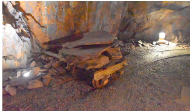
△ Un wagonnet lourdement chargé

Lors de la visite, où un équipement chaud et de bonnes chaussures sont utiles, l'histoire géologique et minéralogique de la région sont expliquées. Un spectacle lumineux clôture dans un environnement surprenant ce voyage hors du temps. Des statuettes reconstituent à divers endroits le travail des mineurs.