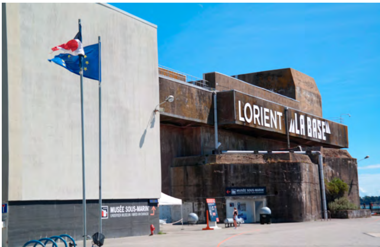
△ K1 en de Sous-Marin Flore-S645 ▽ Hoofdgebouw van de Cité de la Voile Eric Tabarly