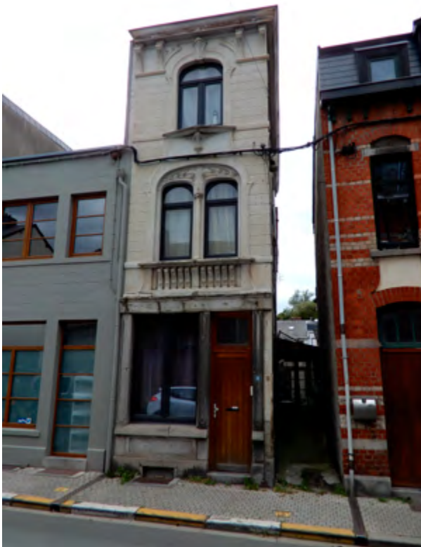
Etonnante maison étroite, N° 25 rue de Barisart