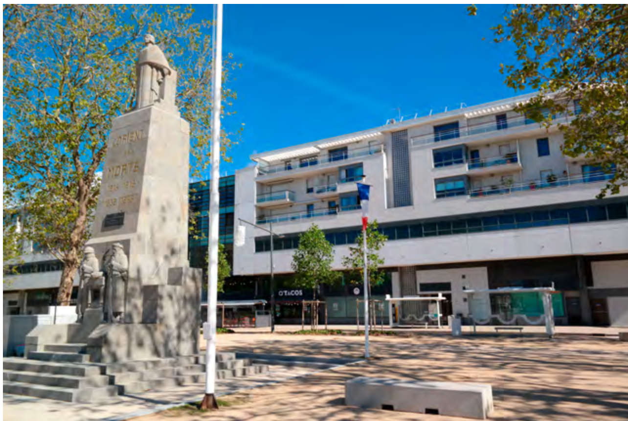
△ Monument voor de Gesneuvelden van WOI en WOII en nieuwbouw in het centrum van Lorient ▽ Flaneren langs de Quai de Rohan