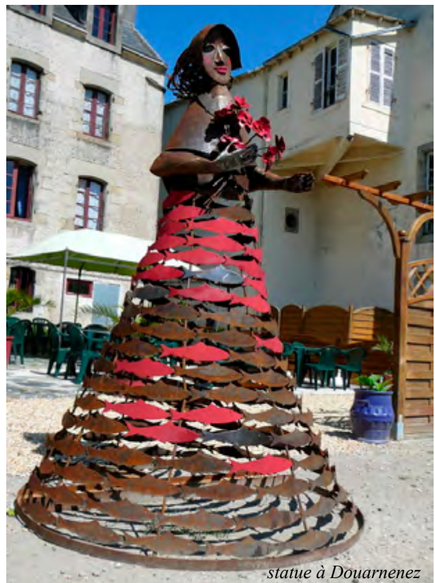
statue à Douarnenez