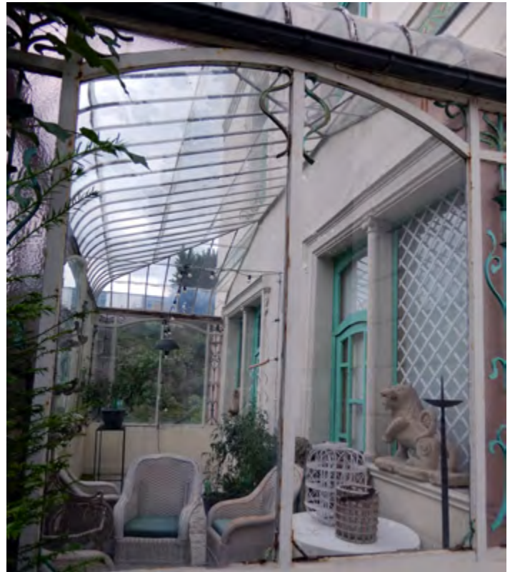
Villa « Emma » (1855) : détail de la véranda