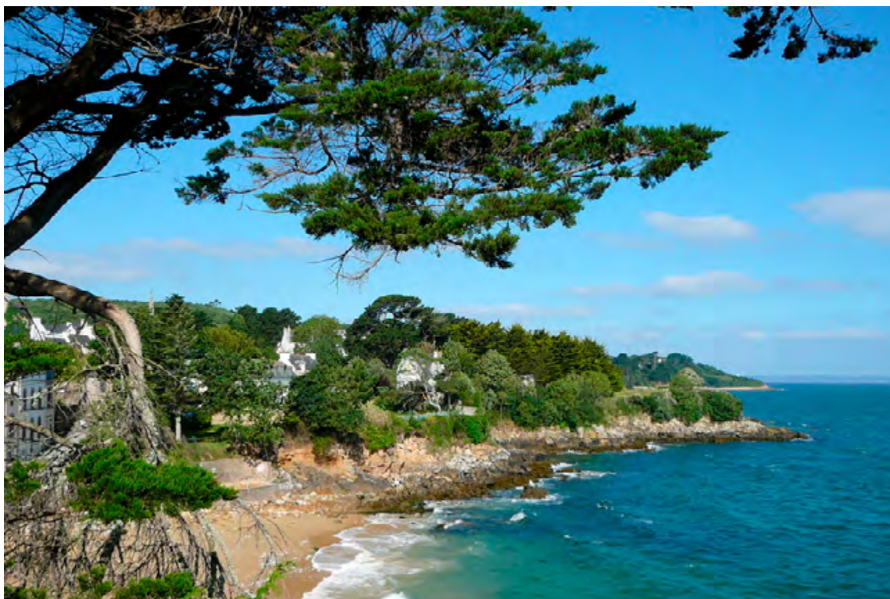
△ Côte bretonne à Douarnenez ▽ Eglise de Locronan