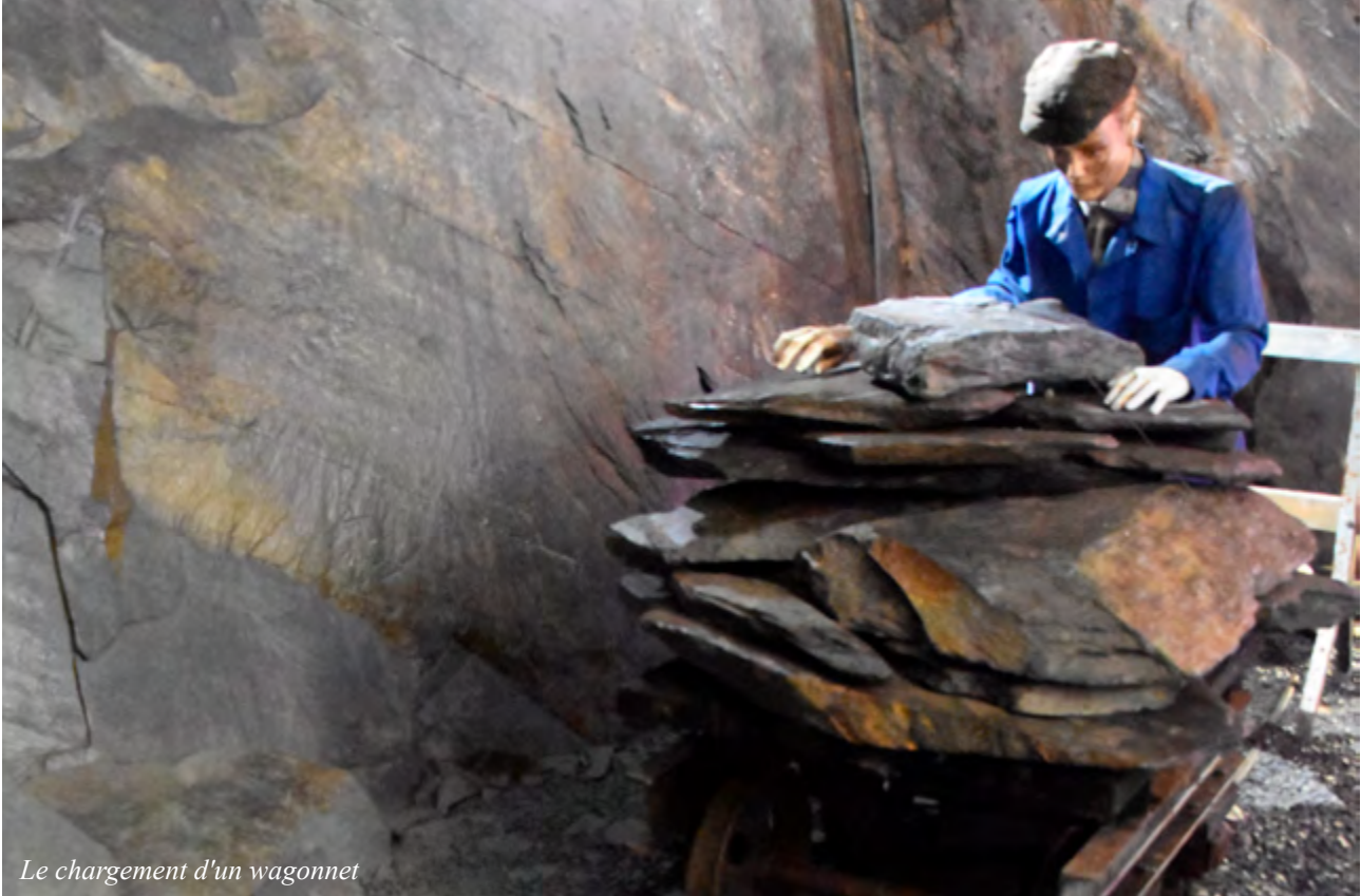
Le chargement d'un wagonnet