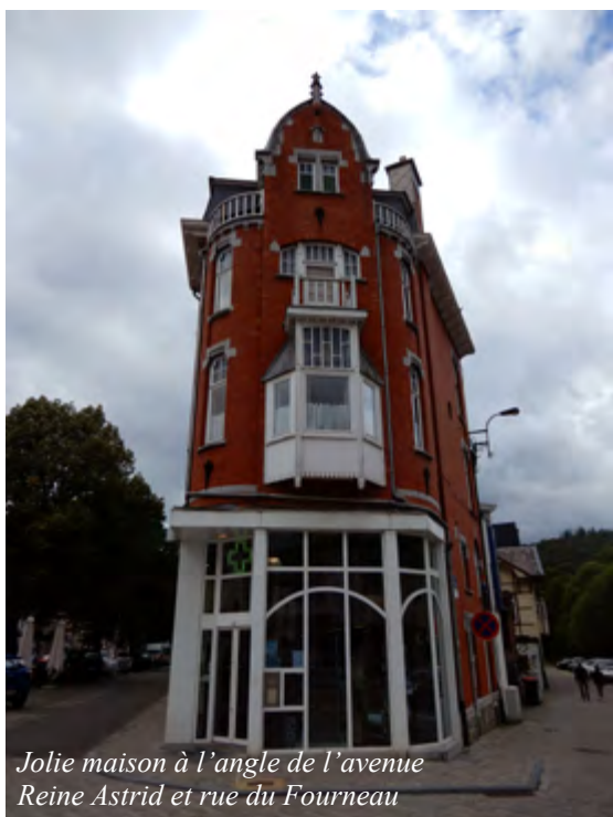
Jolie maison à l'angle de l'avenue Reine Astrid et rue du Fourneau