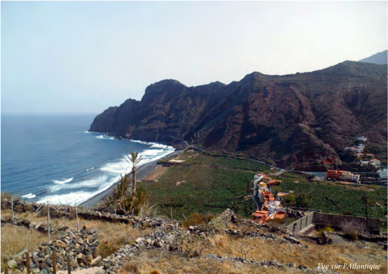
Vue sur l'Atlantique