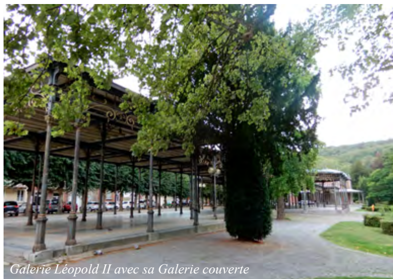
Galerie Léopold II avec sa Galerie couverte

son renom international. Après le Seconde Guerre mondiale, ce fut le développement du thermalisme social. La création depuis 1994 des Francofolies de Spa est un événement culturel d'importance nationale.