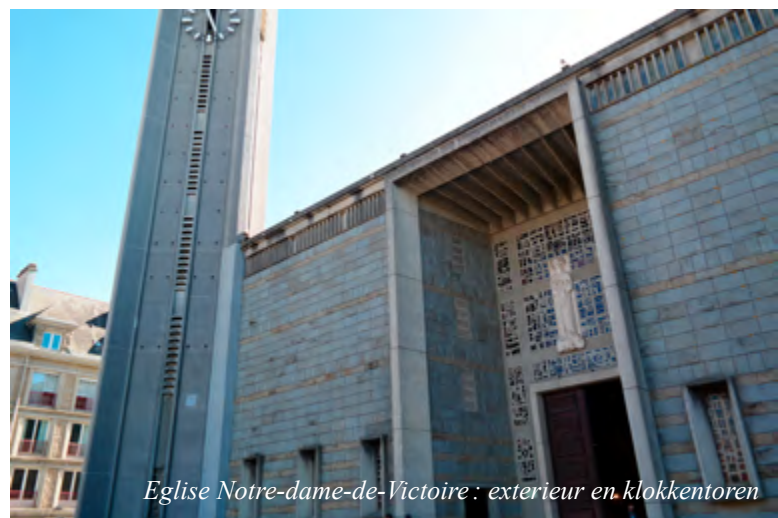
Église Notre-dame-de-Victoire: extérieur en klokkentoren