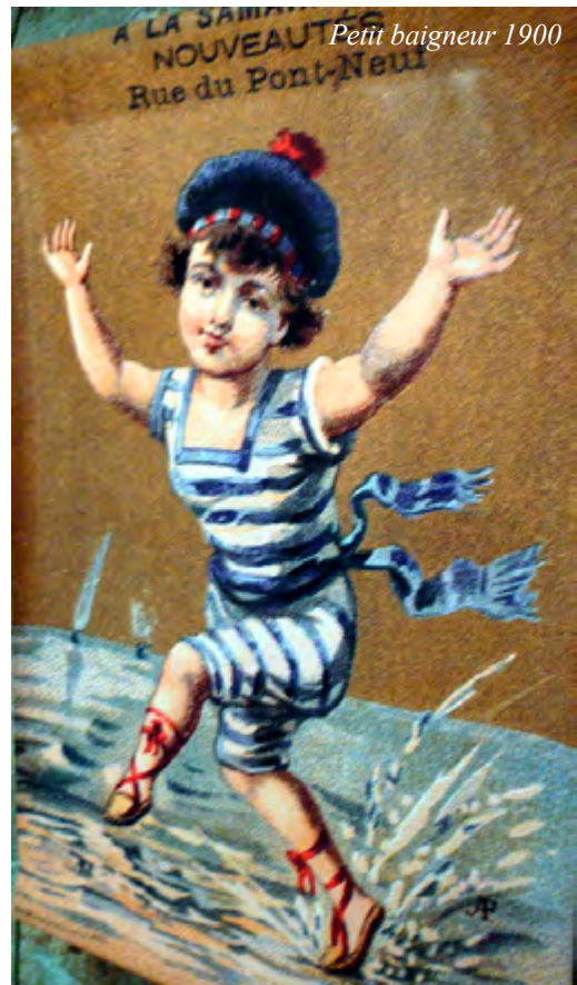
Petit baigneur 1900

C'était le lieu de prédilection des peintres, comme Paul Gauguin, qui y créa une école. L'Aven, avec ses allures de petit torrent capricieux, peut être admiré le long de la promenade de Xavier Grall , un journaliste et poète du XX e siècle. La luminosité exceptionnelle du site a toujours attiré les artistes et de nombreuses boutiques exposent leurs œuvres. Les promenades au Bois d'amour permettent de