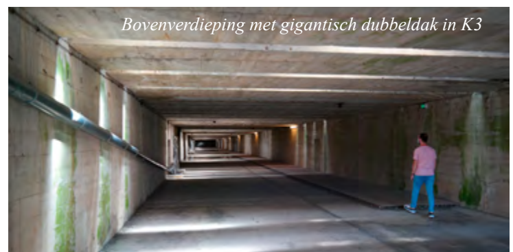
Bovenverdieping met gigantisch dubbeldak in K3