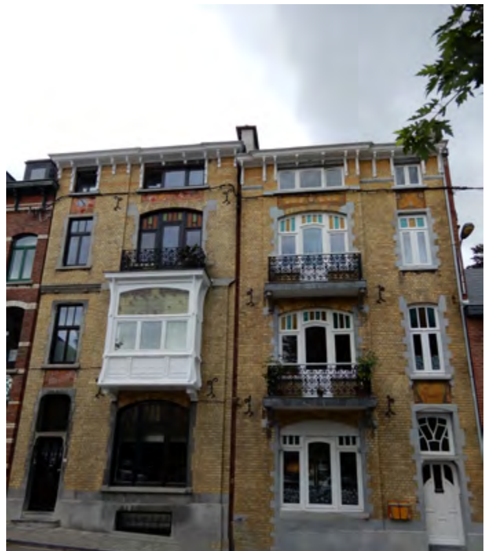
Superbes maisons, 31-33 place des Ecoles : « Les Marronniers » et « Les Papillons »