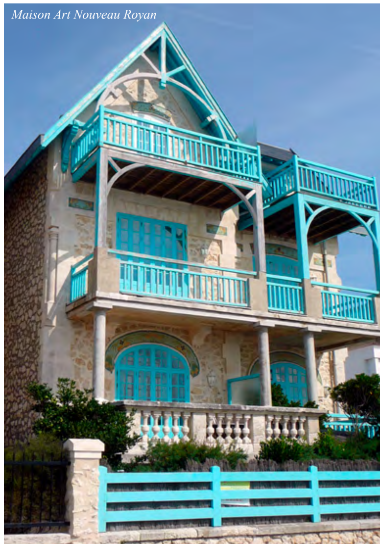
Maison Art Nouveau Royan