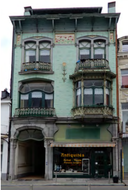
Exceptionnelle maison à motifs floraux de l'industriel Collard, rue du Marché N°20