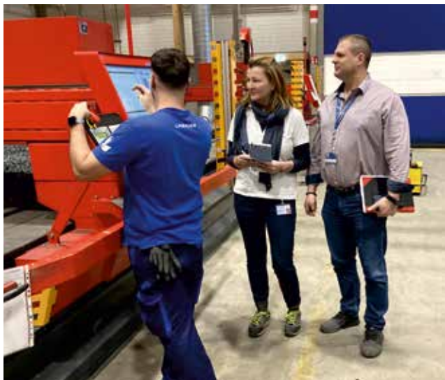
Das Plasmaschneidegerät in der Halle für Schweißtechnik – hier wird Schwarzstahl geschweißt und hier kann der Schweißrauch ganz schön dicht werden.

Wenn nicht gerade eine der vorgeschriebenen Untersuchungen ansteht, widmet sich die Arbeitsmedizinerin in ihren Sprechstunden den individuellen Gesundheitsthemen der Lindner-Mitarbeitenden, da geht es neben der schnellen Hilfe in persönlichen Gesundheitsfragen um Einstellungsuntersuchungen bei neuen Lehrlingen und Unterstützung beim Mutterschutz, bei längeren Krankenständen sowie natürlich bei der Wiedereingliederung. Die restliche Zeit wird für laufende Ergonomie-Beratungen direkt an den Arbeitsplätzen, die Überarbeitung der Sicherheits- und Gesundheitsschutzdokumente und Gespräche mit der HR-Managerin von Lindner Recycling verwendet. Letztere sind der Arbeitsmedizinerin besonders wichtig, da ihr natürlich durch den direkten Kontakt zu den Mitarbeitenden so manches auffällt, das noch verbessert werden kann. So ist im Kalenderjahr 2024 bereits einiges neu innerhalb der Betreuungsstunden, wie der Ausbau des Impfangebots, speziell für den Auslandseinsatz, die Evaluierung der psychischen Belastungen und die Durchführung von Sehtests für die 150 Bildschirmarbeitsplätze.