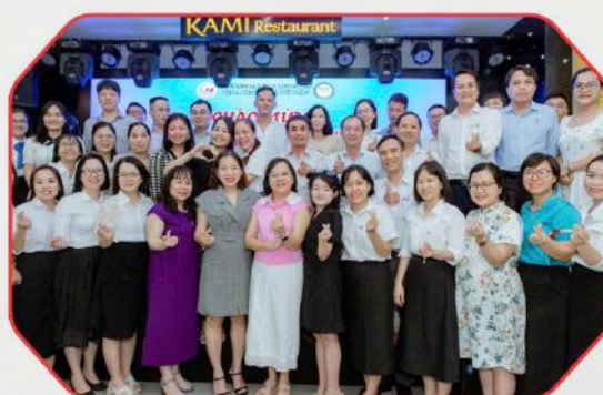
Giao lưu với các đối tác nhân ngày Doanh nhân Việt Nam (Networking and engagement activities with partners on the occasion of Vietnamese Entrepreneurs' Day)