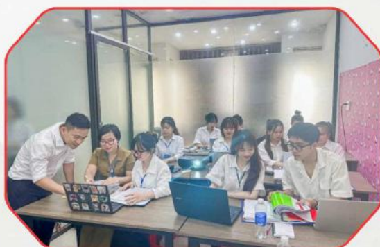
Sinh viên tham gia thực tập tại doanh nghiệp (Students participating in internships at enterprises and businesses)