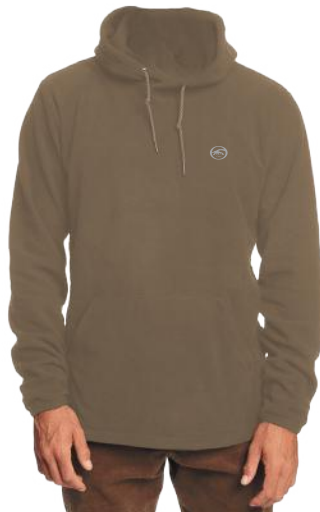
› VARIANTE 2