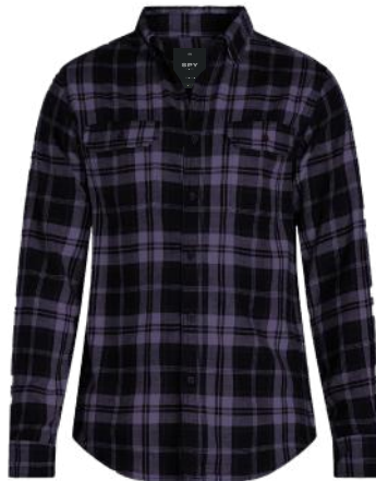
› VARIANTE 2