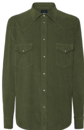
› VERDE MILITAR