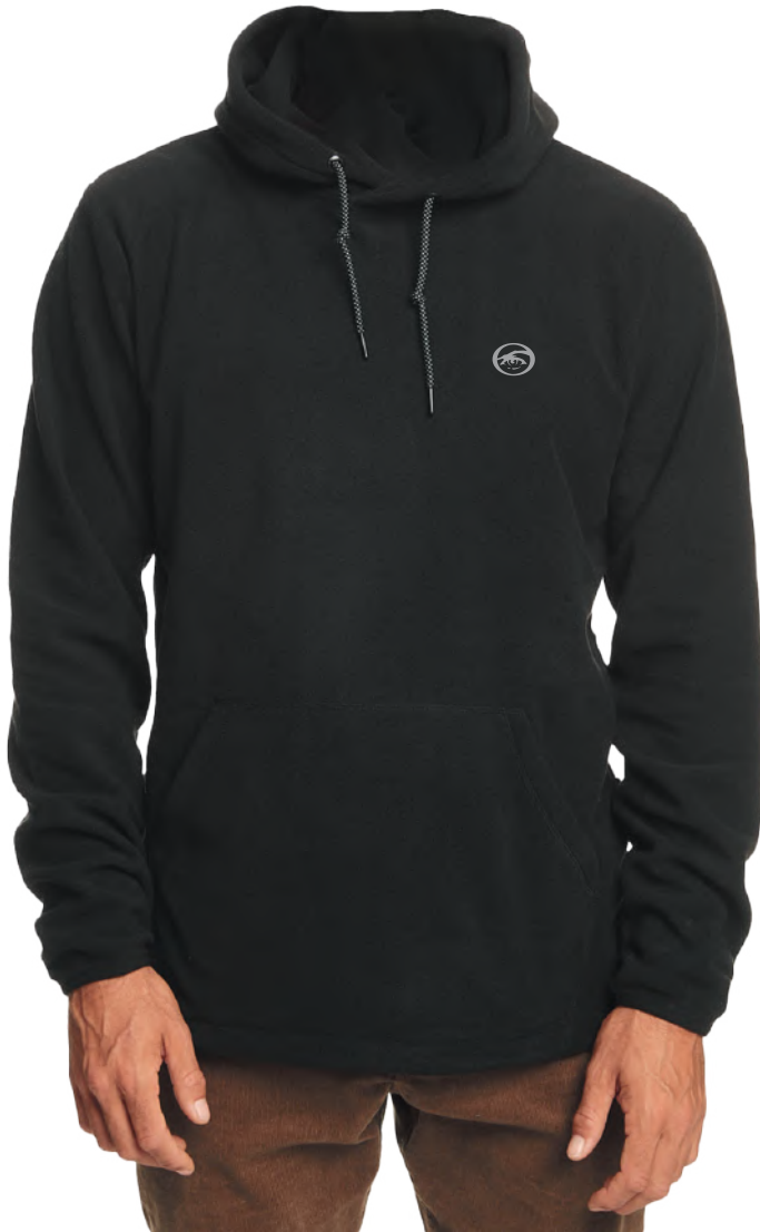
› VARIANTE 1