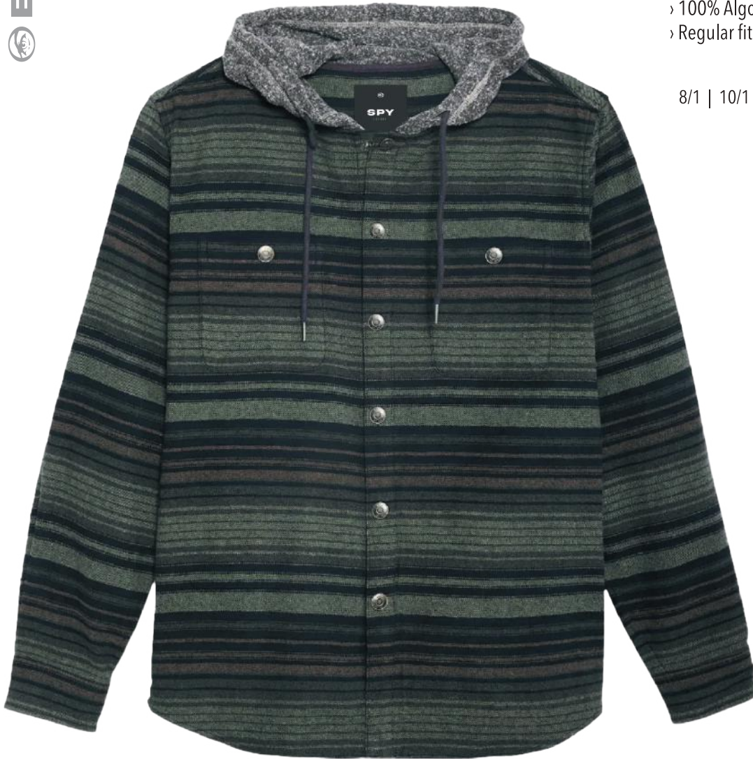
› VARIANTE 1