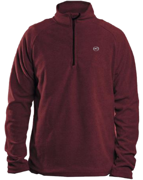
› VARIANTE 2