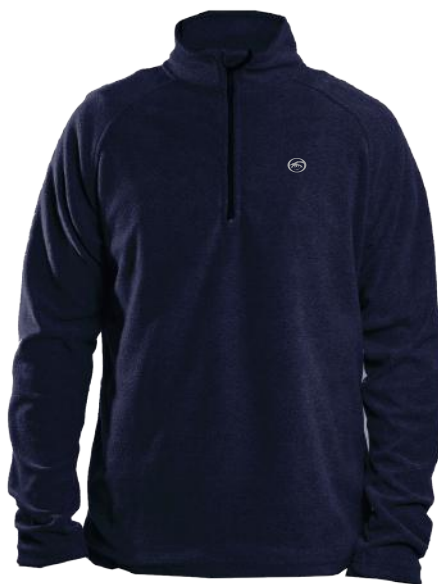
› VARIANTE 3