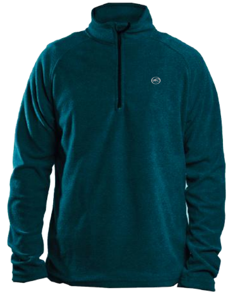
› VARIANTE 5