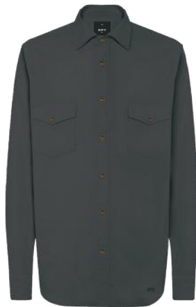
› VARIANTE 2