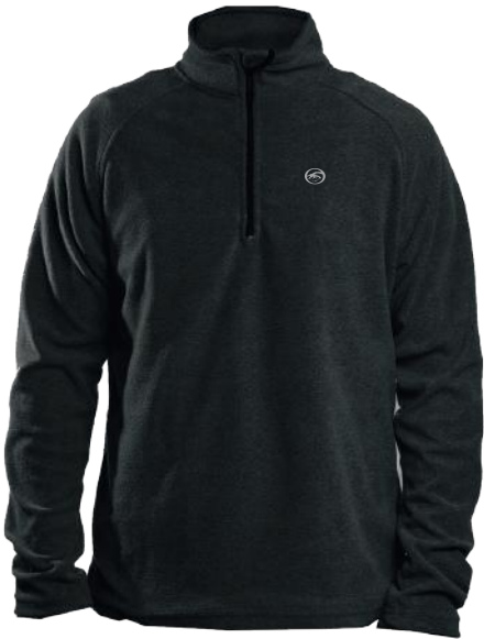
› VARIANTE 3