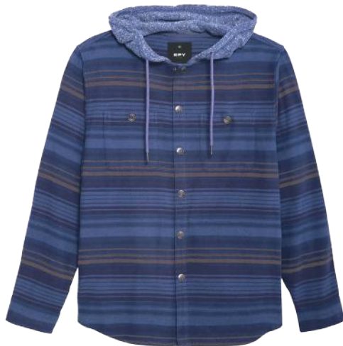
› VARIANTE 2