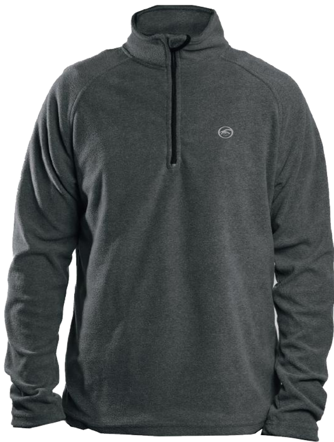
› VARIANTE 1