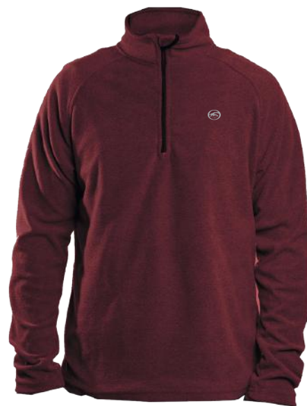
› VARIANTE 4