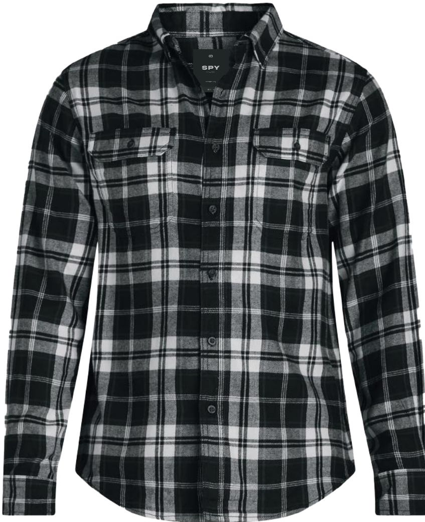
› VARIANTE 1