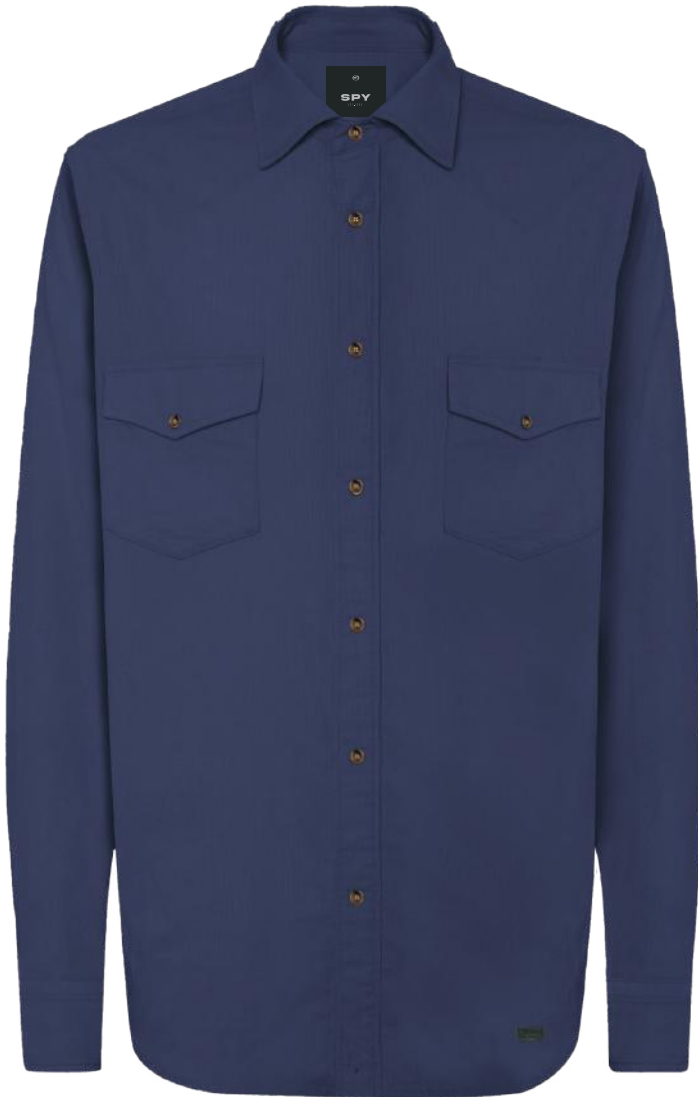
› VARIANTE 1