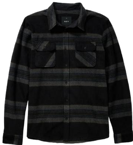
› VARIANTE 2