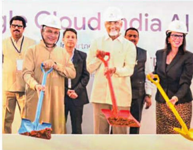
ஆந்திர மாநிலம் விசாகப்பட்டினத்தில் செவ்வாய்க்கிழமை நடைபெற்ற கூகுள் நிறுவன ஏஐ மையம் அடிக்கல் நாட்டு விழாவில் பங்கேற்ற மத்திய தகவல் தொழில்நுட்ப அமைச்சர் அஸ்வினி வைஷ்ணவ், முதல்வர் சந்திரபாபு நாயுடு உள்ளிட்டோர்.