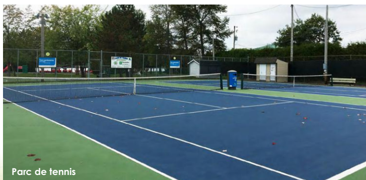
Parc de tennis