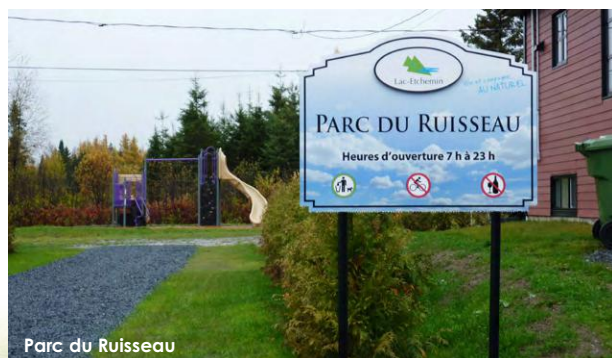
Parc du Ruisseau