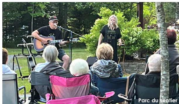
Parc du sentier

545, Route des Sommets 305, rue Ferland 211, 1 ère Avenue (près de) 213, 1 ère Avenue (près de)