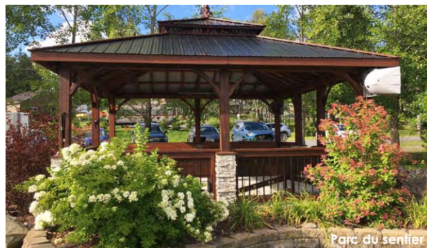
Parc du sentier