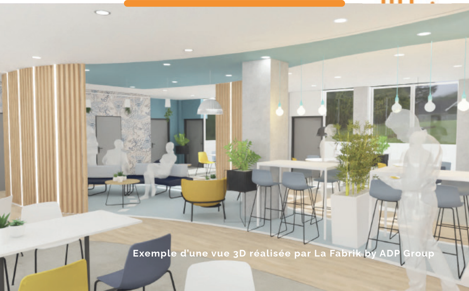
Exemple d'une vue 3D réalisée par La Fabrik by ADP Group