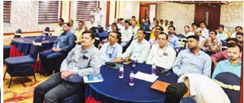
संगोष्ठी में उपस्थित नराकास के सदस्य कार्यालयों के उपस्थित अधिकारी व कार्यपालकगण