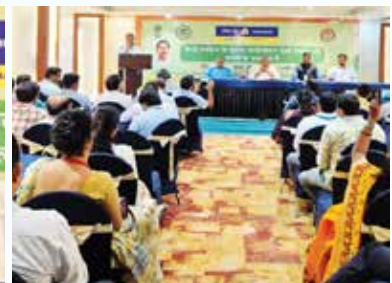
नराकास (बैंक एवं बीमा), पटना के सदस्य कार्यालयों की सहभागिता