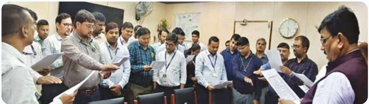
राजभाषा प्रतिज्ञा एवं माननीय गृह एवं सहकारिता मंत्री श्री अमित शाह के संदेश का पाठ करते हुए अंचल प्रबंधक, उप अंचल प्रबंधक, मुख्य प्रबंधकगण व अन्य अधिकारीगण व कर्मचारीगण।