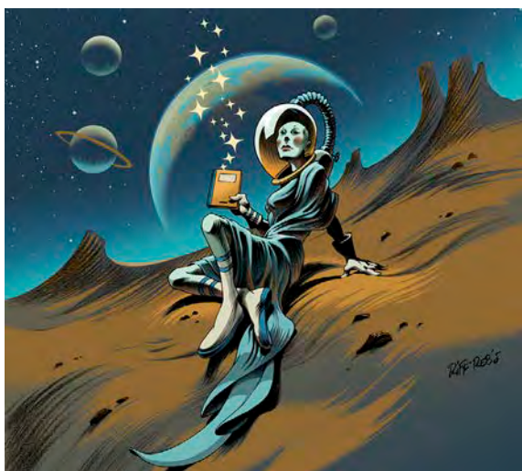
L'affiche de cet 14e édition est signée Riff Reb's. © Riff Reb's

✓ Festival interplanétaire de bande dessinée, samedi 6 juin, à 14 h 30, et dimanche 7 juin, à 10 h 30, Le Temps des cerises, rue Marie-Dominique-Maingot, Reims. Gratuit.