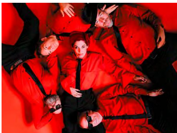
Superbus sera sur la grande scène du festival le vendredi 12 juin.

✓ Festival des 2 Rivières, du vendredi 12 au dimanche 14 juin, Espace des 2 rivières, La Ferté-sous-Jouarre (Seine-Maritime). Tarifs : de 35 € un jour à 95 € le pass 3 jours, gratuit pour les moins de 6 ans. Infos : festivaldes2rivieres.com