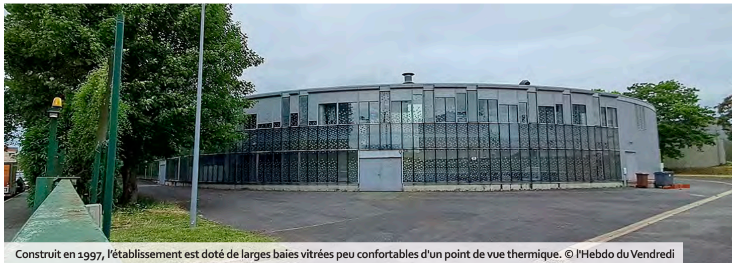
Construit en 1997, l'établissement est doté de larges baies vitrées peu confortables d'un point de vue thermique.

Le marché a finalement été attribué en mai 2025 à un cabinet d'architectes de Pantin (Seine-Saint-Denis) et les études engagées en juillet suivant. Mais en mars dernier, le conseil départemental a