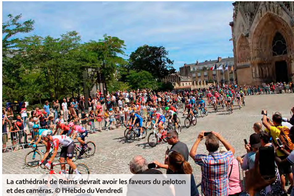
La cathédrale de Reims devrait avoir les faveurs du peloton et des caméras.