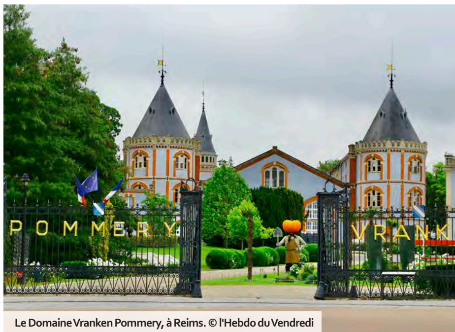
Le Domaine Vranken Pommery, à Reims.

Cotée en bourse, Pommery a publié, le 30 mars dernier, un résultat net positif de 32 M€, mais aussi une dette financière très lourde de 754,4 M€. Le groupe serait par ailleurs dans l'attente du bouclage de son refinancement avec les banques. Dans ce contexte, l'assemblée générale appelée à statuer sur les comptes 2025, ini-