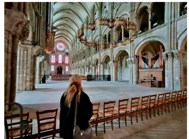
Depuis la fin du mois d'avril, la nef de la basilique Saint-Remi est inaccessible au public.

L'autre bonne nouvelle concerne Lotchi, la société d'événementiel qui avait lancé son spectacle Luminiscence dans l'édifice religieux à la mi-avril et avait été contrainte de l'interrompre après seulement deux semaines. La deuxième édition de ce spectacle son et lumière, baptisée « L'Odyssée céleste », fera son retour « à compter du 20 juin ». Les spectateurs concernés par une annulation vont recevoir, ou ont déjà reçu, un courriel afin de reprogrammer leur venue. La jeune société, créatrice de spectacles multimédias, craignait une perte d'un million d'euros en cas d'annulation pure et simple, alors qu'elle avait accueilli plus de 50 000 spectateurs l'an passé.