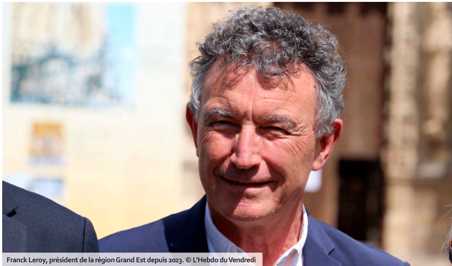
Franck Leroy, président de la région Grand Est depuis 2023.

Les exemples sont nombreux. Aujourd'hui, l'ensemble du Grand Est dispose de la fibre optique, là où il y a dix ans, tout le monde en rêvait et pensait que ça n'arriverait jamais. On a investi 800 M€ pour soutenir les territoires ruraux depuis 2016, accompagné 27 000 entreprises et près de 12 000 exploitations agricoles. Environ 18 000 emplois ont pu être créés grâce à cela. La région a aidé près de 1 000 communes dans leurs projets d'installation de commerces de proximité et de développement d'équipements périscolaires ou culturels. On a également doté tous les lycéens d'un ordinateur porta-