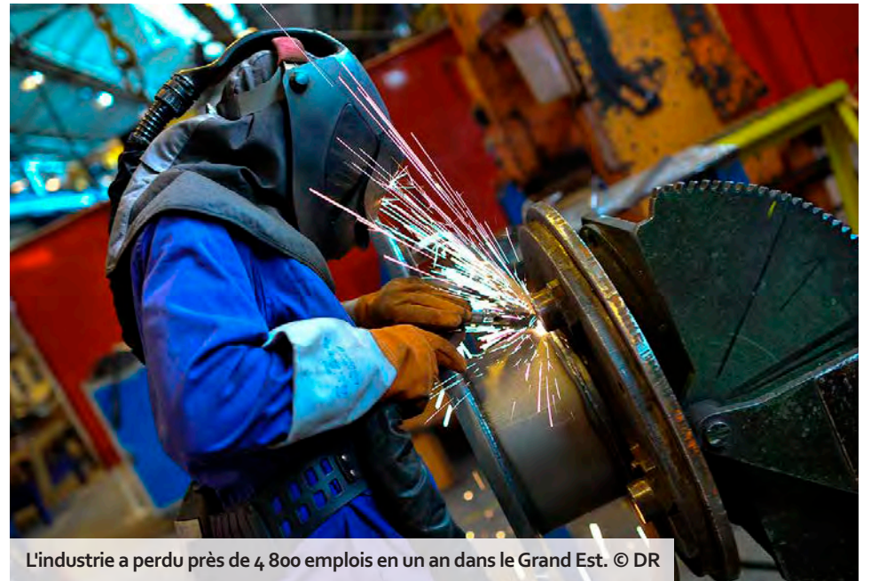
L'industrie a perdu près de 4 800 emplois en un an dans le Grand Est.

Les indicateurs consolidés par le Ceser illustrent une situation conjoncturelle fragile dans le Grand Est, en particulier pour le secteur de l'industrie. Le commerce extérieur et le tourisme tirent leur épingle du jeu.