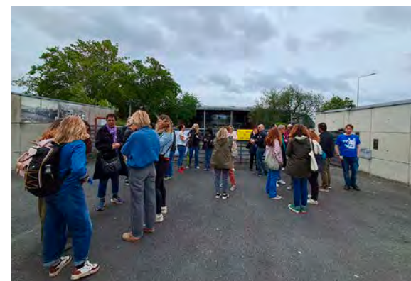
De nombreux enseignants, AED et AESH étaient en grève, jeudi 4 juin.

L e climat scolaire est également délicat au collège Maryse-Bastie. Fin mars, enseignants et personnels avaient observé une journée de grève pour réclamer davantage de moyens et contester la suppression de l'UPE2A, une classe destinée aux nouveaux arrivants ne maîtrisant pas totalement la langue française. Deux mois plus tard, les revendications restent inchangées. Les élèves ont été renvoyés chez eux, jeudi 4 juin, face à une grève très suivie par les enseignants, les assistants d'éducation (AED) et les accompagnants d'élèves en situation de handicap (AESH).