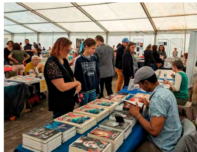
La Fête du livre de Fismes a lieu tous les deux ans.

✓ L'Amour fait livre, dimanche 7 juin, à partir de 10 h, allée Goscinny-Uderzo, Fismes.