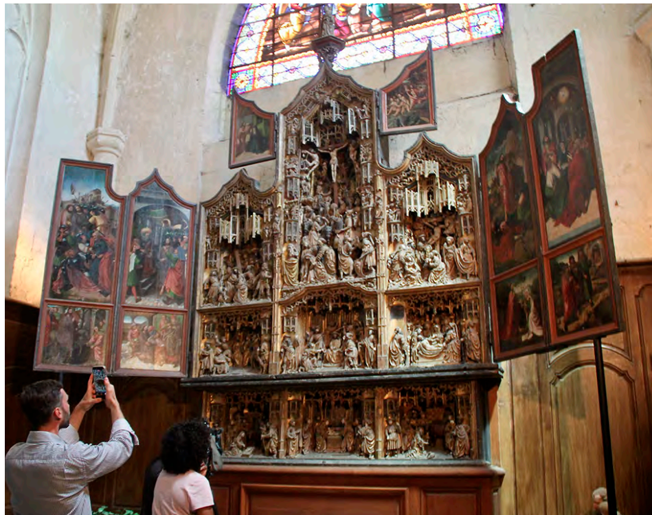
Le retable mesure plus de 4 mètres de haut sur près de 3 mètres de large.

« Avec 3 273 voix, soit 59 % des suffrages, l'œuvre a été largement plébiscitée par le public », a souligné Maude Sorlat, chargée de projets pour Le Plus grand musée de France, lors de la remise officielle du prix qui s'est tenue ce lundi 1 er juin. Cette mobilisation a permis de décrocher une dotation de 8 000 €, offerte par Allianz France, qui n'est cependant pas suffisante pour sa restauration. La Fondation du patrimoine Champagne-Ardenne a ainsi profité de cette mise en lumière pour lancer, le même jour, une grande collecte de