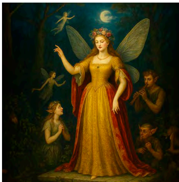
« The Fairy Queen », un semi-opéra où s'entremêlent amour, nature et magie.

Mis en scène par Olivier Baert, cette version emmène l'ensemble La Cantate du café et des chanteurs et danseurs issus du Conservatoire de Reims.