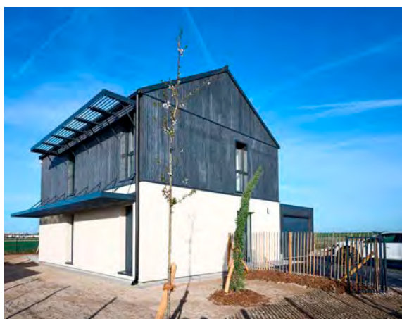
Il s'agit d'une maison de type 5 et une autre de type 3.

Inergeen met en avant un triptyque avantageux qualité-coût-délai. Grâce à ses sous-traitants principalement locaux (onze sur douze sont Marnais ou Ardennais) et à un modèle modulaire, l'essentiel de l'assemblage est réalisé hors site. Le projet a ainsi été livré en moins d'un an, avec un chantier sur site d'à peine deux mois. « Cette approche constructive contribue à une réduction d'environ 45 % des émissions de CO2 par rapport à une construction conforme à la RE 2024 », assure Plurial Novilia. Ces deux maisons « pilotes » à Bétheny vont faire des émules. Inergeen doit livrer prochainement 24 logements seniors en Saône-et-Loire et sept pavillons à Troyes pour les bailleurs Habellis et Mon Logis, toutes filiales du groupe Action Logement, comme Plurial Novilia.