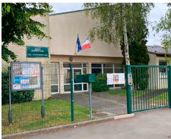
L'école élémentaire de Bétheny compte 275 élèves.