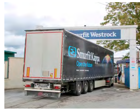
L'entrée du site de Smurfit Westrock à Épernay.

À l'échelle nationale, un niveau record de 93 milliards d'euros d'investissements étrangers a été annoncé lors de Choose France, représentant plus de 15 000 emplois potentiels, dont 45 milliards d'euros par l'entreprise japonaise SoftBank, pour un projet colossal de data centers devant voir le jour d'ici à 2031.