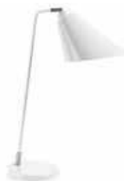
Table lamp in metal and wood with articulated arm. For E-14 bulb not included. Lámpara de sobremesa en metal y madera con brazo articulado. Para bombilla E-14 no incluida.