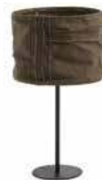
Table lamp with wood and metal base. Cotton fabric shade. For E-14 bulb not included. Lámpara de sobremesa con pie en madera y metal. Pantalla de algodón. Para bombilla E-14 no incluida.