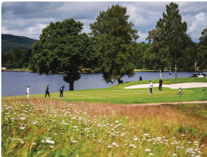
- og lande på greenen på hull 16 på det helt perfekte stedet - midt i koppen!