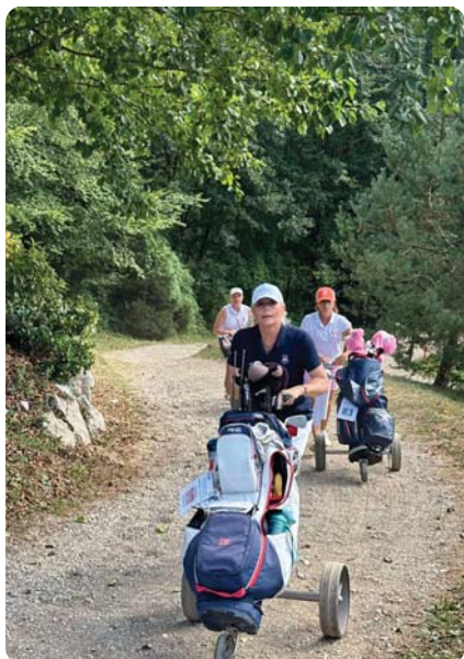
Oppoverbakke til neste hull.