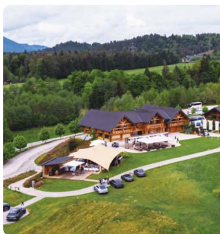
Klubbhuset - Cubo Golfklubb