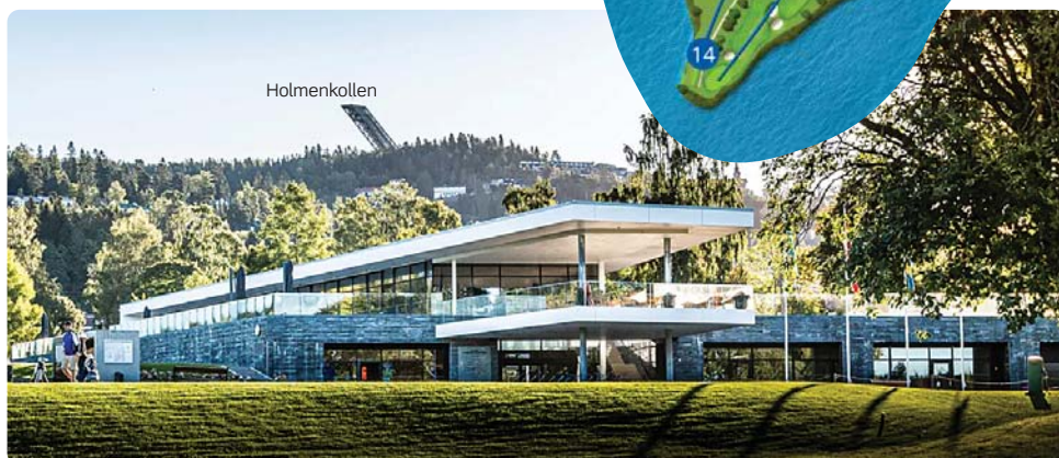
Klubbhuset på Bogstad