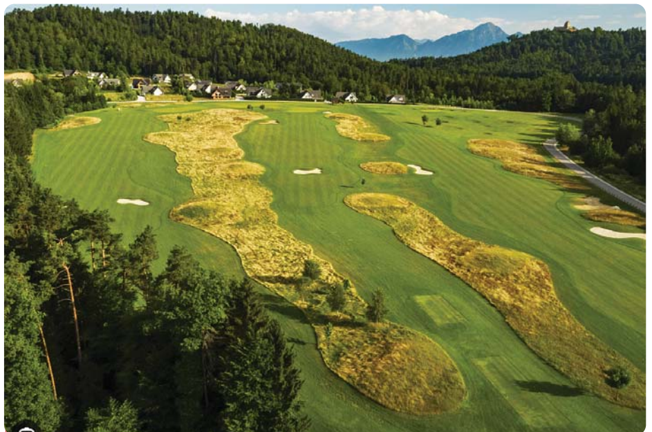
Banen - Cubo Golfklubb