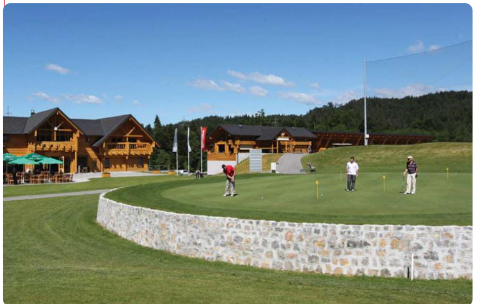
Treningsgeen og klubbhus - Cubo Golfklubb