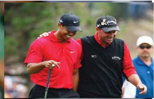
Tiger Woods & Rocco Mediate