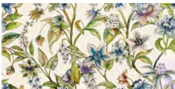
GENUS 50x100 - 19,6"x39,2" 6001313 AVORIO 80 ■