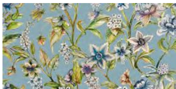
GENUS 50x100 - 19,6"x39,2" 6001312 AVIO 80 ■