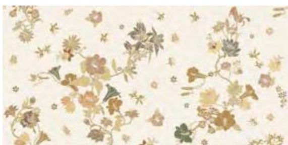
SETA A+B 50x100 - 19,6"x39,2" 6001311 AVORIO