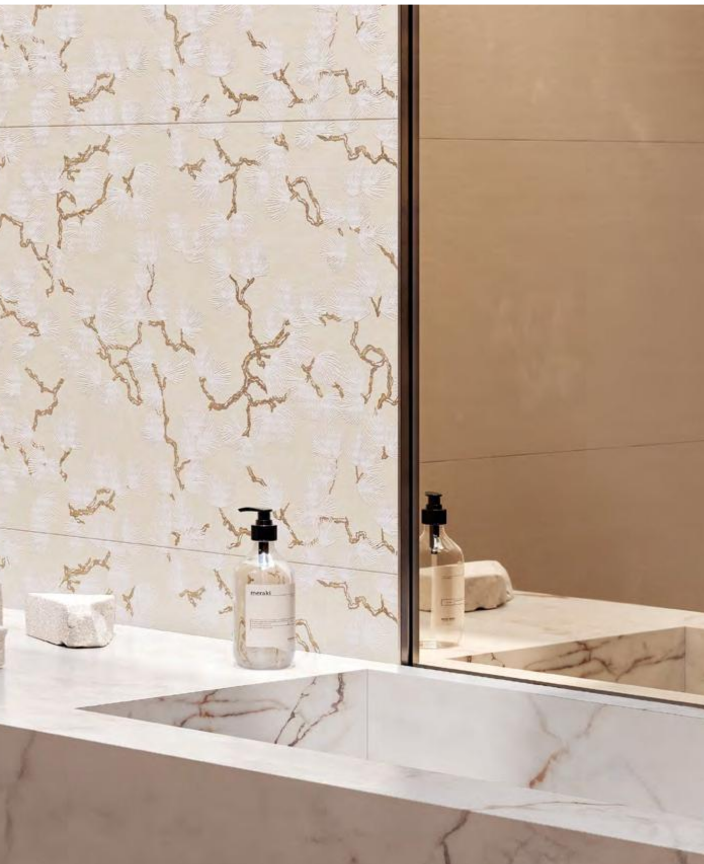
Bloom Loto Avorio 50x100 / 19,6"x39,2" - Trama Avorio 50x100 / 19,6"x39,2" - Grandiosa Luce Oro Satin 120x280 / 47,2"x110,2"