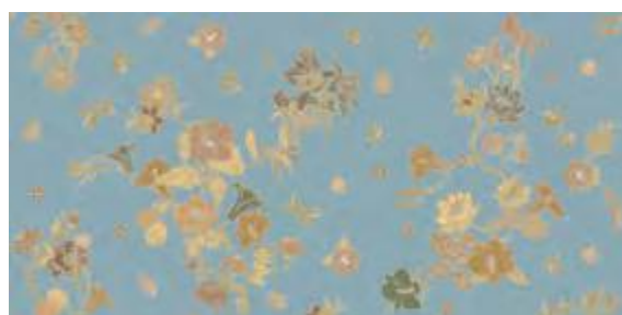
SETA A+B 50x100 - 19,6"x39,2" 6001310 AVIO