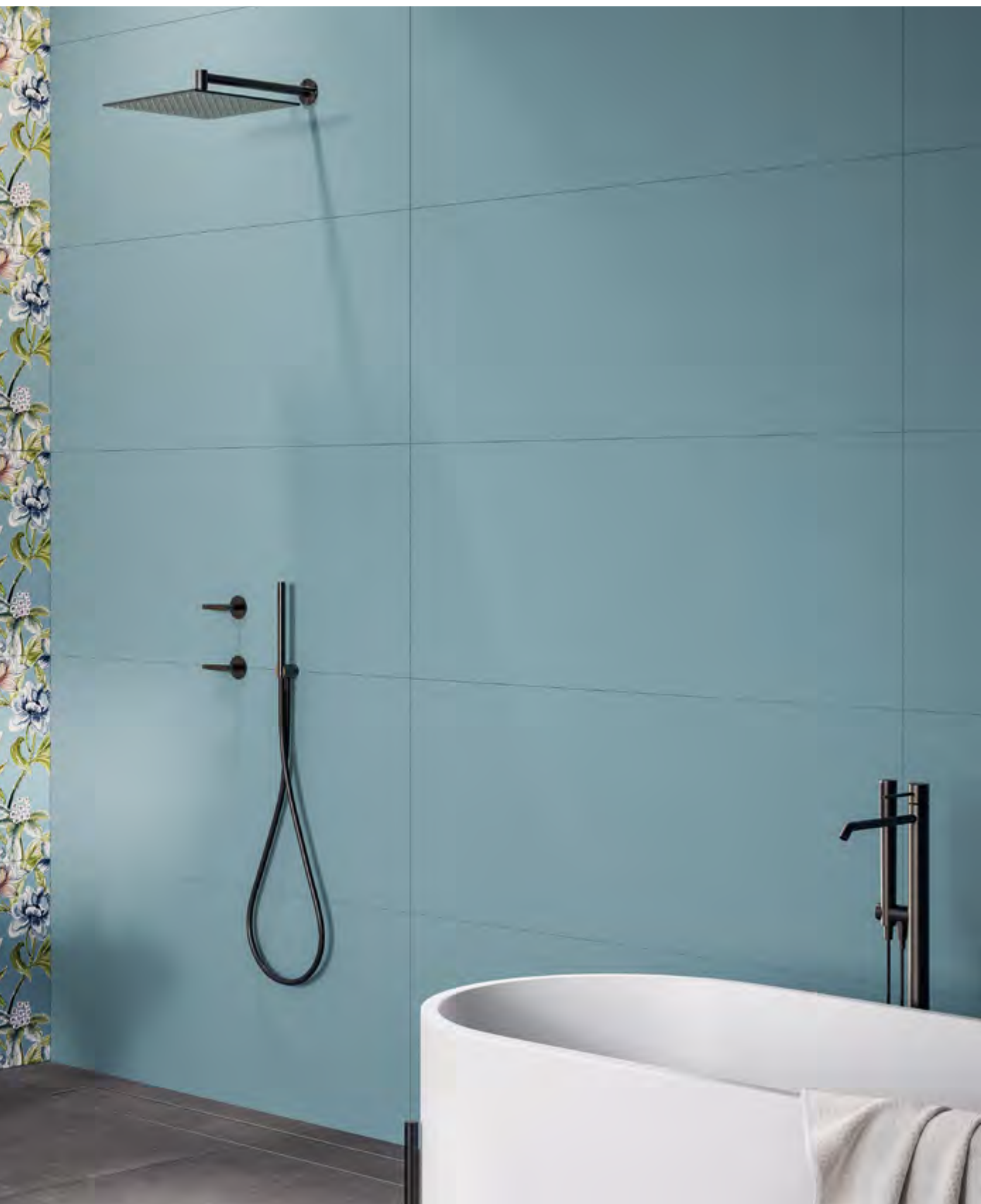
Bloom Genus Avio 50x100 / 19,6"x39,2" - Trama Avio 50x100 / 19,6"x39,2" - Terrae Piombo R11 90x90 / 35,4"x35,4"