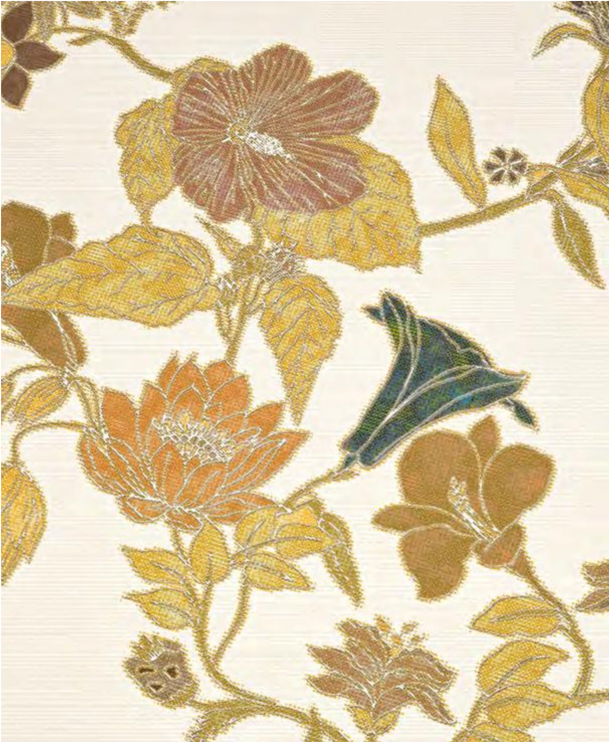
Bloom Seta Avorio A+B 50x100 / 19,6"x39,2" - Luni Noce Naturale 25x150 / 10"x60"