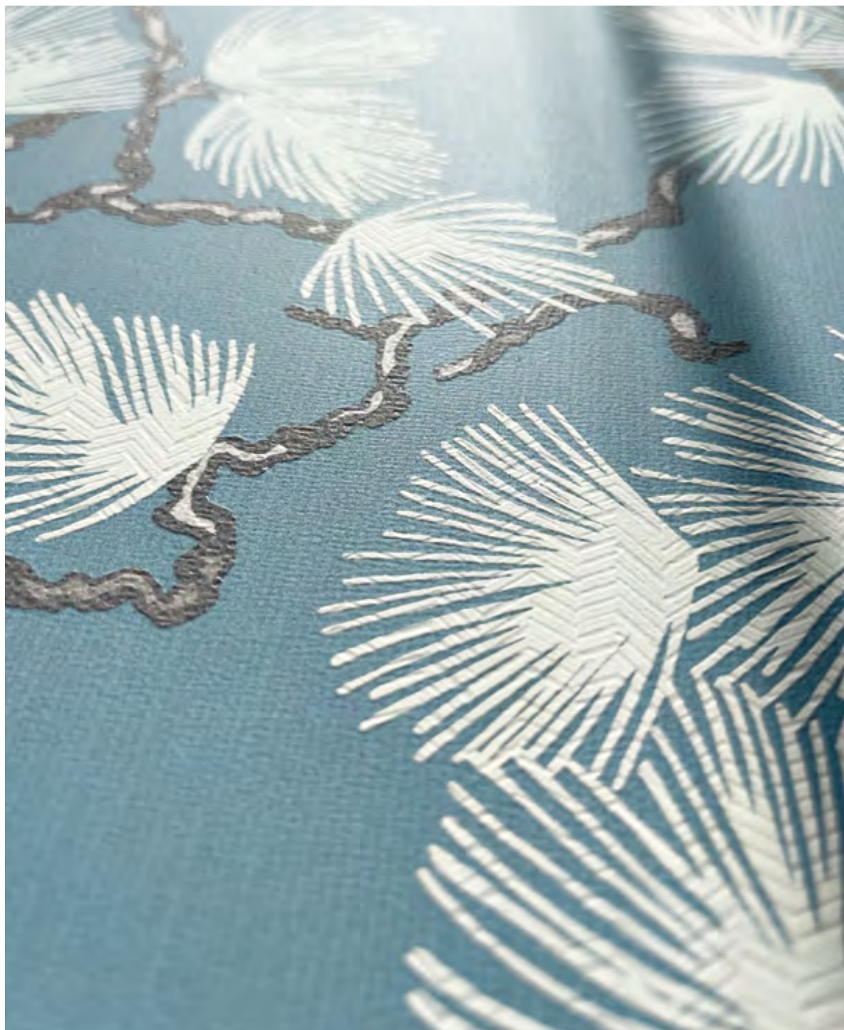
Bloom Loto Avio 50x100 / 19,6"x39,2" - Nova Satin 120x120 / 47,2"x47,2" - Grandiosa Nova Lusso 120x280 / 47,2"x110,2"