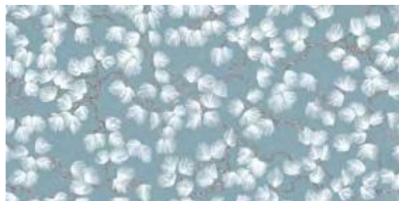
LOTO 50x100 - 19,6"x39,2" 6001314 AVIO