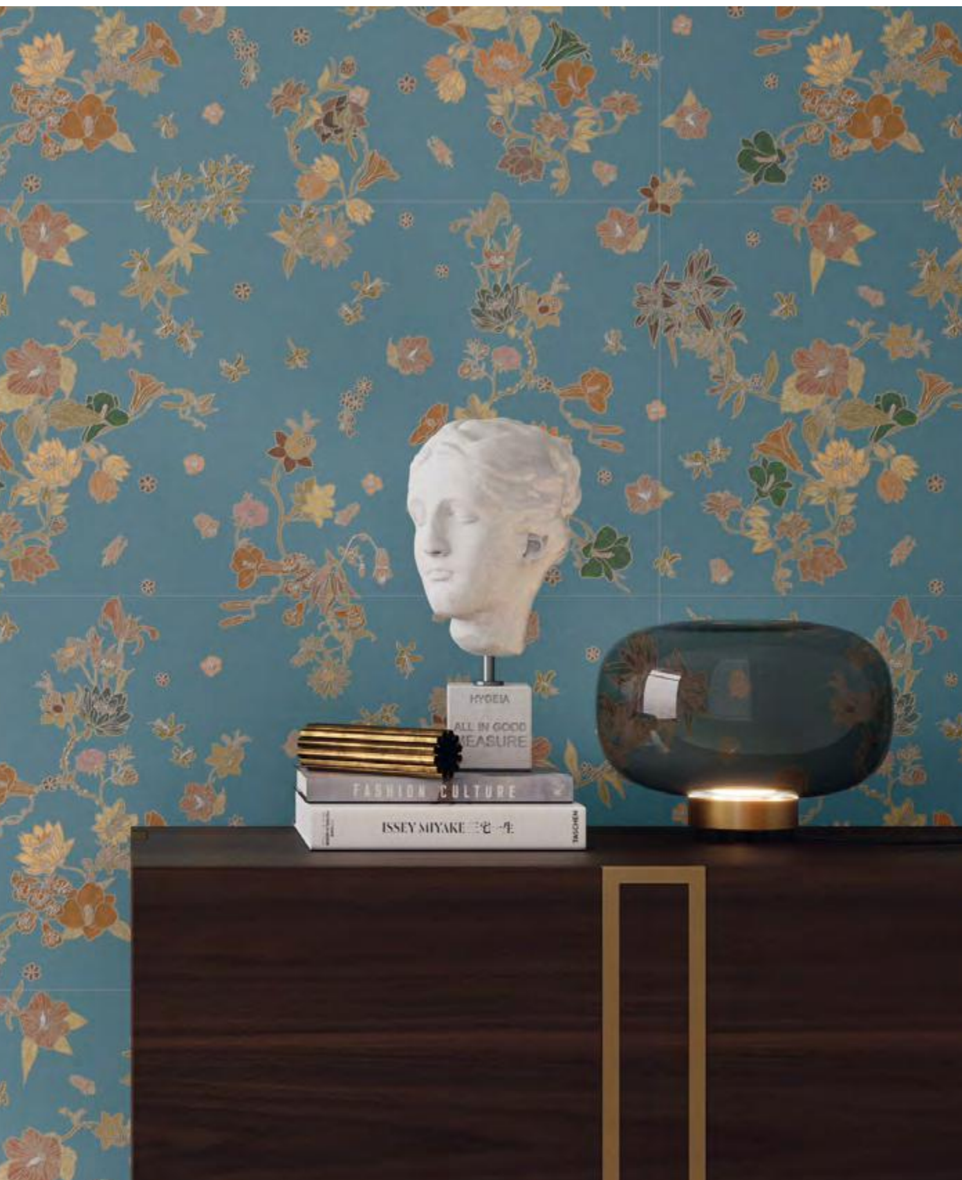
Bloom Seta Avio A+B 50x100 / 19,6"x39,2" - Tabula Bianco Chevron Naturale 15x90 / 5,9"x35,4"