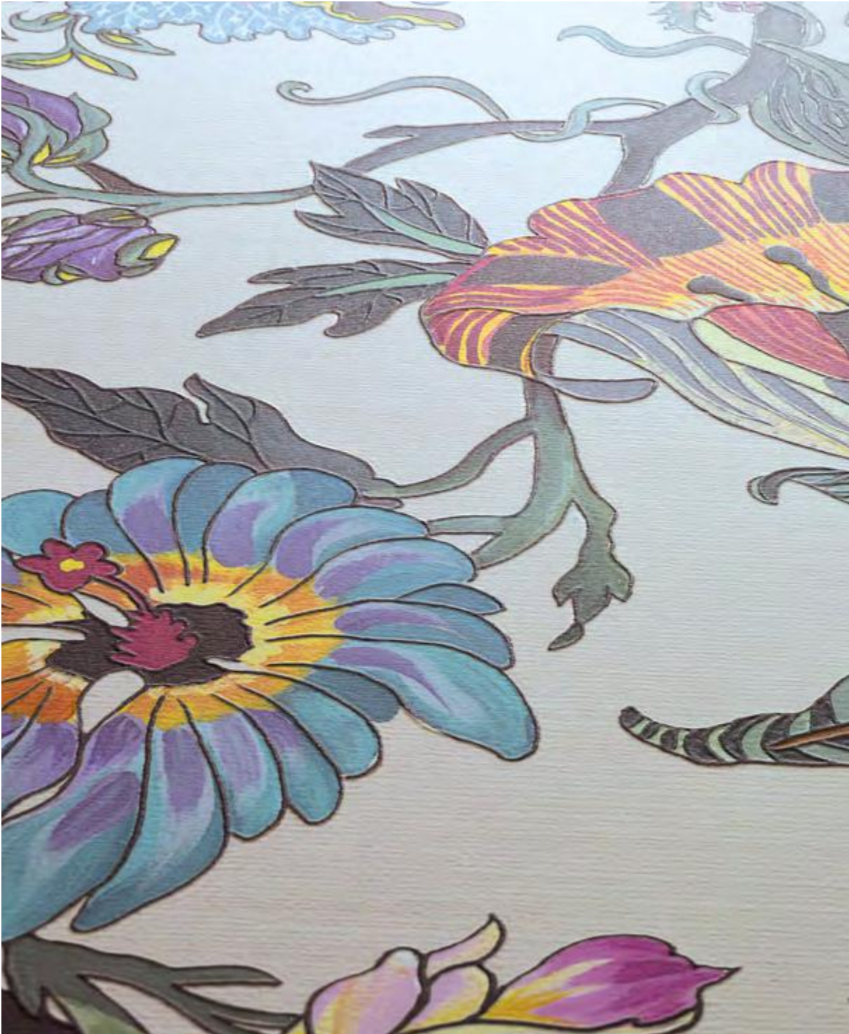
Bloom Venere Avorio A+B 50x100 / 19,6"x39,2" - Terrae Basalto Naturale 60x120 / 23,6"x47,2"