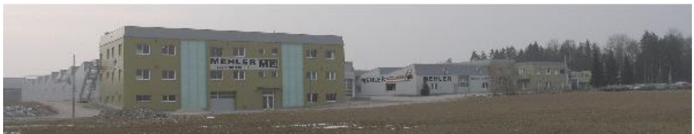
Mehler Elektrotechnik Ges.m.b.H in Wolforn erweitert seinen Betrieb um 8.500m 2 . Dadurch werden 50 zusätzliche Arbeitsplätze geschaffen.

Herstellung von sämtlichen Stark- und Schwachstromschaltschränken und Sonderkonstruktionen!