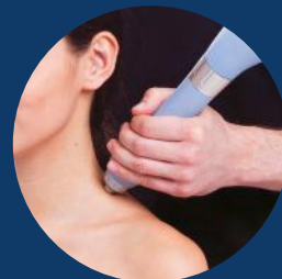
Relâchement des points gâchettes