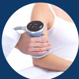
Tendinite et bursite