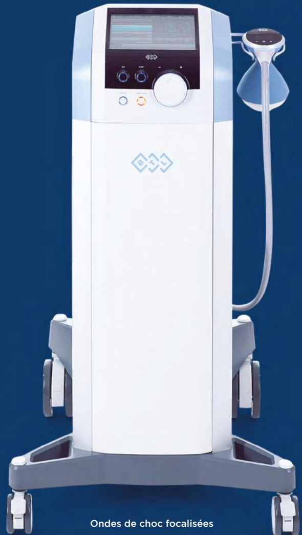
Ondes de choc focalisées BTL-6000 avec chariot

Appareil à ondes de choc focalisées BTL-6000