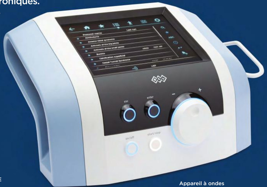
BTL-RSWT-ELITE Appareil à ondes de choc BTL-6000 ÉLITE