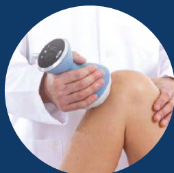
Fracture non consolidée