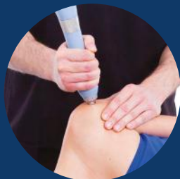
Tendinite, bursite et calcification