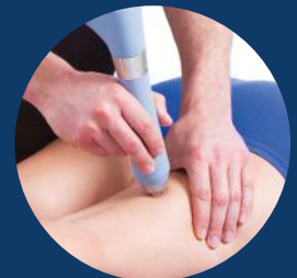
Entorse des ischio-jambiers