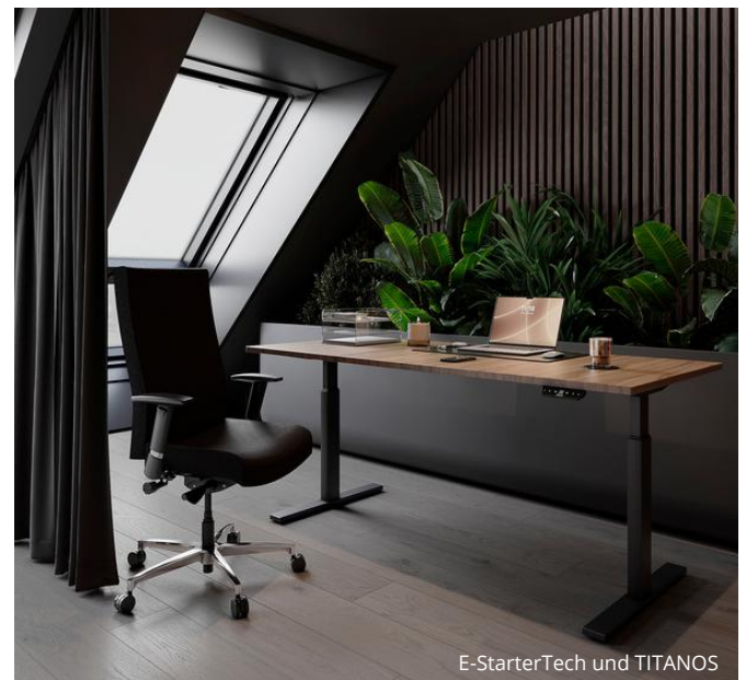
E-StarterTech und TITANOS