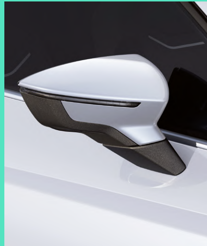
GLACIAL WHITE metallic Fr. 800.-