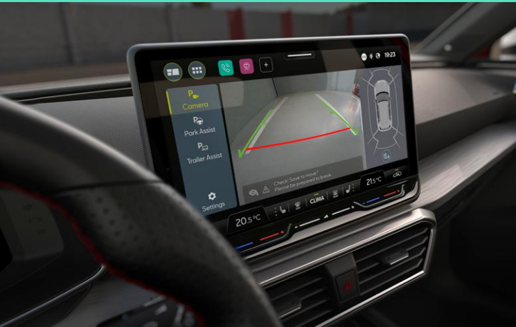
Einparkhilfe vorne und hinten mit Rückfahrkamera