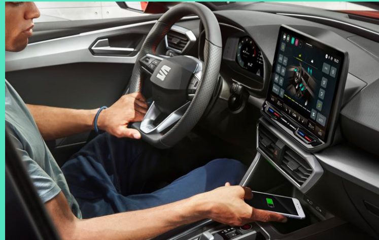
SEAT Media System inkl. FullLink