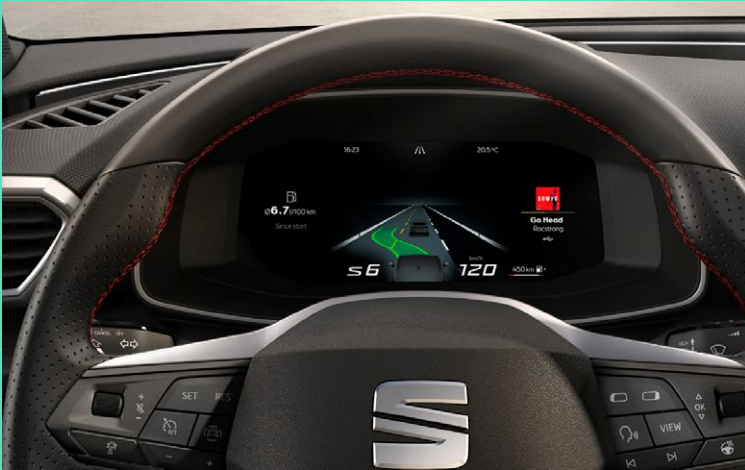
Automatische Distanzregelung ACC