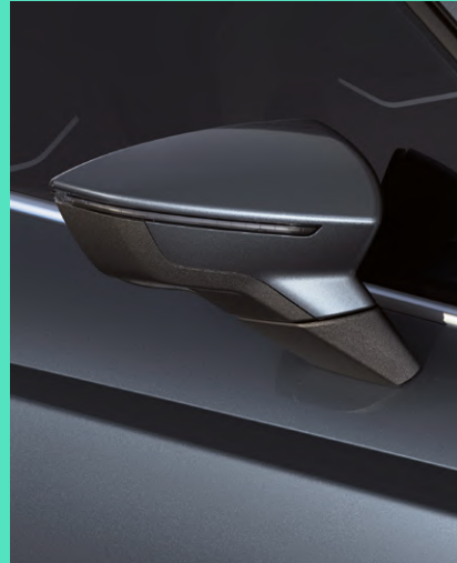
MAGNETIC GREY metallic Fr. 800.-