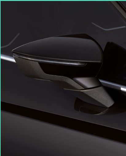
MIDNIGHT BLACK metallic Fr. 800.-