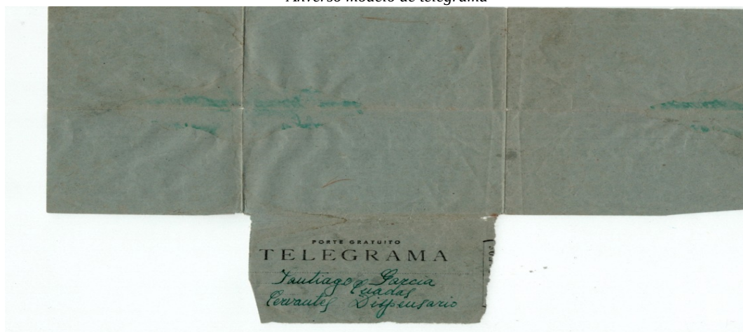
Anverso modelo de telegrama