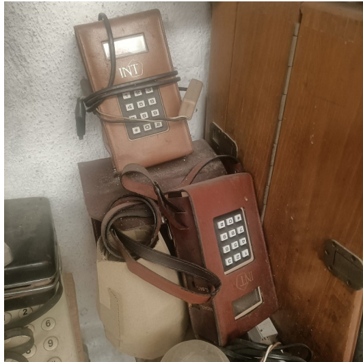
Cedida por Nieves Aranda Cruz