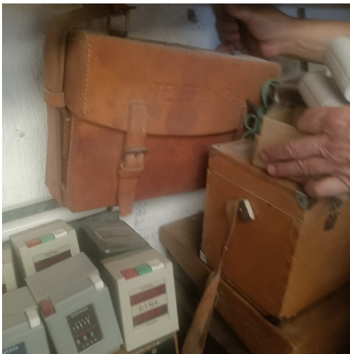
Cedida por Nieves Aranda Cruz