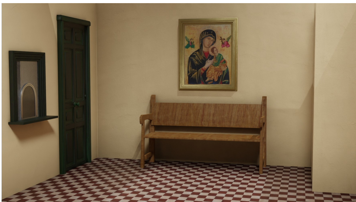
Recreación de la sala de espera hecha por Noé Torres