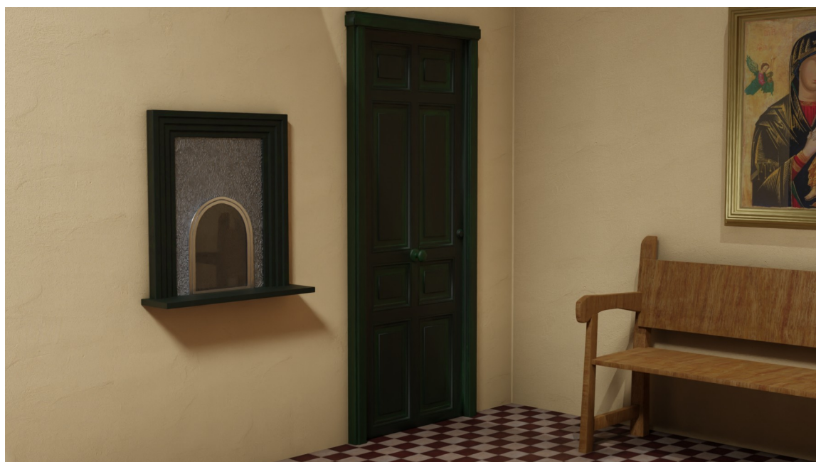
Sala de espera

Las llamadas entre los propios abonados del pueblo no se cobraban, pero sí las conferencias fuera del pueblo. La llamada mínima a cobrar era de tres minutos en el primer tramo y después por cada minuto, y se facturaba cada dos meses. En los primeros años éramos nosotros quien llevábamos en mano los recibos para cobrarlos y lo