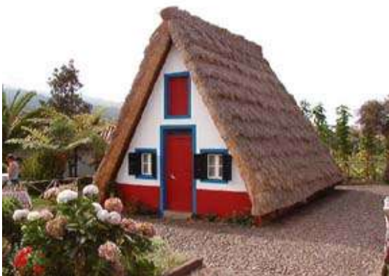
Habitation du Nord de l'île (Santana).

autant de coins pittoresques, Porto Moniz un port bien protégé par une langue de terre aplatie où je me souviens avoir dégusté l'espada (poisson-épée) en bonne compagnie. Et Santana, un des villages les plus agréables où subsistent de coquettes chaumières en bois aux toits pointus entourées de jardins clos. D'autres possibilités s'offrent aux touristes : les randonnées en montagne dans des endroits fabuleux ou les balades en bateau au milieu des dauphins. Tout à Madère, en plus du célèbre vin possède des goûts et des appellations parfumées. Il faut profiter des spécialités de l'île : l'espada, un poisson pêché à Madère, les brochettes de viande, les sardines grillées, le gaspacho : une soupe aux tomates, oignons, concombres, pimentée, servie glacée avec croûtons de pain grillé et l'alcool à base de canne à sucre. Une excursion : l'île de Porto Santo, moins étendue et moins peuplée où l'on accède en bateau en deux heures et demi de traversée. Cette île dite dorée offre une plage de sable fin entourée d'une mer douce et transparente. C'est le paradis du bien-être où le soleil y brille une bonne partie de l'année.