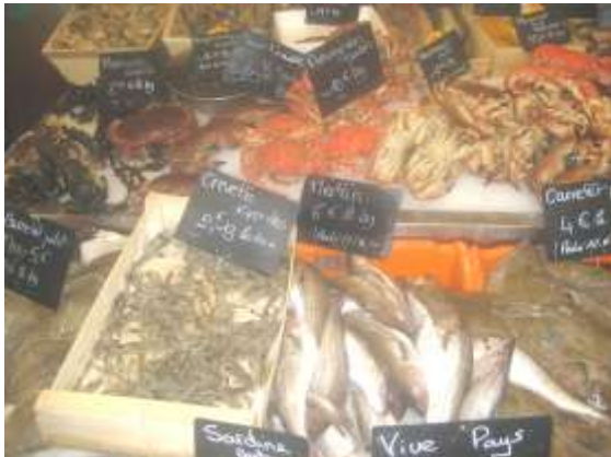
Les splendides étals de la poissonnerie municipale.