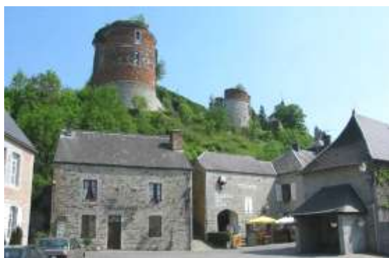
La Causerie des Lilas, sous le château.

Vous êtes-vous parfois demandé où aller durant vos belles journées de septembre ? Dans la région de Givet, le petit village adorable de Hierges, un des plus beaux de France, fait la frontière avec le côté belge, Vaucelles dans la vallée. C'est une cité médiévale sise dans le département des Ardennes, une petite cité de 210 habitants dont le château avec ses vieilles maisons à ses pieds a rendu la région très attractive d'un point de vue touristique. Ses ruines perchées sur une colline ont été causées par un incendie en 1792. Cette merveille de l'architecture Renaissance mosane en briques rouges et pierre bleue, l'un des châteaux les plus romantiques de la région a conservé le charme qui attise la curiosité de nombreux visiteurs. Des petites demeures, construites avec la pierre bleue, extraite des carrières avoisinantes, sont groupées autour de la fontaine embellissant la place où se trouve une jolie maison présentant au-dessus de la porte d'entrée deux flèches dirigées vers le sol symbolisant la justice venant du ciel.