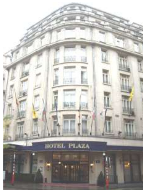
Exterieur van het beroemde hotel Le Plaza aan de Adolphe Maxlaan.