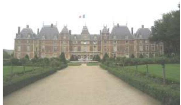
Le château royal

Sur la Côte d'Albâtre, à 25 km à peine de la Baie de Somme, trois cités voisines, Eu, Mers-les-Bains et Le Tréport, aux personnalités fort différentes, ont un destin touristique commun. Eu, tout près de la mer, possède un patrimoine historique exceptionnel. Mers-les-Bains, dans la Somme, est fière de son front de mer et de ses villas Belle Epoque. Le Tréport est une station balnéaire vivant au rythme de son port de pêche. On les appelle les trois Villes sœurs.