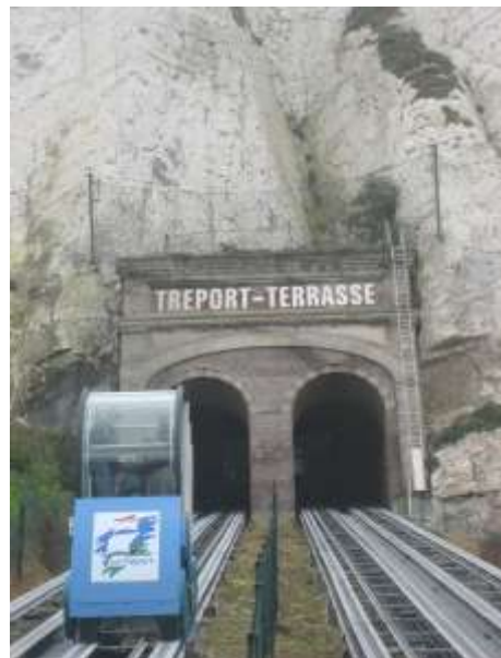
Le funiculaire escalade la falaise du Tréport

Port de pêche, de commerce et de plaisance, cette station balnéaire est axée sur la mer. Sa vocation touristique date de 1960, sa clientèle provenant principalement de la région parisienne. Pour se mettre dans l'ambiance, il faut commencer la visite par la poissonnerie municipale , sur le port. Poissons et fruits de mer, superbement présentés, sont un régal pour les yeux ... avant de les déguster dans un des nombreux restaurants rangés sur les quais.