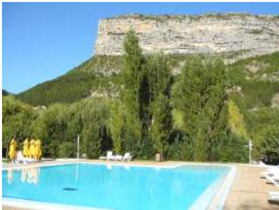
Le Club Ternelia à Remuzat.