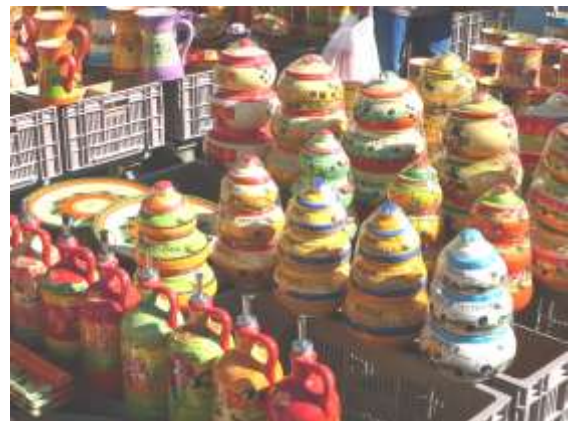
Le marché à Nyons.

faufille dans une véritable gorge creusée par l'Eygues. Par endroits, la roche nous surplombe, et je n'apprécierais pas trop d'y passer lors d'un violent orage (un poteau indicateur signale des chutes de pierres et les bords de la route sont recouverts de filets d'acier). La montée au village de Saint May est inoubliable : quel spectacle grandiose ! La route, étroite, continue ensuite vers le rocher du Caire, où nichent de nombreux vautours fauves, réintroduits en 1987. On assiste depuis au retour spontané d'oiseaux remarquables tel le vautour percnoptère. Le vautour fauve est l'un des plus grands rapaces européens. Il est muni d'une collerette et ne mange que des charognes. Il nettoie donc la nature. Il vit jusqu'à 50 ans, toujours avec le même partenaire : quelle fidélité ! Le poussin prend son envol à l'âge de 4 mois, mais peut hélas être dévoré par les corbeaux. Le vautour moine a une tonsure au dessus de la tête, d'où son nom. Le vautour percnoptère, plus petit, vit 30 ans. Son plumage bicolore noir et blanc, et son faciès jaune, le caractérisent. Il passe l'hiver en Afrique du Nord. Ces rapaces permettent d'éviter la propagation d'épidémies. Leur système digestif détruit toutes les bactéries.