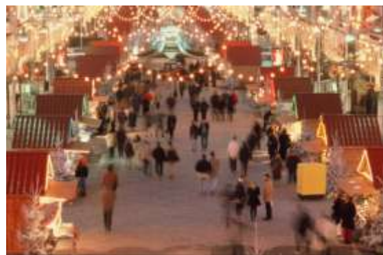
Marché de Noël à Reims.

La Champagne se parera de mille feux à l'occasion de Noël. Reims, Châlons-en-Champagne, Epernay et 40 autres localités proposeront des marchés, balades, concerts, animations, dégustations et expositions, sans compter la mise en valeur de leur patrimoine œnologique et gastronomique. Une découverte pour un agréable week-end. Consultez les forfaits élaborés par le C.D.T. sur www.tourisme-en-champagne.com .