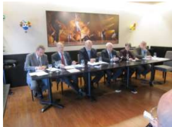
L'Assemblée générale à Soignies

L'année nouvelle promet donc d'être passionnante, et nous pouvons paraphraser l'amiral Nelson: « UBJET expects every man to do his duty ». Nous attendons de chacun de vous un appui et des propositions concernant notre Jubilé de 60 ans .