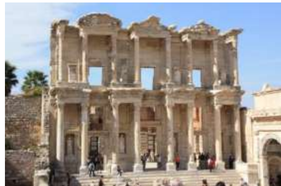
Le site d'Ephèse

La ville est à cheval sur deux continents. Au cœur de la cité, le détroit du Bosphore relie la mer de Marmara et la Corne d'Or. Bâtie sur sept collines, la ville se compose d'un enchevêtrement inextricable de ruelles qui rejoignent par moments des boulevards majestueux.