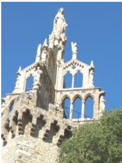
La tour Randonne à Nyons.

Notre premier jour de découverte nous enchante. Nyons, capitale de l'olive, est surnommé « le petit Nice » car le nombre d'heures de soleil est équivalent à celui de la cité méditerranéenne, soit 2752 h/an. Un vent local appelé le Pontias a la particularité de ne souffler qu'entre 23h et 11h. Il apporte un air d'excellente qualité. Sa sécheresse bien connue s'oppose à la prolifération des microbes. Un centre de pneumologie y est implanté. Un « sentier Barjavel », dédié à l'écrivain né à Nyons en 1911, propose de partager avec l'auteur l'amour de cette ville. Il a dit « la seule différence entre Nyons et le paradis, c'est qu'à Nyons on est bien vivant ».