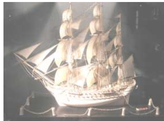
Une belle pièce de la collection du château de Dieppe : un superbe voilier en ivoire.