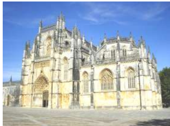
Détail du monastère.

réussir toutefois à le terminer : les « chapelles inachevées » sont toujours à ciel ouvert. La façade est bâtie dans un calcaire doré par le soleil. Le portail central est orné d'une centaine de personnages, anges, rois, prophètes et saints. La nef, longue de 80 m est aussi large que haute (32 m.) ; elle est d'une admirable sobriété. Le cloître présente des arcades ajourées, parfait mélange du gothique et de manuélin.