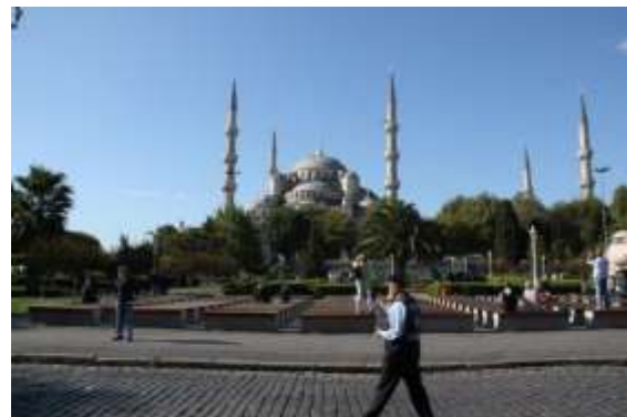
De Blauwe moskee

een luxe, want op een normale dag, komen hier wel honderdduizenden toeristen deze site bezichtigen. Gedurende 400 jaar was dit niet alleen het paleis van sultans en hun harem, maar was het ook het regeringscentrum en woonplaats voor veertigduizend mensen. Nu is het een museum-complex en kan men hier de schatkamers bewonderen met o.a. de bekende dolk Topkapi, waar ook de gelijknamige film werd op geïnspireerd. Zeker ook de moeite waard om te bezoeken is het paviljoen van de relieken van: de profeet Mohammed, maar ook de staf van Mozes, het zwaard van David en de arm van Johannes de Doper zijn hier bewaard! Van hieruit heeft men een prachtig zicht op de “Gouden Hoorn” en de “Zee van Marmara”. Naast het paleis ligt de beroemde Hagia Sofia uit het jaar 537, met zijn schitterende koepel. Oorspronkelijk en gedurende 500 jaar, ten tijde van het christelijke Constantinopel, was het een kathedraal. Sultan Mehmet II maakte er een moskee van. Het was Atatürk die er later een museum van maakte.