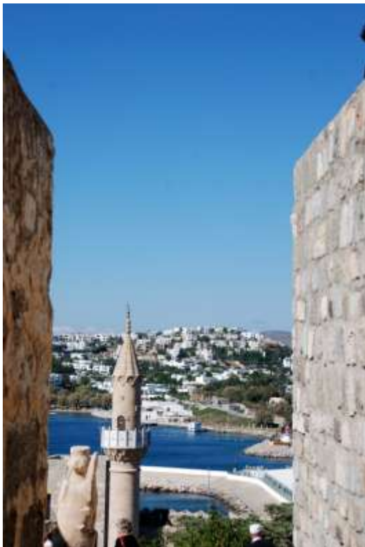
Le port de Bodrum

l'église de la Sainte-Sagesse et c'est par déformation du mot Ayasophia qu'elle devint tout simplement Sainte- Sophie. Le 29 mai 1453, date de la prise de Constantinople, le sultan Mehmet II transforme la basilique en mosquée. Enfin, en 1923, Ataturk, après avoir fait de la Turquie une république, la transforma en musée. Avec ses six minarets, la Mosquée Bleue est probablement, la plus élégante d'Istanbul. Contemporaine de la basilique Saint-Pierre de Rome, elle fut commandée par le sultan Ahmet Khan II et achevée en 1616. Elle est tapissée par plus de 21.000 carreaux de faïence. Construit sur l'acropole, le point le mieux défendu de la ville, Topkapi, le palais des Sultans, couvre 700.000 m 2 , comportant un musée archéologique, une salle du trésor, le harem et les cuisines où l'on peut admirer de nos jours une fantastique collection de porcelaines de Chine.