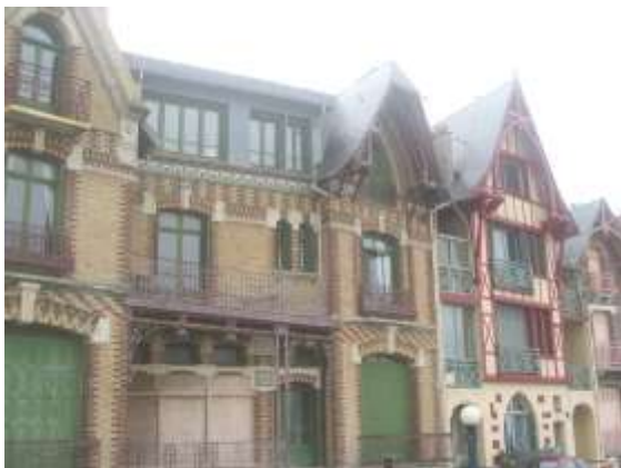
Quelques maisons Belle Epoque typiques.

mais la chapelle contient son superbe sarcophage en marbre, face à son épouse. Hors du centre, le musée des Traditions verrières vaut le détour. Créé par d'anciens professionnels du verre, il présente l'histoire de cette industrie, particulièrement vivace dans la vallée de la Bresle, notamment le flaconnage pour la parfumerie, une spécialité locale. Le musée de la Figurine est une nouvelle attraction touristique. Ouvert depuis mai 2010 dans une dépendance du château-hôtel Domaine de Joinville *** par Monsieur Jacques Roussel, il présente quelque 17.000 figurines, anciennes et contemporaines, rangées dans soixante vitrines thématiques s'étalant sur sept salles. On peut suivre ainsi l'histoire de France et du monde en admirant les créations des plus grands fabricants, tels CBG Mignot, Lucotte, Bittard, Alexandre et de bien d'autres de tous pays, mais aussi des figurines de bandes dessinées modernes. J'ai logé au Domaine, mais dans le centre-ville d'Eu, Le Clos Sainte-Anne propose de jolies chambres d'hôte. Merci à Mme Chantal Atamian, directrice de l'Office de tourisme d'Eu.