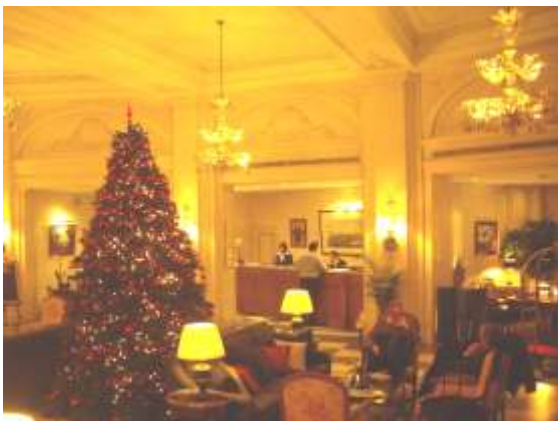
De prachtige hall van het palacehotel.

Maar voor mij was het een goede gelegenheid om enkele nieuwigheden te bezoeken. In Brussel is er altijd wat nieuws onder de zon of regen ... Onze hoofdstad staat zeker niet stil, en ik vind dat er veel vooruitgang is geboekt inzake properheid van de straten, het verkeersvrij maken van o.m. het voorplein bij het Centraal Station, de vernieuwde doorgang van daaruit naar de Grasmarkt via de Hortagalerij (waar wel nog veel te huur staat), het vernieuwde Congrespaleis (daterend uit het expojaar 1958) dat nu Square wordt genoemd, het Anspachcenter met shopping en het nieuwe entertainment center Viage met het nieuwe casino (jammer genoeg van buiten niet zichtbaar, laat staan bewegwijzerd) en musical dinner show... verder ontelbaar veel nieuwe chocoladewinkels in de buurt van de Grote Markt en de Grasmarkt (met o.m. de Chocopolis als grootste). In de bovenstad ben ik onder de indruk van het succes van de totaal vernieuwde Gulden Vliesgalerij, met o.m. de FNAC als blikvanger. Het toerisme- en informatiebureau van Brussel (TIB) is sinds enkele jaren gehuisvest vlakbij het Koningsplein - tegenover het (koninklijk) museum Belle Vue - in een prachtig neo-klassiek gebouw. Op de eerste verdieping bevindt zich Experience Brussels ( www.biponline.be ): jaarlijks ga ik er nu met mijn buitenlandse Erasmusstudenten naar toe omdat men er een zeer interessante inleiding geeft van de Europese hoofdstad.