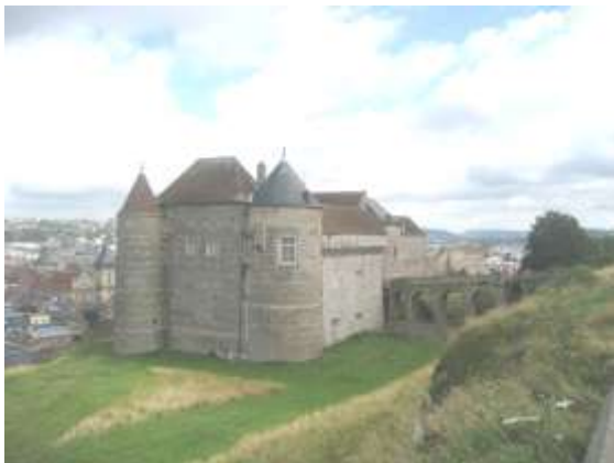
Le château de Dieppe domine la ville.

Pour découvrir la Côte d'Albâtre, Dieppe est une étape obligée. Rien que le passionnant château-musée vaut, à lieu seul, le détour. La forteresse fut édifée entre les 15 e et 18 e siècles sur les fondations d'un château plus ancien. Son gouverneur, Jehan Ango veilla à son développement. Ses collections très importantes nécessitent une visite approfondie. Outre les salles consacrées à l'archéologie, l'art populaire, les peintures de marine, les meubles et objets d'art et les faïences, on ne manquera la remarquable collection d'ivoires dieppois , plus de 1500 pièces d'une finesse extraordinaire, allant du 16 e au 19 e siècles. Il faut voir aussi le port, les ruelles sous le château et découvrir ses bonnes tables.