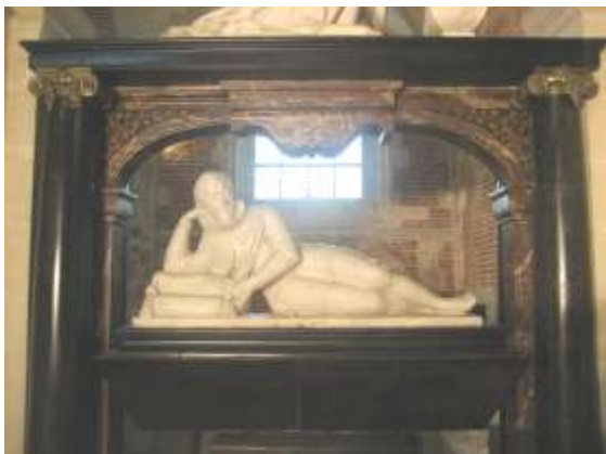
Le gisant d'Henri de Guise dans la chapelle du Collège des Jésuites

roi d'Angleterre. C'est dans cette ville que ce dernier épousa, en 1050, malgré l'opposition du Pape, Mathilde, fille de Baudouin V, comte de Flandre et petite-fille du roi de France Robert II. Un autre événement marquant pour Eu fut le décès, à l'abbaye de la ville, de saint Laurent O'Toole, archevêque de Dublin, légat du Pape, venu en 1180 rencontrer le roi d'Angleterre à Rouen et qui fut par la suite canonisé en 1225. La collégiale Notre-Dame et Saint-Laurent , de style gothique flamboyant, accueille dans une crypte superbe son gisant (fin 12 e siècle), un des plus anciens de France, ainsi que plusieurs autres gisants des comtes d'Eu et d'Artois des 14 e et 15 e siècles. Les vastes dimensions de l'église s'expliquent par l'important pèlerinage rendu au saint. Ses grandes orgues, récemment restaurées, sont très belles. Le château d'Eu fut construit en 1578 par la comtesse d'Eu, Catherine de Clèves, et son mari, Henri de Lorraine, duc de Guise. Après plusieurs occupants et aménagements, dont ceux ordonnés par la Grande Mademoiselle, cousine de Louis XIV, il devint propriété des princes d'Orléans puis en 1821 la résidence d'été du roi Louis-Philippe. Il échût ensuite au comte d'Eu, époux de la fille de l'empereur du Brésil, Don Pedro II pour finalement devenir propriété de la Ville.