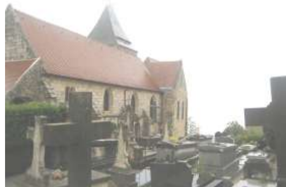
L'église Saint-Valéry et son cimetière marin.

d'Ango . Jehan d'Ango (1480-1551) était un armateur dieppois. Explorateur des mers, banquier, il bâtit une immense fortune qui lui permit de devenir le plus grand armateur de France, à la tête d'une grande flotille avec laquelle il concurrença les autres nations maritimes. Gouverneur de Dieppe, il en fera la troisième ville du pays. Il contribua à payer la rançon de François 1 er . Comblé d'honneurs, ami des arts, mécène en relation avec l'Italie, il fit construire à Varengeville un palais d'inspiration italienne, un palais d'été, avec une tour-pigeonnier, une galerie et des loggias. Las, le roi se lança dans une guerre maritime avec l'Angleterre. Ango y perdit sa flotte et finit ruiné. Du superbe palais, il reste toutefois de beaux bâtiments.