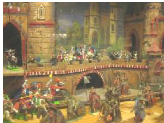
Le Moyen Age illustré par la figurine