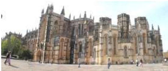
Le monastère de Batalha.

La veille de la bataille d'Aljubarrota, le roi João I avait fait le vœu d'édifier à la Vierge, s'il venait à vaincre, la plus somptueuse des églises, ainsi qu'un couvent monumental. Le site choisi se trouve à 15 km au N. du champ de bataille. Le monastère porte le nom de « Santa Maria da Vitória », plus communément appelé : Batalha (La Bataille). Les travaux furent d'abord dirigés par le portugais Afonso Domingues, et ensuite, à la demande de la reine Filipa, par l'architecte irlandais Huguet, qui avait construit et rénové les palais royaux d'Angleterre. Le roi offrit le nouveau monastère aux Dominicains. C'est un parfait mélange des styles gothiques portugais et anglais. Au détour de la route Porto-Lisbonne, une immense nef hérissée de pinacles, constitue le plus parfait exemple du gothique à son apogée. Le bâtiment est inscrit au Patrimoine mondial de l'Unesco. Toute une dynastie des Avis participa à l'embellissement du monastère, sans