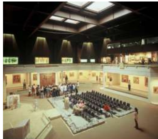
La Fondation Gianadda.

entièrement restauré en 1994, est l'un des plus vieux moulins de type industriel de Suisse. Quatre roues verticales à godets, une minoterie avec trois meules à céréales, une boulangerie avec pétrins à eau. Une visite qui se termine par une dégustation de pain fait dans la boulangerie des lieux. Au bout de la rue du Forum, derrière la patinoire, les ruines d'une vaste demeure, une rue romaine et les thermes publics et plus loin le spectaculaire amphithéâtre où des spectacles sont présentés en été. Et une excursion à 6 km de Martigny, les gorges du Durnand. Il s'agit d'un kilomètre de passerelles accrochées aux falaises surplombant 14 cascades d'un torrent tumultueux.