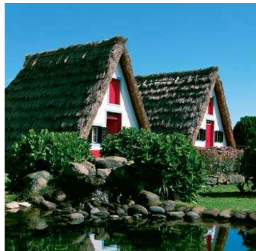
Maisons typiques à Funchal

Les petites bouquetières en costume typique vendent l'orchidée, les camélias, les hortensias dans les rues de la ville. La cathédrale du 15e siècle, sobre, très simple où le crépi blanc contraste avec le basalte noir. L'Hôtel de Ville est surmonté d'une tour et la cour intérieure est décorée d'azulejos. Le jardin botanique présente de remarquables exemplaires de la flore madérienne. De nombreux musées, Art sacré ou décoratif et la vieille ville aux rues étroites occupées par des pêcheurs et des artisans, des tavernes, des bars et des restaurants populaires où j'eus l'occasion d'écouter un fado, chant nostalgique et triste au cours duquel les chanteurs vêtus de noir, les yeux mi-clos accompagnés de joueurs de viole expriment leurs émotions romantiques.