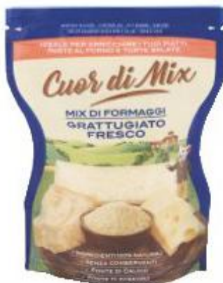
GRAN TERRE MIX DI FORMAGGI GRATTUGIATO FRESCO 70 G