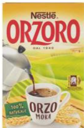
NESTLÉ ORZORO ORZO MOKA MACINATO - 500 G

ALPRO BEVANDA 100% VEGETALE AVENA/MANDORLA 1 LITRO