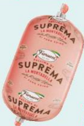
FIORUCCI PALLINA DI MORTADELLA 400 G