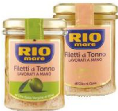
RIO MARE FILETTI DI TONNO VARI TIPI - 180 G