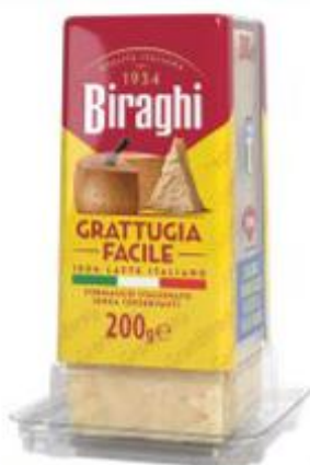
BIRAGHI GRAN BIRAGHI GRATTUGIA FACILE 200 G