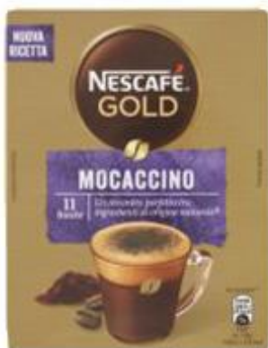
NESTLÉ NESCAFÉ GOLD MOCACCINO - CACAO 11 BUSTE