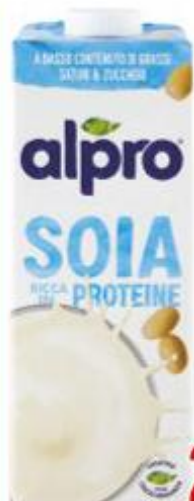
ALPRO SOYA DRINK CALCIO 1 LITRO