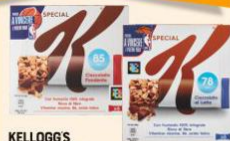
KELLOGG'S SPECIAL K BARRETTE CIOCCOLATO FONDENTE - LATTE/FRUTTI ROSSI 6 PEZZI