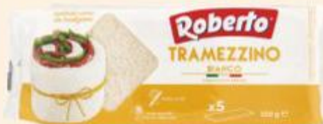
ROBERTO PANE TRAMEZZINO 250 G