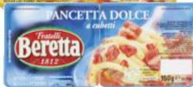
BERETTA PANCETTA A CUBETTI DOLCE/AFFUMICATA 150 G