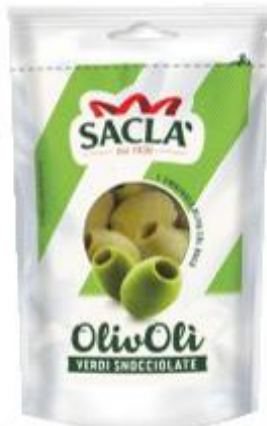
SACLÀ OLIVOLI OLIVE VERDI SNOCCIOLATE 185 G