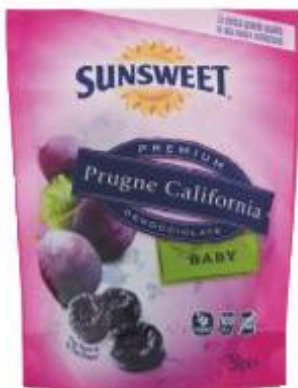
SUNSWEEET PRUGNE BABY DENOCCIOLATE BUSTA - 250 G