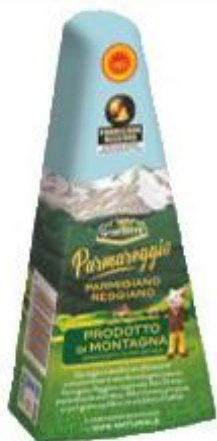
GRAN TERRE PARMAREGGIO 24 MESI - 250 G