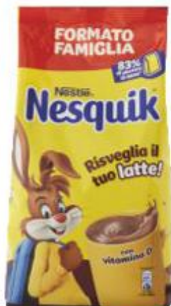
NESTLÉ NESQUIK POUCH 800 G