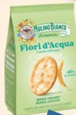
MULINO BIANCO CRACKERS FIOR D'ACQUA 250 G