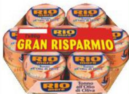
RIO MARE TONNO ALLOLIO DI OLIVA 80 G X 7