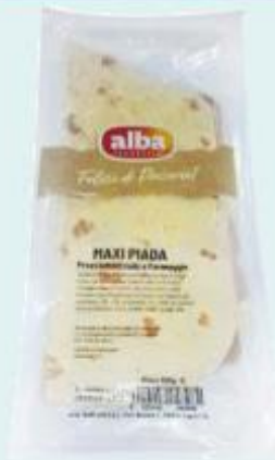
ALBA MAXI PIADA CRUDO E FORMAGGIO 180 G