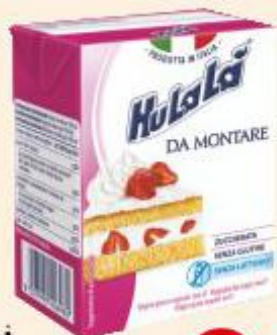
HULALÀ DA MONTARE 200 ML

HERO BARRETTA LIGHT CIOCCOLATO/ NOCCIOLE 20 G X 6