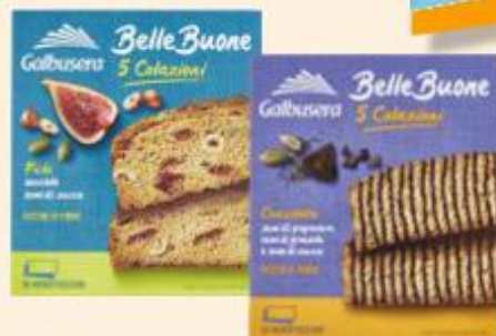
GALBUSERA BELLE BUONE FETTE VARI GUSTI 200 G