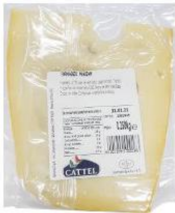
CATTEL MAASDAMMER 250 G