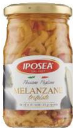
IPOSEA MELANZANE A FILETTI TRIFOLATE ALLA CONTADINA - 280 G