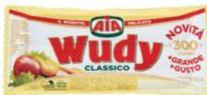
WUDY WURSTEL CLASSICO 300 G