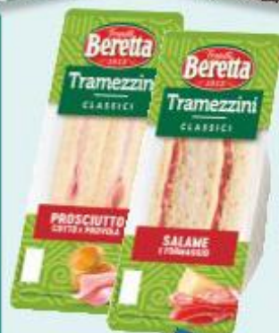
BERETTA TRAMEZZINO VARI GUSTI 140 G