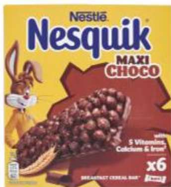
NESTLÉ NESQUIK BARRETTE MAXI CHOCO 150 G