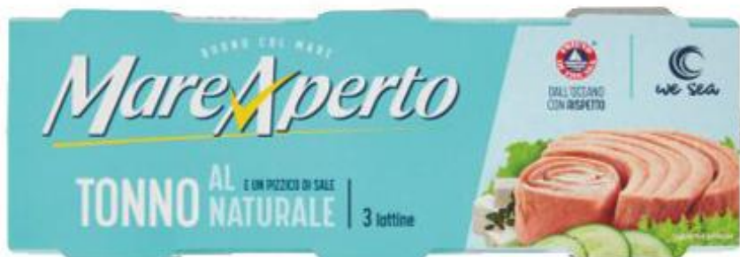
MARE APERTO TONNO AL NATURALE 80 G X 3