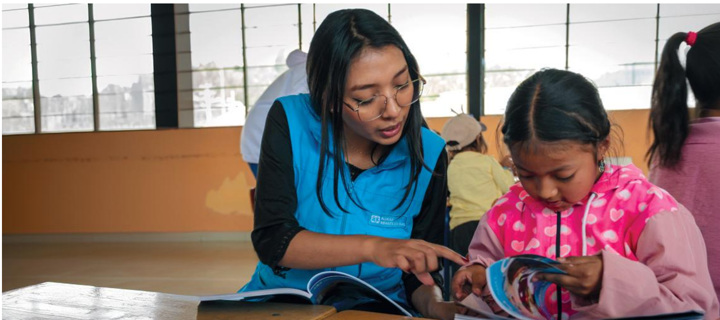
Una docente del proyecto brinda refuerzo escolar a una estudiante de la Unidad Educativa Miguel Egas Cabezas, en la comunidad de Peguche, Otavalo.