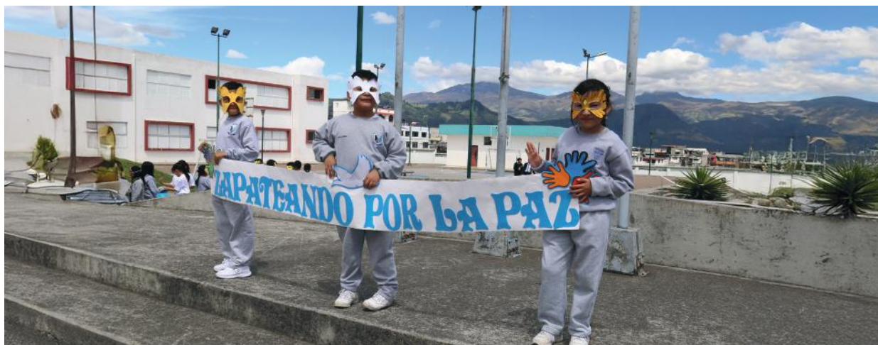
Estudiantes de la Unidad Educativa Réplica Mejía participaron de la Campaña Zapateando por la Paz.

Un llamado urgente por los derechos de la niñez y adolescencia