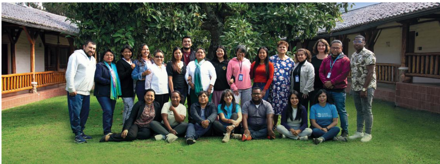
Foto grupal del primer taller de salvaguarda impartido por especialistas de Aldeas Infantiles SOS, junto a representantes de las organizaciones participantes.

Es así como diez (10) organizaciones sociales y comunitarias que atienden niñas, niños y adolescentes en servicios de protección especial, participaron en este proceso que fortaleció la prevención y los protocolos de atención inmediata cuando ocurren casos de negligencia y/o abuso. Incluyó, el acompañamiento integral para la implementación de estos procesos dentro de las organizaciones participantes.