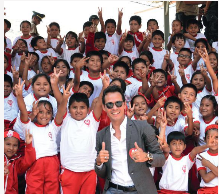
Marc Anthony compartiendo con estudiantes beneficiados de los proyectos de Maestro Cares.

Con esta alianza, el Centro de Desarrollo Familiar y Comunitario de Quitumbe simboliza una nueva esperanza para las familias y comunidades del sur de Quito, marcando un paso decisivo hacia la construcción de un entorno donde niñas, niños, adolescentes y jóvenes puedan crecer, aprender y prosperar. Este espacio es más que un edificio; es un reflejo del poder de la colaboración y el compromiso para transformar realidades, una historia de éxito que demuestra que, trabajando juntos, es posible construir un futuro mejor para todos.