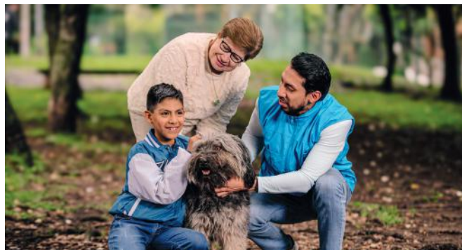
Encuentro entre una Madrina y un niño de las Casas SOS, fortaleciendo vínculos y creando momentos únicos.

La prevención se ha convertido en un pilar fundamental dentro de la labor, a través del acompañamiento a familias en riesgo de perder la custodia de los hijos/as, por negligencia o violencia, con el objetivo de evitar separaciones innecesarias; así como intervenciones en comunidades de Esmeraldas, Manabí, Guayas, Imbabura, Pichincha y Azuay, donde los altos índices de pobreza, violencia e inseguridad exponen a la niñez y adolescencia a situaciones como callejización, adicciones tempranas o cooptación por grupos de delincuencia organizada, buscando así transformaciones sociales sostenibles que aseguren su protección.