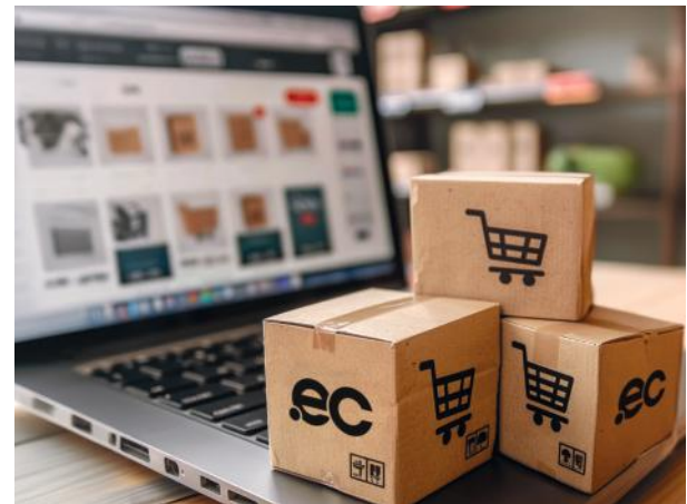
Fotografía de stock.