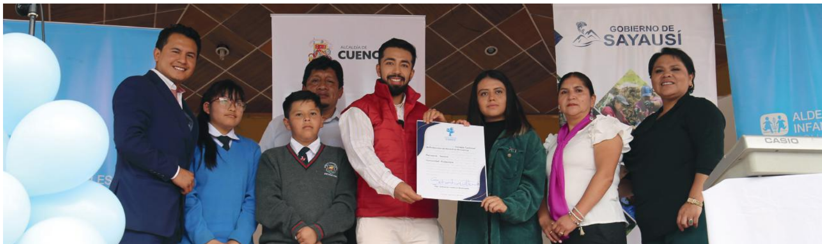
Entrega de la certificación como Comunidad Protectora por parte del Consejo Cantonal de Protección de Derechos a los líderes de la comunidad de Sayausí.