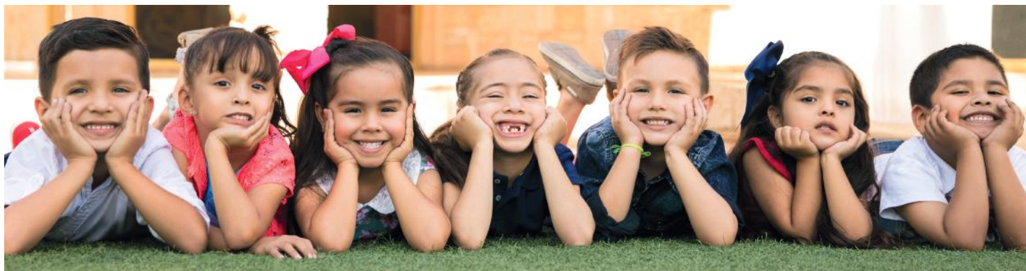
Fotografía de stock.