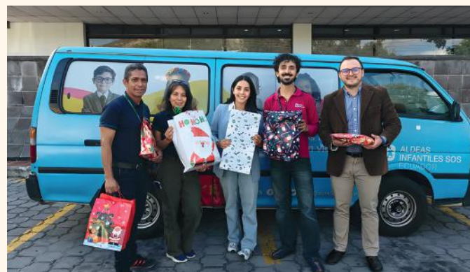
COOPROGRESO entregó regalos para niños de las Casas SOS con apoyo de sus colaboradores.