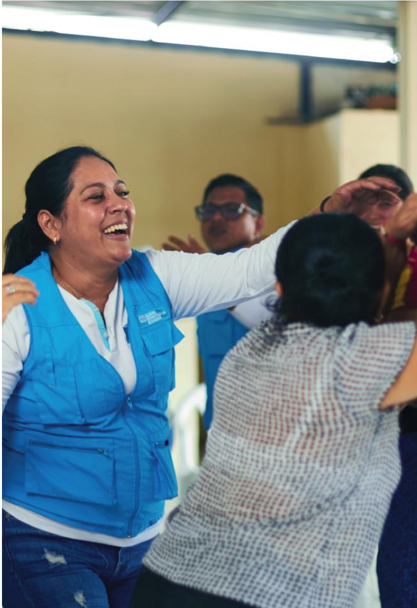
Facilitadora comunitaria lidera dinámicas participativas con la comunidad en Portoviejo, Manabí.