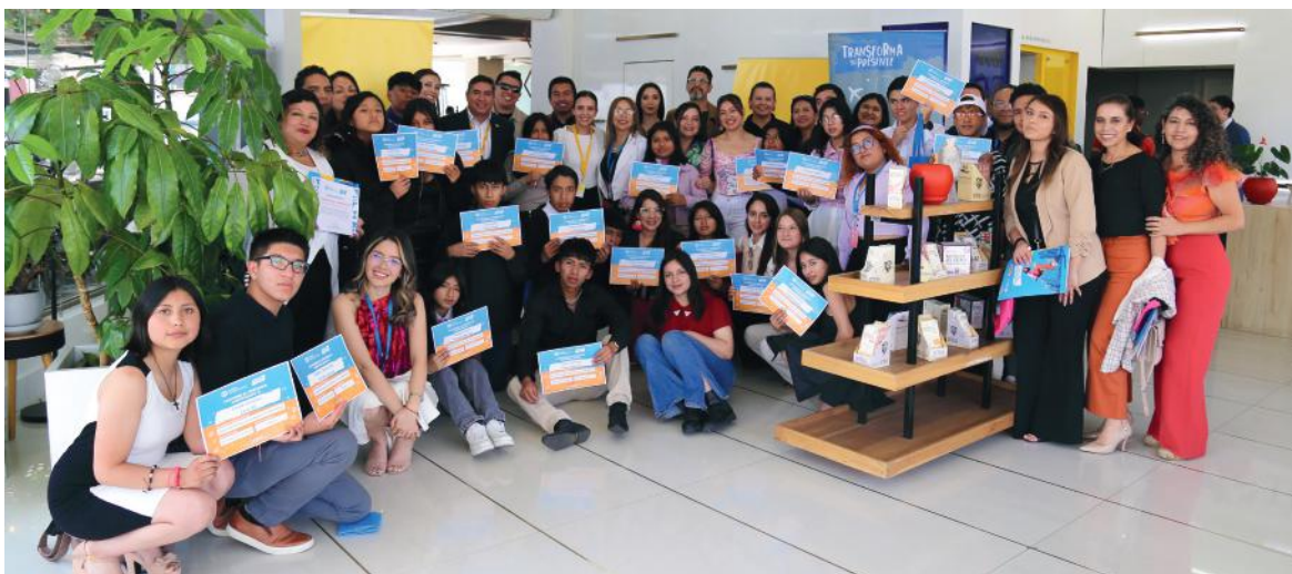
Graduación de 23 jóvenes del programa Azuay del proceso “Transforma su Presente”.

Este proceso se ha cristalizado con el apoyo de dos actores fundamentales: Los y las donantes de Aldeas Infantiles SOS Ecuador, así como la RED DE EMPRESAS ALIADAS SOS, que impulsan los procesos de capacitación y vinculación laboral para los y las jóvenes participantes, como es el caso de AMERINODE y DHL a través de su programa “GO TEACH”.