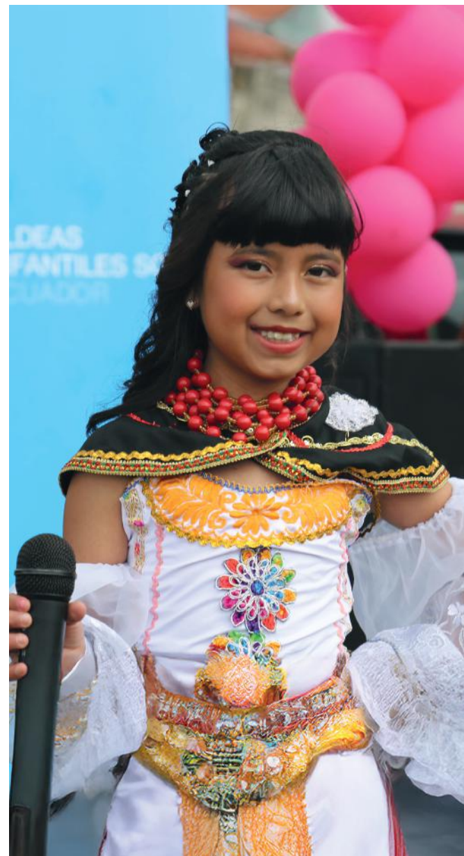
Participante de la comunidad de Quinchuquí durante una presentación artística.

A la fecha se interviene con Equipos Técnicos de Aldeas Infantiles SOS Ecuador en los siguientes sectores: Martha Bucaram en Quito; Alpachaca en Ibarra; Agato en Otavalo; 24 de Mayo en Esmeraldas; La Cayapa en Eloy Alfaro; 9 de Octubre en San Lorenzo; Bastión Popular en Guayaquil; 20 de Julio, El Milagro y La Piñonada en Portoviejo; y Baños en Cuenca. Nuestro objetivo es ampliar nuestra cobertura a más provincias del Ecuador en el año 2025.