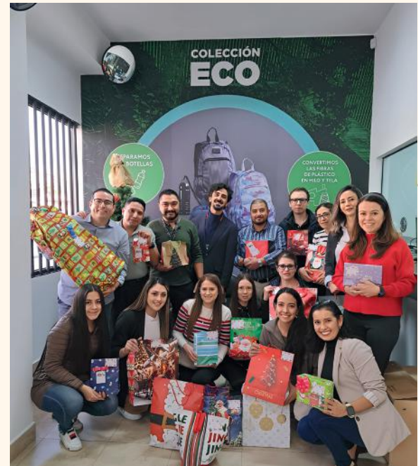
Totto Ecuador entregó alrededor de 30 regalos para los niños de las Casas SOS.