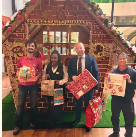
Swissotel Quito donó más de 25 regalos a Aldeas Infantiles SOS Ecuador como parte de alianza.