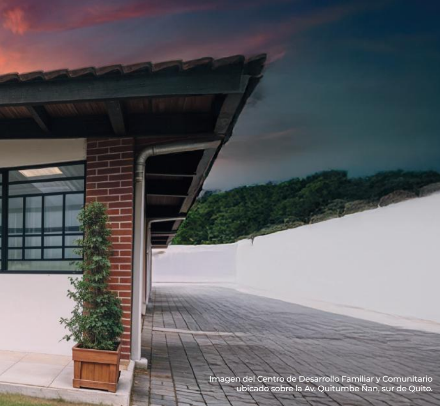
Imagen del Centro de Desarrollo Familiar y Comunitario ubicado sobre la Av. Quitumbe Nan, sur de Quito.