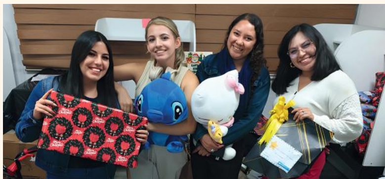
Durante cinco días, voluntarias y colaboradores de Aldeas Infantiles SOS Ecuador prepararon y distribuyeron regalos para niños y jóvenes de sus programas y el servicio de autonomía.