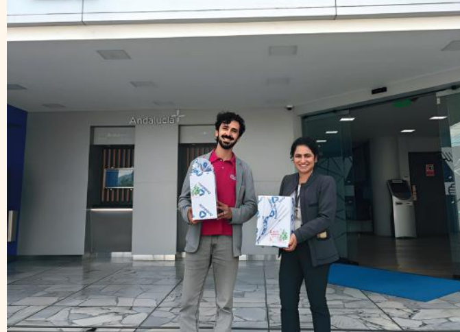
Por primer año, Cooperativa Andalucía se sumó a la donación de regalos y obsequios personalizados.