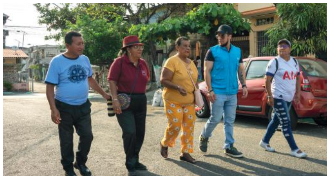
Facilitador comunitario trabajando de la mano con los vecinos de Bastión Popular, Guayaquil.

asumen temporalmente su cuidado, y la Custodia Familiar, donde abuelos, tíos o hermanos cercanos son quienes, mediante una crianza positiva, garantizan un ambiente seguro y protector.