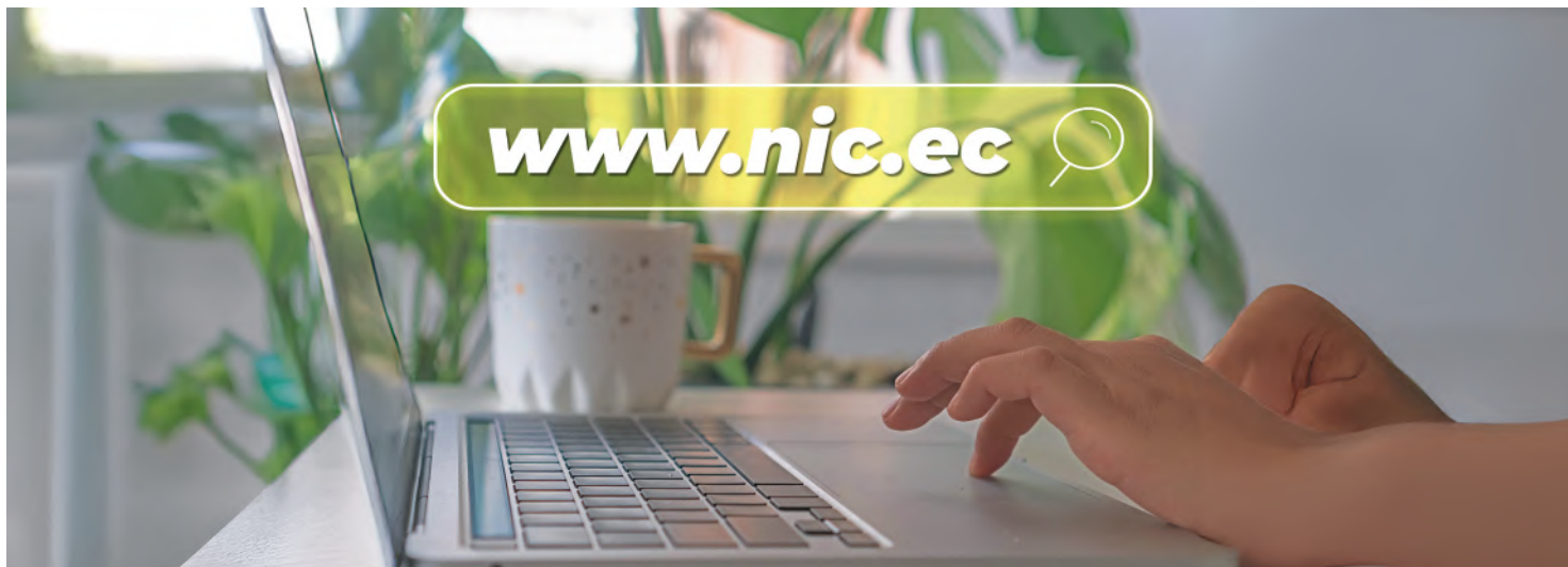
Fotografía de stock.

Así las cosas, a la hora de crear una página web, tienda digital o e-commerce es fundamental elegir el nombre de dominio correcto para que cualquier buscador pueda rastrearlo y asociarlo a las búsquedas que hagan los posibles consumidores o compradores.