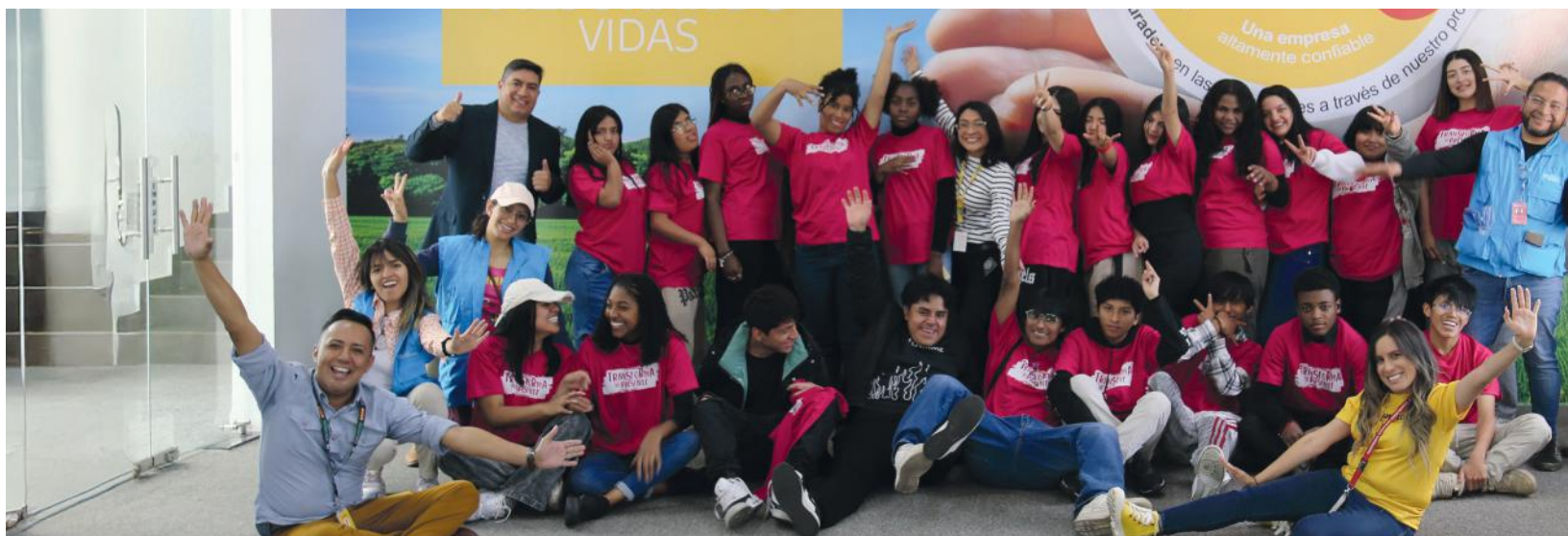
Participantes del proceso de Autonomía Juvenil durante la visita a las instalaciones de DHL Quito.