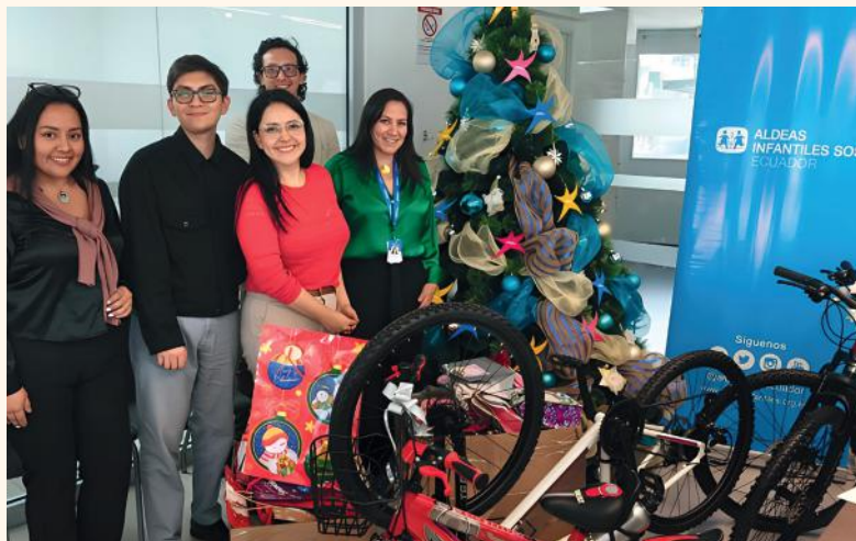
Davita, empresa de cuidados renales, entregó más de 100 regalos a niñas, niños y adolescentes de Aldeas Infantiles SOS en Quito.