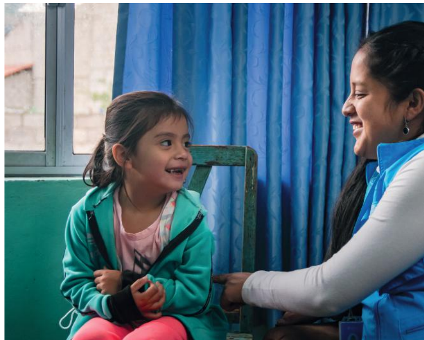
Facilitadora comunitaria durante una visita con una familia focalizada del barrio Antonio Vera en Cuenca.

En el año 2024, seis (6) comunidades de Ecuador recibieron la certificación oficial como Comunidades Protectoras: La Siate en San Lorenzo, Antonio Vera en Gualaceo, Sayausí en Cuenca, Quinchuquí en Imbabura, y los barrios La Delicia y 2 de Febrero en Quito.