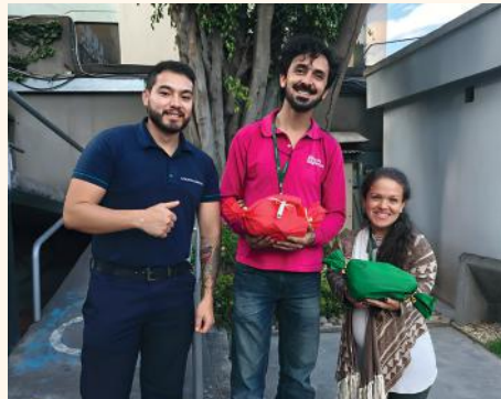
COOPROGRESO entregó regalos para niños de las Casas SOS con apoyo de sus colaboradores.