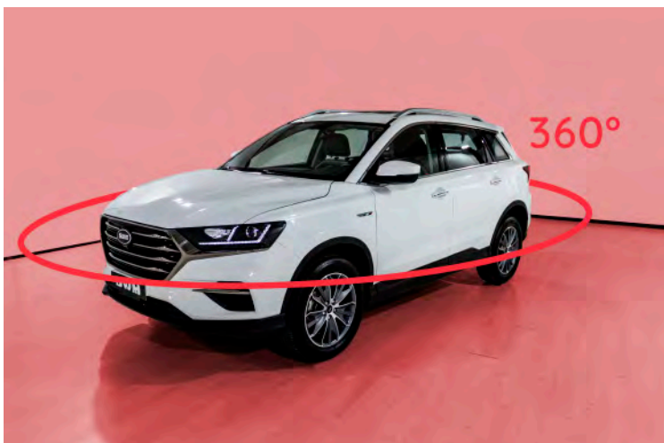
Imagen completa con cámara 360°HD

Equipado con 6 airbags distribuidos en las zonas frontales y laterales envolventes que proporcionan protección más efectiva.