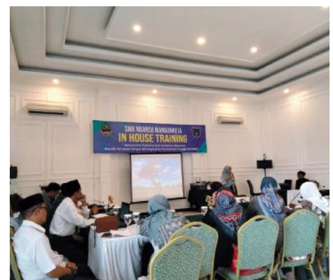
Keg. IHT SMK Nuansa

IHT ke-2 bertujuan meningkatkan sumber daya manusia pendidik dalam menerapkan Kurikulum Merdeka Tahun Pelajaran 2023/2024. Kegiatan ini sangat diperlukan untuk diberikan kepada pendidik dan tenaga kependidikan sebagai bagian pendidikan berkelanjutan (In house training 1 hari, Hari Rabu Tgl. 3 Oktober 2023 di RM Hj. Ocoh).