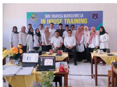
Keg. IHT SMK Nuansa