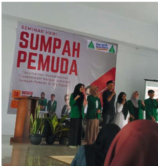
Kegiatan Hari Sumpah pemuda

Menyambut Hari Santri Nasional dilaksanakan pada hari sabtu tertanggal 21 Oktober 2023 di kampus SMK Nuansa dengan kegiatan ngeliwet bersama seluruh kelas.