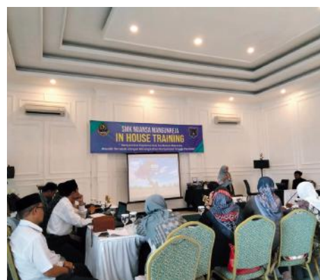
Keg. IHT SMK Nuansa

Uji Kompetensi Keahlian atau UKK akan segera dimulai, maka perlunya persiapan matang untuk segala element, termasuk peserta didik kelas XII baik itu Jurusan OTKP, TKJ dan TBSM