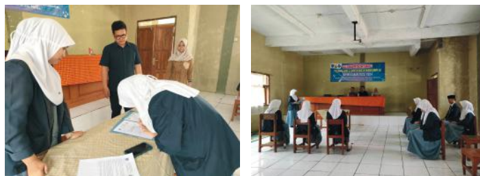
Kegiatan Pelantikan MPK dan OSIS

Penunjukan dan Pelantikan Pengurus MPK-OSIS masa bakti 2023/2024, dilaksanakan pada tanggal 16, 18 dan 19 September 2023 di kampus SMK Nuansa Mangunreja.