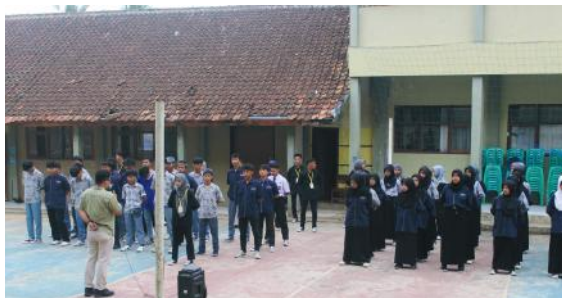
Kegiatan LDKS 2023 2024