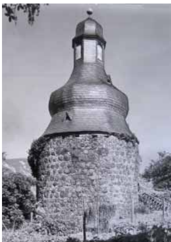
1925 wurde der Turm von Efeu und Weinranken befreit, die bis hoch zur Turmlaterne den Turm verhüllt hatten