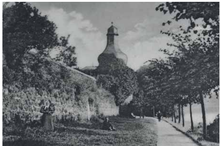
1960 war der Turm wiederum fast vollständig zugewachsen und musste erneut „befreit“ werden. Aber offensichtlich beurteilte man den Aufwand für die Zugänglichmachung wieder als zu hoch und es geschah weiter nichts. Der Hartnäckigkeit von Karl Korf ist es letztlich zu danken, dass wir heute den Besuchern den Turm präsentieren können.