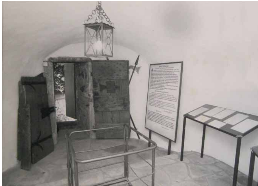
Innenraum bei der Eröffnung 1986