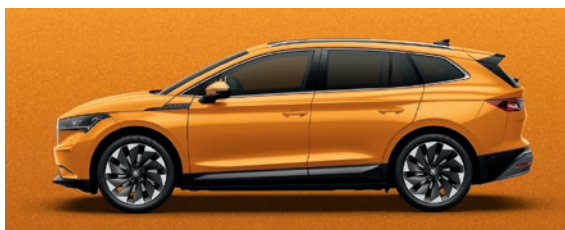
Métallisée Phoenix Orange