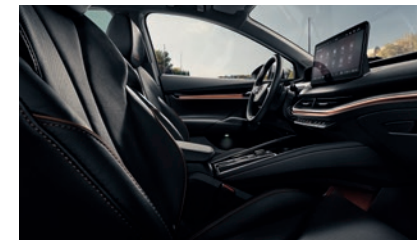
L&K Suite schwarz