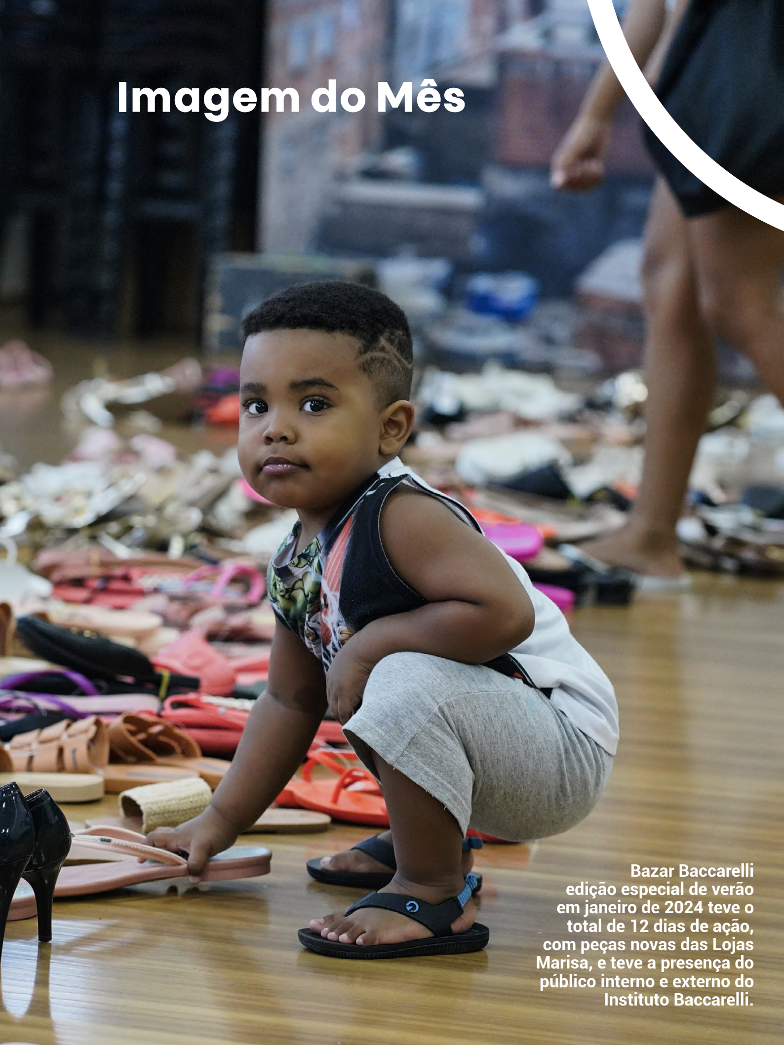
Imagem do Mês

Bazar Baccarelli edição especial de verão em janeiro de 2024 teve o total de 12 dias de ação, com peças novas das Lojas Marisa, e teve a presença do público interno e externo do Instituto Baccarelli.