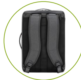
Komfortable ergonomische Riemen