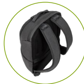
Komfortable ergonomische Riemen