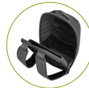
2 Hauptfunktions- fächer