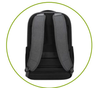
Gepolstertes Rückenteil und Gepäckgurt