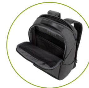
2 Hauptfunktions- fächer