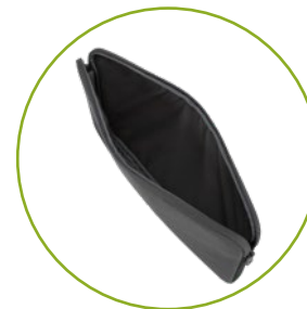
Hauptfach für Laptop