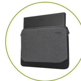
Laptop-Schutz aus Schaumstoff

Modell: TBS64601GL (13-14" Navy) TBS64901GL (11-12" Navy)