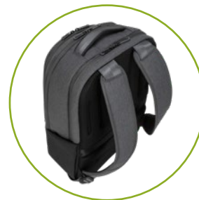
Komfortable ergonomische Riemen