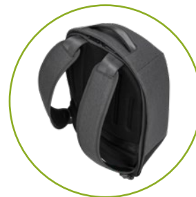
Komfortable ergonomische Riemen