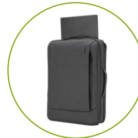
Rucksack und 2 Aktentasche in einem