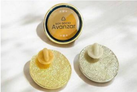
Circular de 2.8 cms