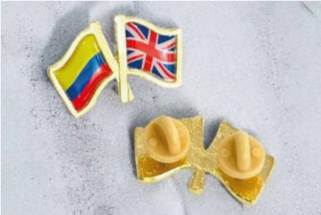
Bandera doble 3,5 x 2 Cms