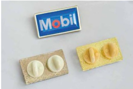
Rectangular de 2.9 x 1,6 cms