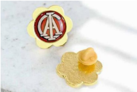
Pin flor 2,6 x 2,6 cms