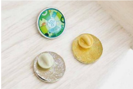
Circular de 2,2 cms