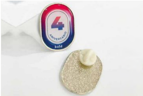
Ovalado 3 x 2 Cms