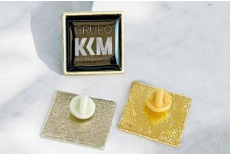
Cuadrado de 2,7 x 2,7 cms