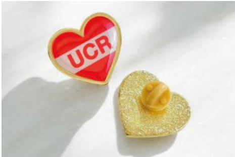
Corazon 28, x 2,5 cms