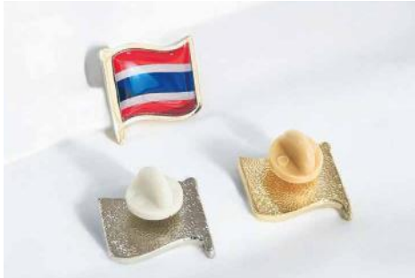
Bandera de 2 x 2 cms