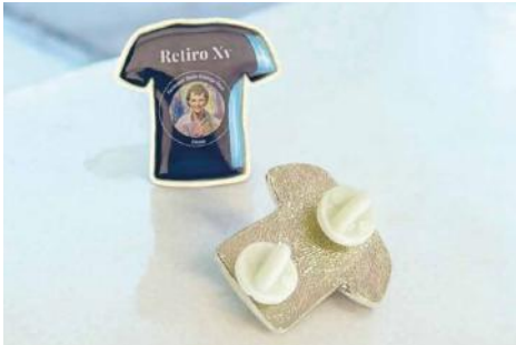
Camiseta de 3 x3 cms