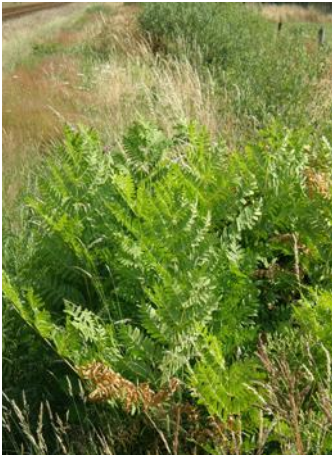
Koningsvaren langs het spoor bij Veenendaal

De vochtige, ruige gebieden waarin de Ringslang het meest voorkomt vormen ook een ideale voedingsbodem voor de majestueuze Koningsvaren. Deze varen kan wel twee meter hoog worden. Net als de Ringslang houdt de Koningsvaren van rust en profiteert hij van het feit dat de spoorberm verboden gebied is voor mensen.