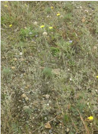
Pioniervegetatie met Dwergviltkruid