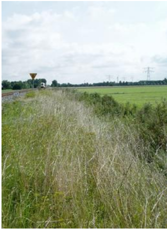
Spoorberm met veel riet in Friesland