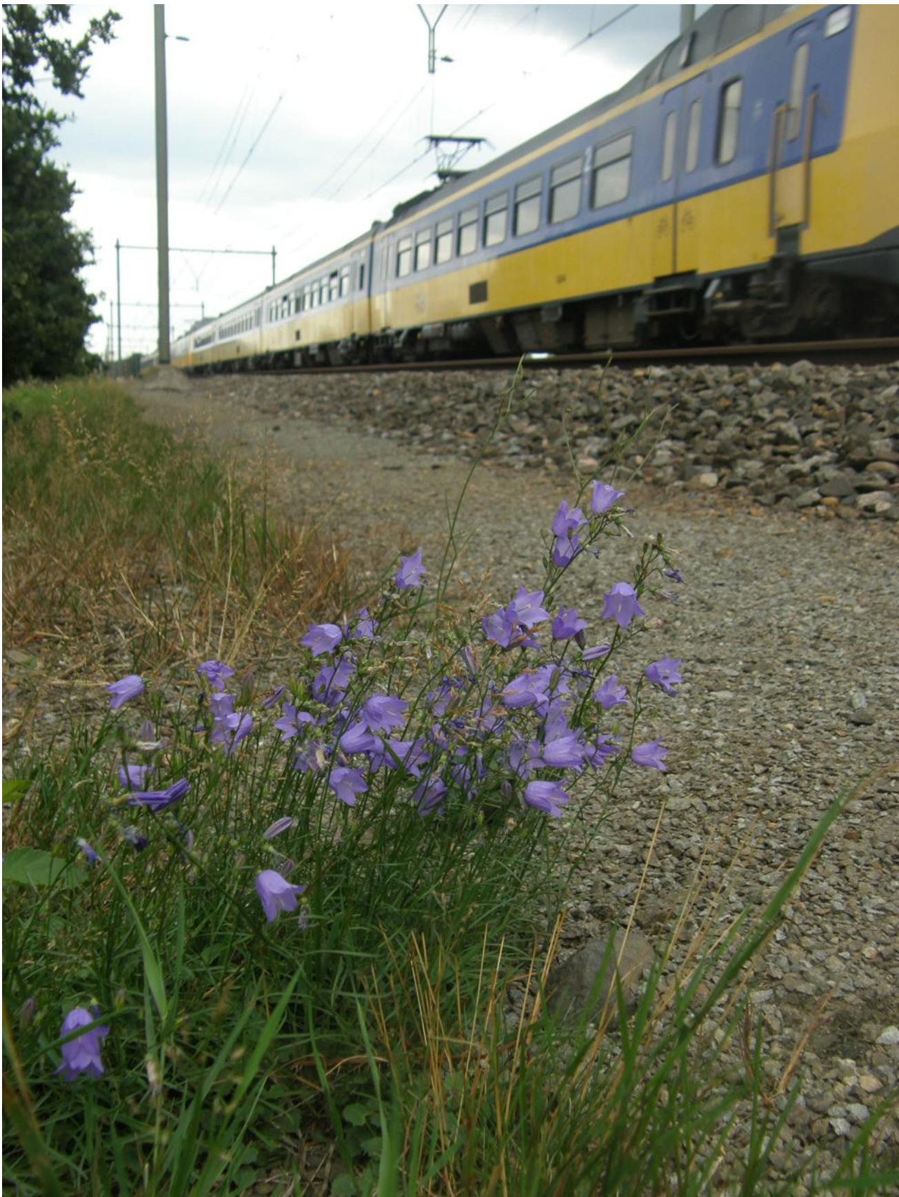
Grasklokjes in een droge spoorberm langs het traject Den Dolder – Amersfoort.