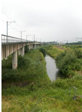
Ecologische inrichting van een vrije kruising bij Woerden.

Niet alleen voor mensen maar ook voor dieren. Dieren hebben recht van overpad bij de aanleg en verbreding van wegen, spoorlijnen en vaarverbindingen. Als Ministerie van Infrastructuur en Milieu scheppen we ruimte voor beweging. Voor mensen. En voor onze flora en fauna”.