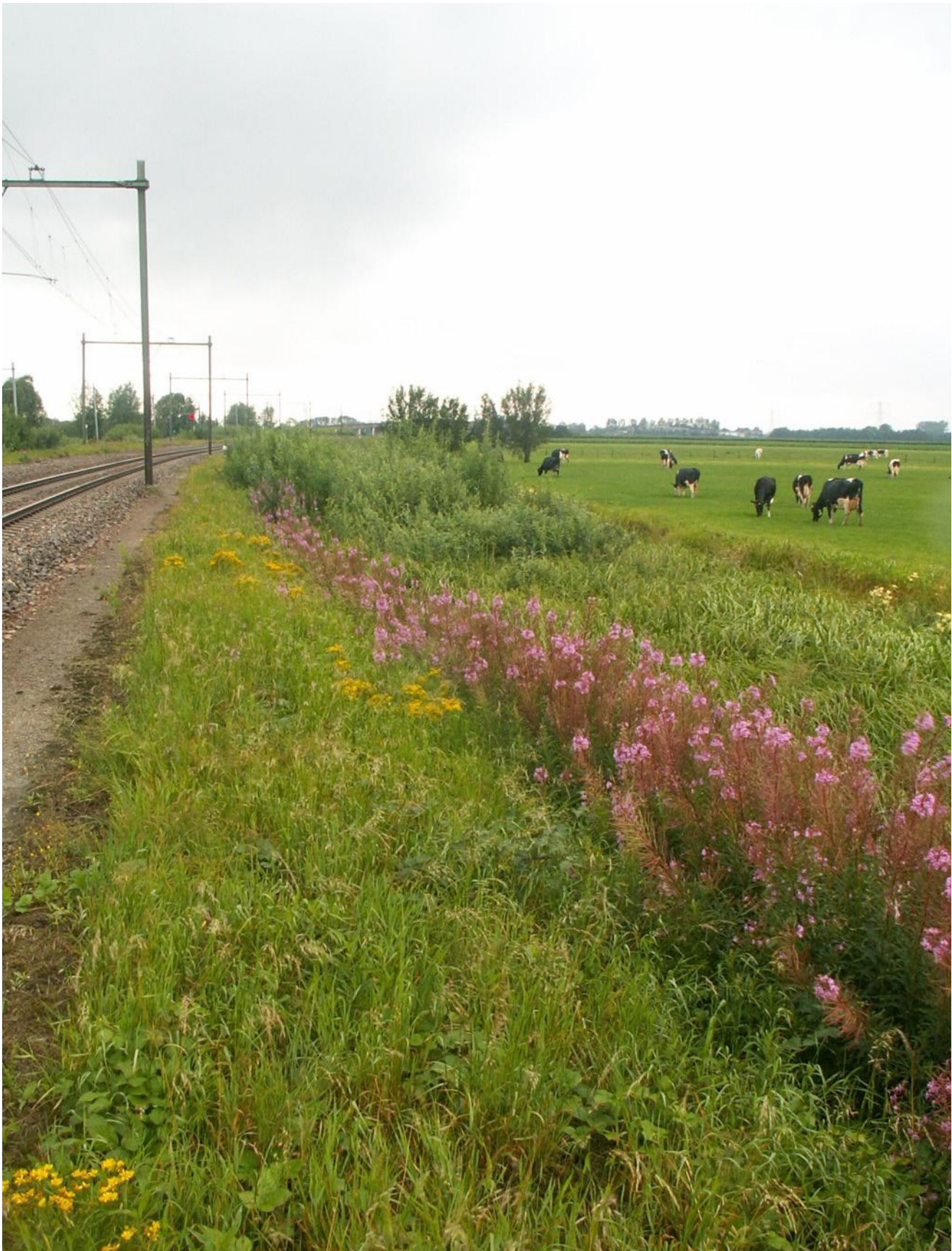
Spoorberm met wilgenroosje (Breukelen)