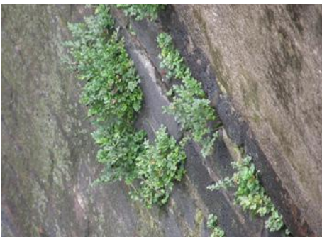
Muurvaren op een oude kerkmuur