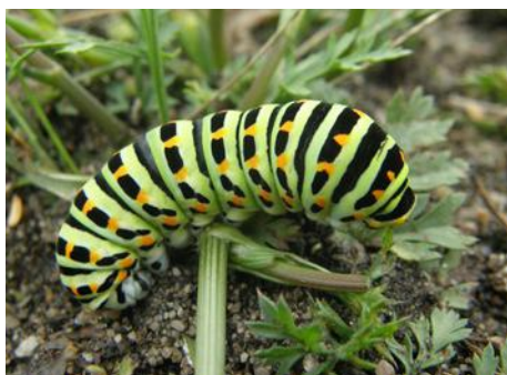
Rups van een Koninginnepage