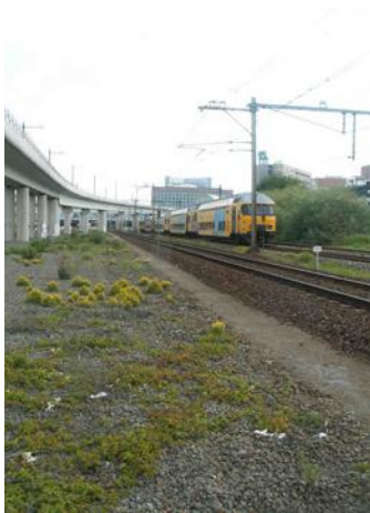
Ballastbed met Gele helm- bloem bij Amsterdam-Sloterdijk