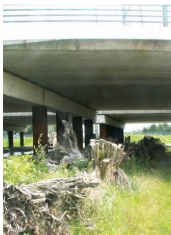
Stobbenwal onder het spoor bij Breukelen

Hiermee levert het spoor een bijdrage aan het versterken van de natuur en het netwerk van natuurgebieden in Nederland. Als bijvoorbeeld aan beide zijden van een dorp heideterreinen aanwezig zijn, kunnen dieren via de spoorberm van het ene terrein naar het andere oversteken, dat wil zeggen zolang er langs dat deel van het spoor dat door het dorp heen loopt ook heide aanwezig is. Door de ruime opzet van de berm krijgt de natuur er, ongeacht de omgeving, ruimschoots mogelijkheden, zelfs in de bebouwde kom.