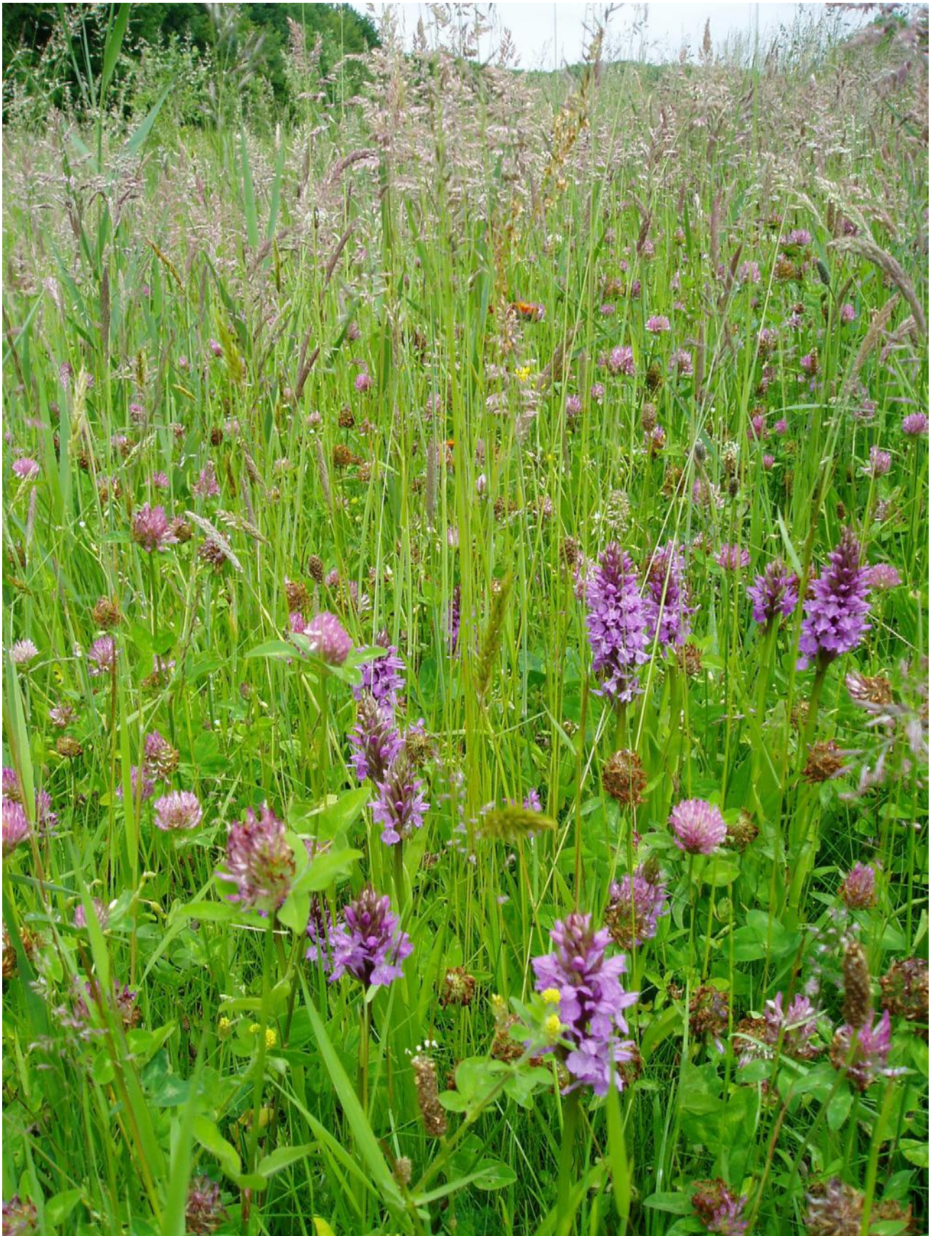
Rietorchis in een spoorberm bij Winsum