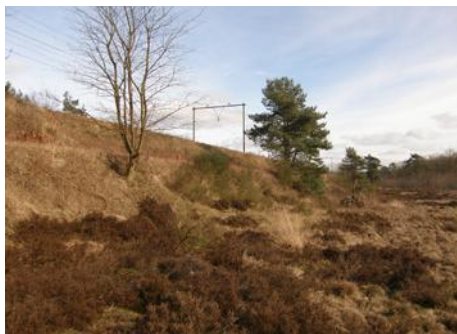
Droge heide in een spoorberm