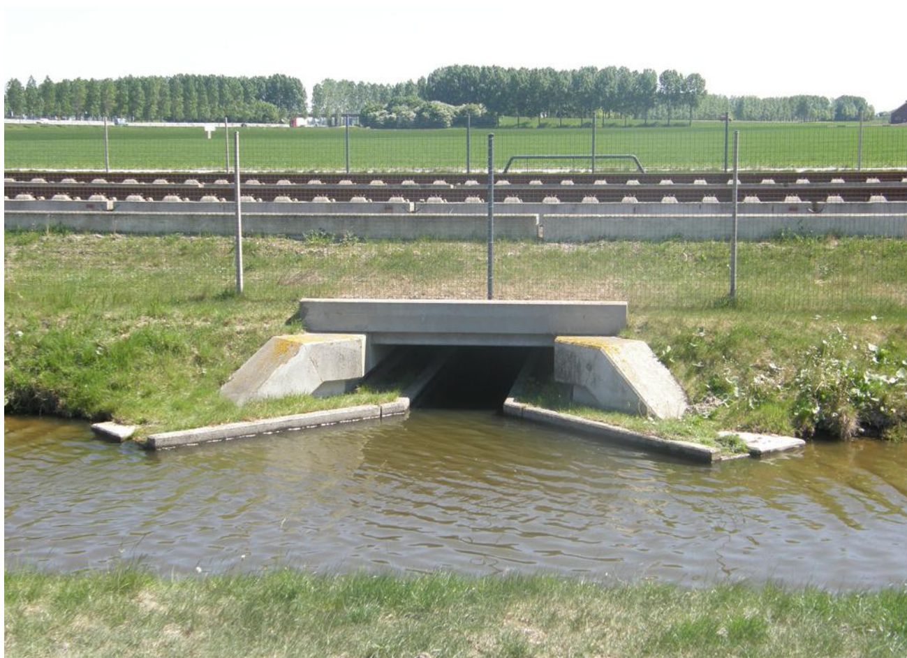
Duiker met faunarichel onder de HSL