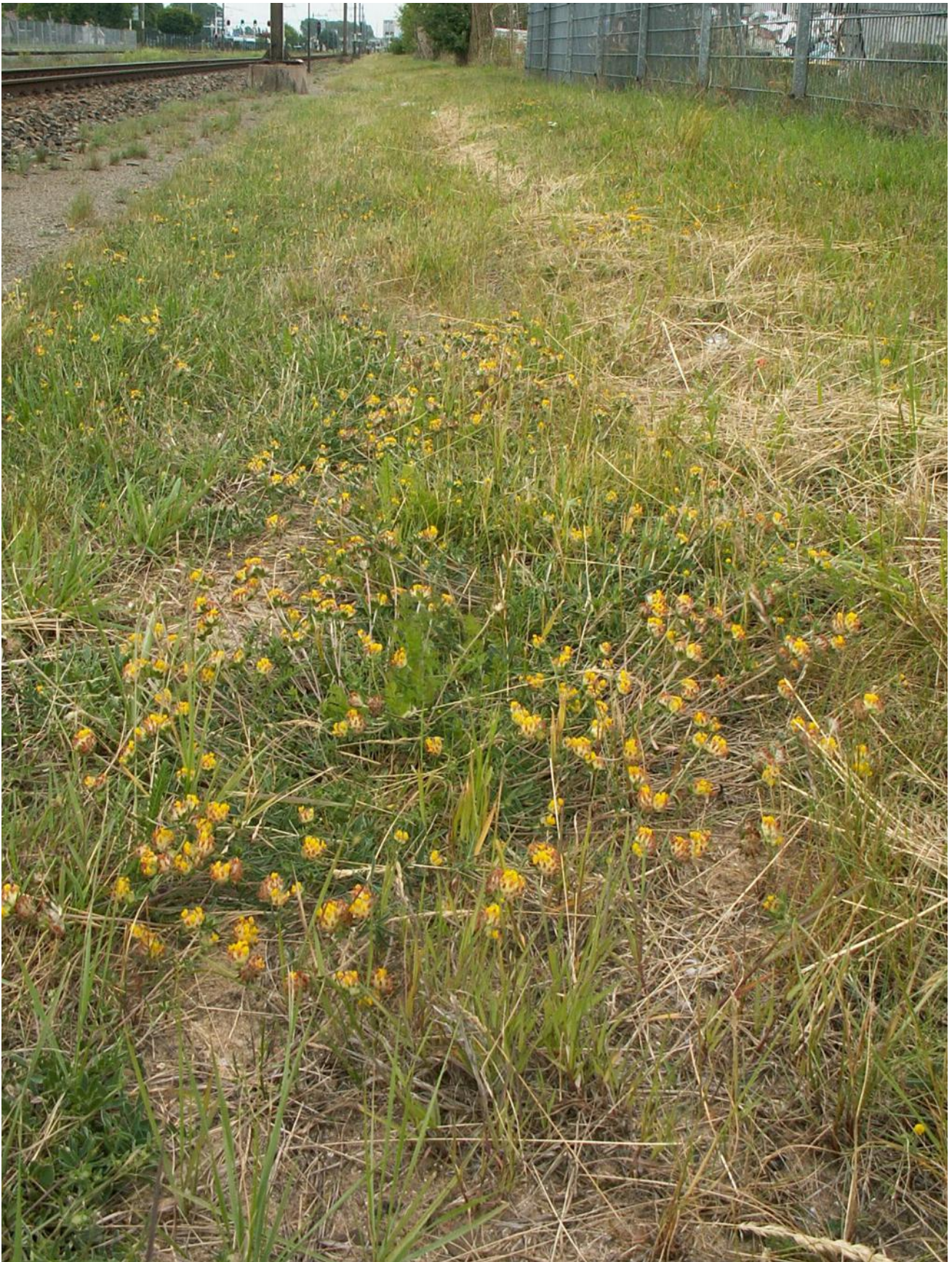
Wondklaver in een spoorberm bij Alkmaar