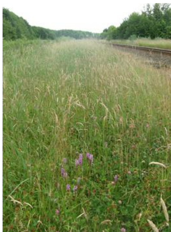
Vochtig schraalland met orchideeën