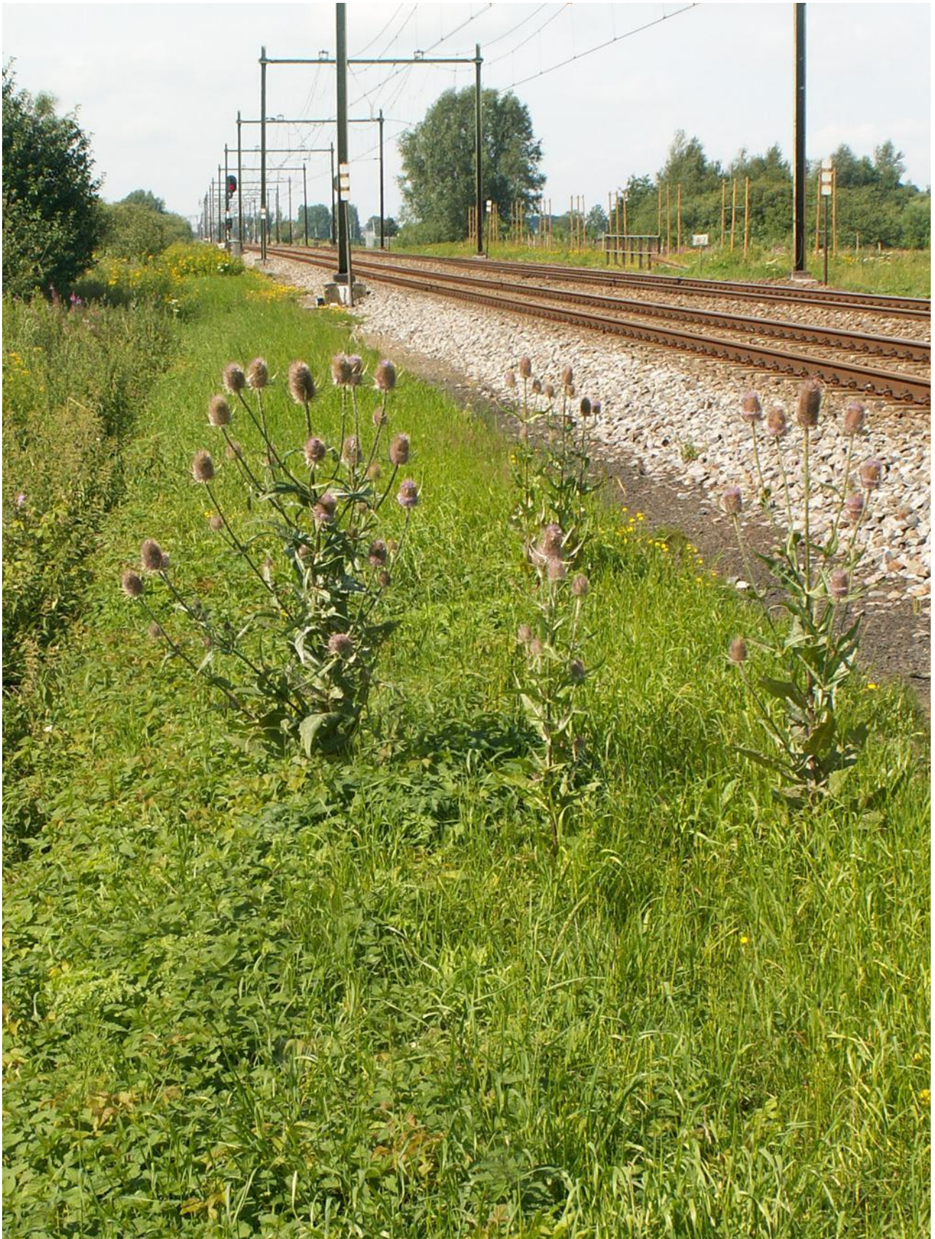
Opbouw van de spoorberm: v.r.n.l. ballastbed, inspectiepad, grazige berm, ruigte, struweel.