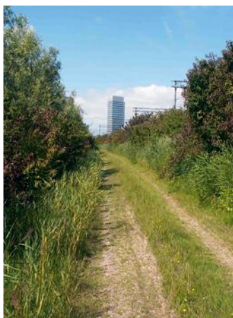
Werkweg met orchideeën bij Hoofddorp

De Rietorchis komt voor in veel verschillende typen vochtige, bloemrijke graslanden, vooral in het lager gelegen deel van Nederland. Ook in vochtige, open rietlanden met veel licht kan de Rietorchis groeien. Verder staat deze orchidee regelmatig op pas ingerichte terreinen en langs (nieuw aangelegde) sloten. Zodra het in de berm langs het spoor vochtig genoeg is, kan de Rietorchis er overleven. Orchideeën gedijen het best op voedselarme grond. Doordat de spoorbermen niet bemest worden, vormen ze een goed leefgebied voor deze plantensoort.