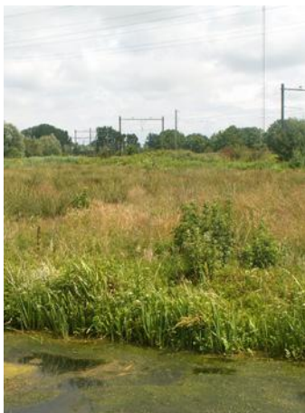
'Wisselwoning' langs het traject bij Diemen

Hoewel de Ringslang van alle Nederlandse slangen het meest voorkomt, is hij nog altijd erg zeldzaam. Voor mensen is de Ringslang ongevaarlijk; hij is niet giftig en bijt niet snel. De soort is goed herkenbaar aan twee gele en zwarte vlekken achter de kop op de verder relatief egale grijsgroene rug. Met zijn aanzienlijke lengte, die kan oplopen tot wel twee meter, is de Ringslang ook de grootste in Nederland voorkomende slang. De Ringslang is in eerste instantie een waterslang; hij zwemt uitstekend en brengt veel van zijn tijd door in of rond het water. Toch kan hij ook kilometers ver van het water gevonden worden.