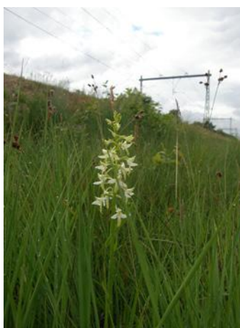
Welriekende nachtorchis in een spoorberm bij Hoogeveen

In gebieden waar de Zonnedaau voorkomt, komen nog veel andere bijzondere soorten voor, zoals Gewone Dophei en Wilde gagel. Op de voedselarme natte heidegronden van Drenthe groeit het Valkruid, een opvallende plant met grote gele bloemen. Een andere zeldzaamheid is de Welriekende nachtorchis, een kleine witte orchidee die 's nachts heerlijk ruikt. Langs het spoor in met name Drenthe en Noord-Brabant zijn nog enkele pareltjes van gebieden te vinden waar een groot deel van deze soorten bij elkaar voorkomen.