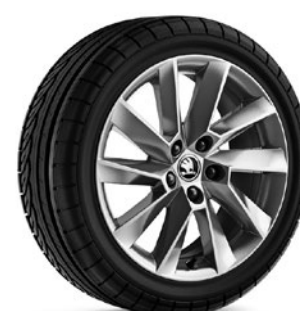
Jantes en alliage léger 6,5J x 17" «Stratos», silber