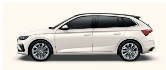
Uni Blanc Candy