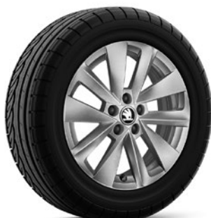
Jantes en alliage léger 6,0J x 16" «Cortadero», argent