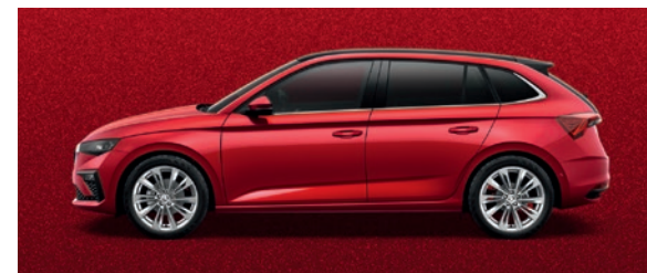
Métallisée Rouge Velvet

Les prix s'entendent en CHF et incluent 8.1% TVA. Certains des équipements optionnels mentionnés ci-dessus ne peuvent être commandés qu'en association avec d'autres équipements supplémentaires. Les couleurs représentées peuvent différer des couleurs effectives de la peinture en fonction de sa qualité. De plus, lesdits équipements optionnels ne peuvent pas tous être combinés entre eux. Veuillez contacter votre partenaire Škoda pour de plus amples informations.