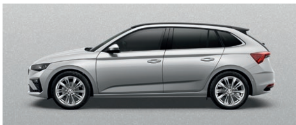
Métallisée Argent Brilliant