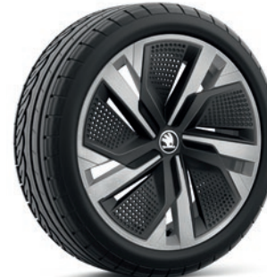
Jantes en alliage léger 7,0J x 18" «Ursa Aero», argent avec panneau Aero noir

Les prix s'entendent en CHF et incluent 8.1% TVA. Certains des équipements optionnels mentionnés ci-dessus ne peuvent être commandés qu'en association avec d'autres équipements supplémentaires. De plus, lesdits équipements optionnels ne peuvent pas tous être combinés entre eux. Veuillez contacter votre partenaire Škoda pour de plus amples informations.