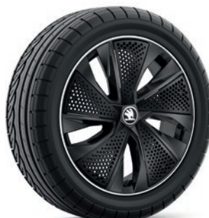
Jantes en alliage léger 6,5J x 17" «Kajam Aero», noir avec panneau Aero noir