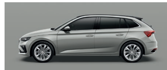
Uni Steel Gris