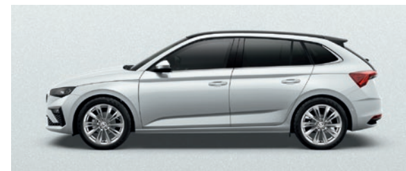
Métallisée Blanc Moon