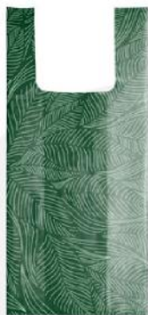
Sacos tipo camiseta.