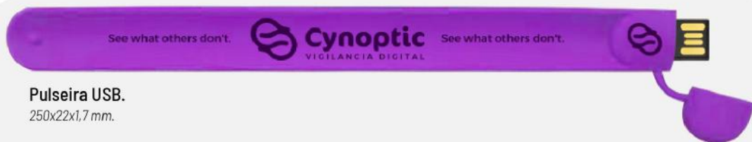
Pulseira USB. 250x22x1,7 mm.