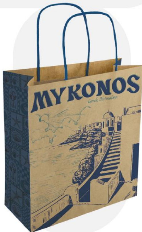
Saco de papel.