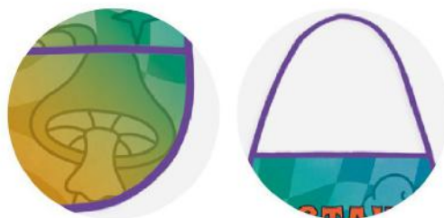
Avental Non Woven 80g. 57x62 cm.