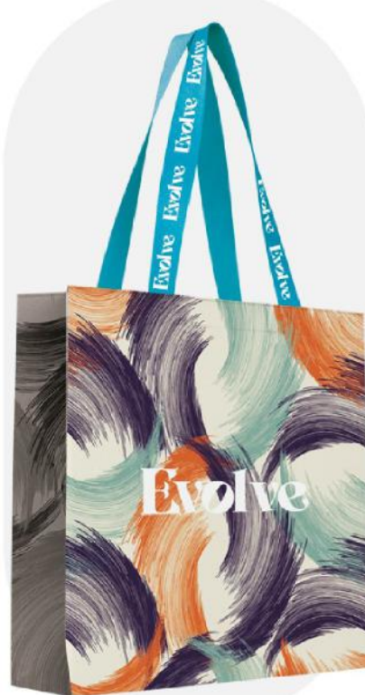
Saco laminado n  o tecido.