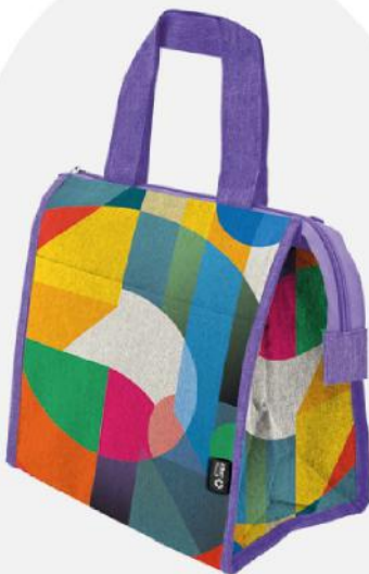
Bolsa geleira rPet grande. 22x22x12,50 cm.