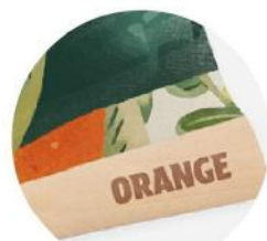
Ventilador de madeira. 16 hastes, madeira natural.