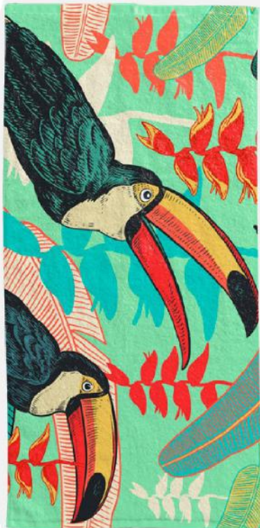
Toalha felpuda. 75x150 cm.