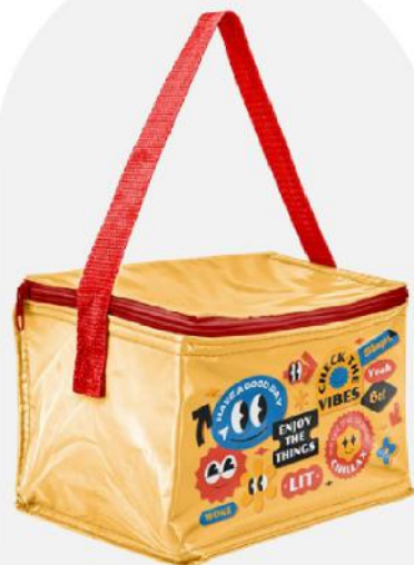
Bolsa geleira em PVC 6 latas. 21x15x15 cm