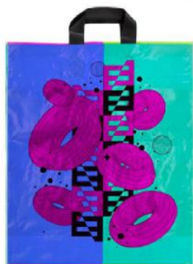
Bolsas com alça de arco. 45x55x10 cm.