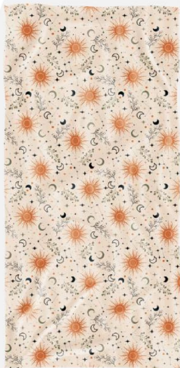
Toalha em microfibra. 75x150 cm.