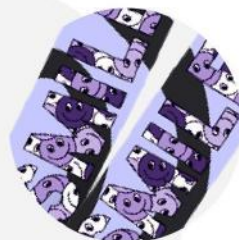
Cordão de sublimação. 2,5x100 cm.