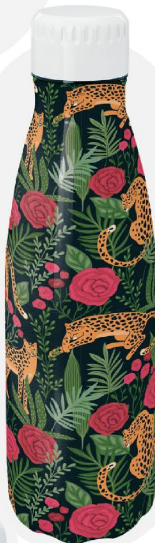
Bidão especial em aço inoxidável. 700 ml. 7,5x25,70 cm.