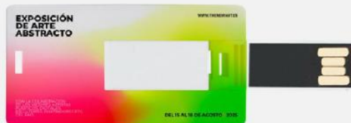
USB cartão de visita pequeno. 60x30 mm.