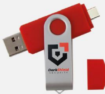
USB. 71x19 mm.