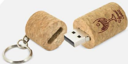
USB de cortiça. 22x50 mm.