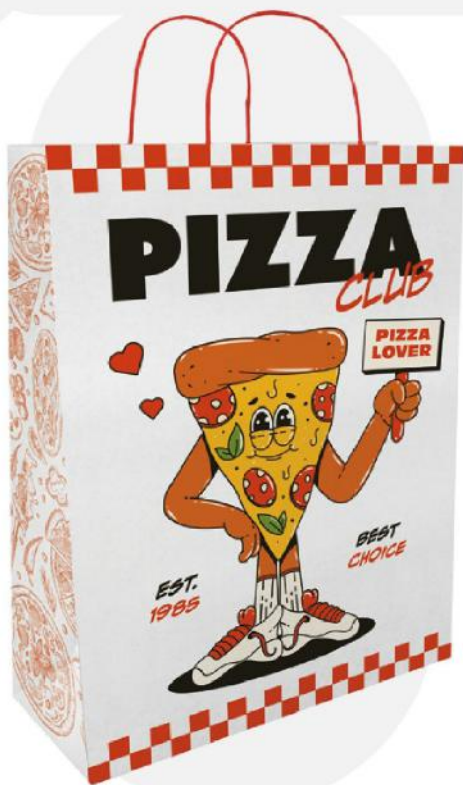
Saco de papel.