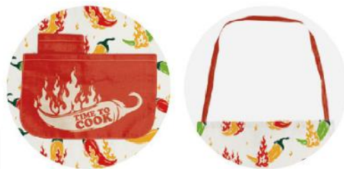
Avental de poliéster. 65x89 cm.