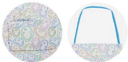
Avental 100% algodão 190g. 60x70 cm.