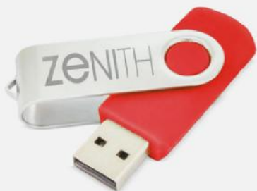
USB. 58x20 mm.