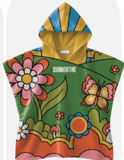
Poncho-toalha. Tamanho infantil.