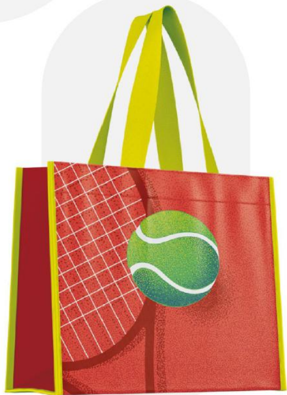
Saco laminado em polipropileno.

Crie sem limites e crie um produto   nico que reflita a sua identidade.