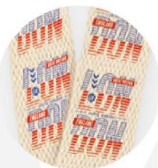
Cordão de algodão. 2x48 cm.