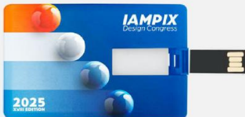
USB cartão de visita. 85x54 mm.