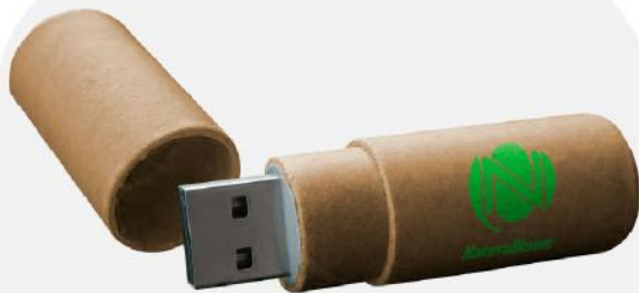
USB de cartão reciclado. 65x19 mm.