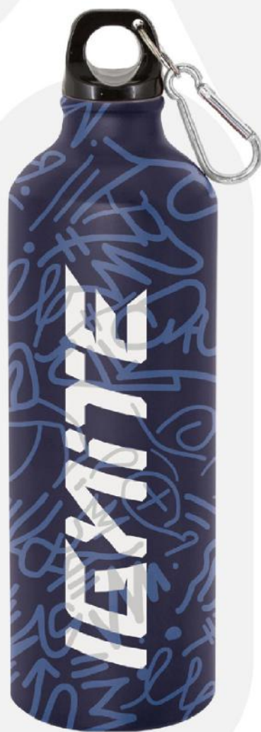
Bidão de alumínio.