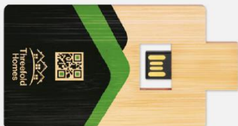
USB cartão de visita em bambu. 90x55 mm.