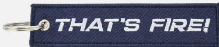
Porta-chaves bordado. 13x3 cm.