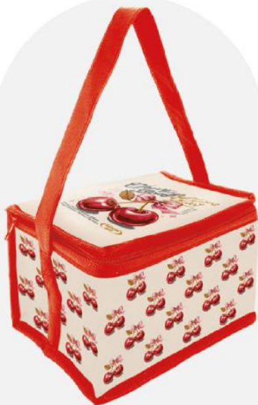
Bolsa geleira NonWoven laminado 6 latas. 20x14,5x14 cm.