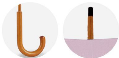
Guarda-chuva de passeio com cabo de madeira. Nylon 170T. 104 cm ø.