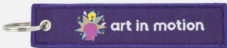
Porta-chaves jacquard. 13x3 cm.