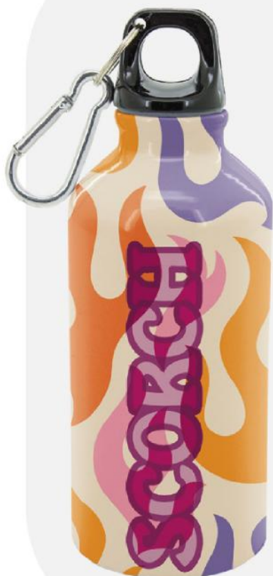
Bidão de alumínio.