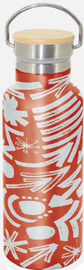
Garrafa térmica de aço de dupla camada aço inoxidável com tampa de bambu. 500 ml. 7x22,50 cm