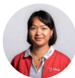
Bamboo Saluz Praktikantin