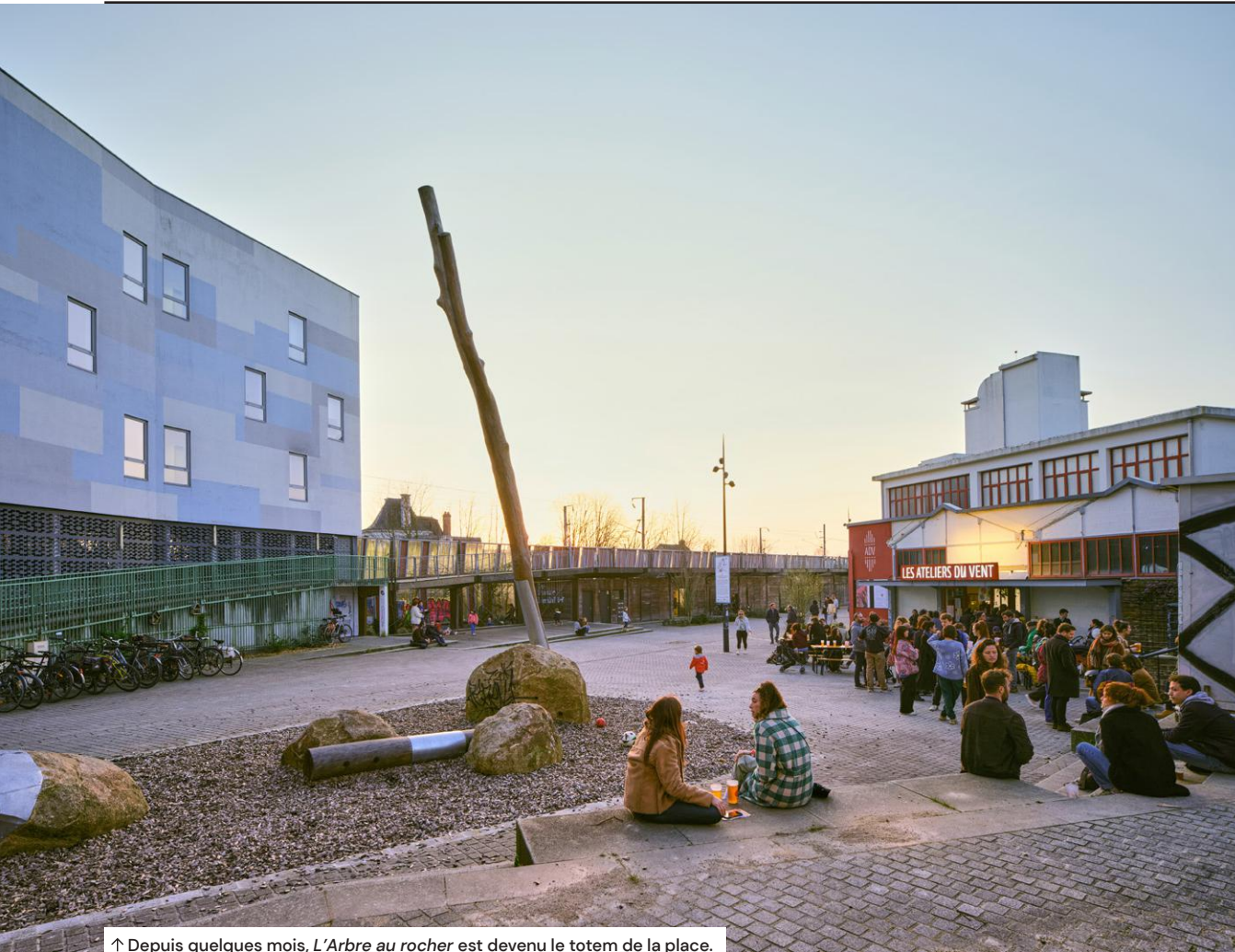
↑ Depuis quelques mois, L'Arbre au rocher est devenu le totem de la place.