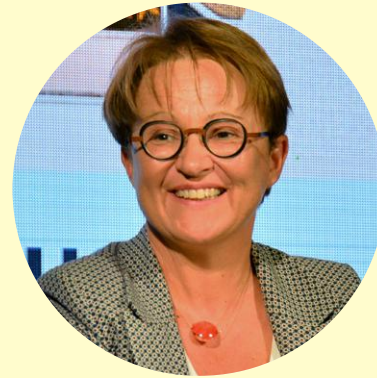
Nathalie Appéré, maire de Rennes, présidente de Rennes Métropole

particuliers, aux collectivités, aux entreprises, aux associations. La Ville de Rennes et la Métropole y participent. Les bénéfices sont redistribués à des projets qui favorisent l'usage de la langue bretonne au quotidien. Passage prévu à Rennes : le 21 mai.