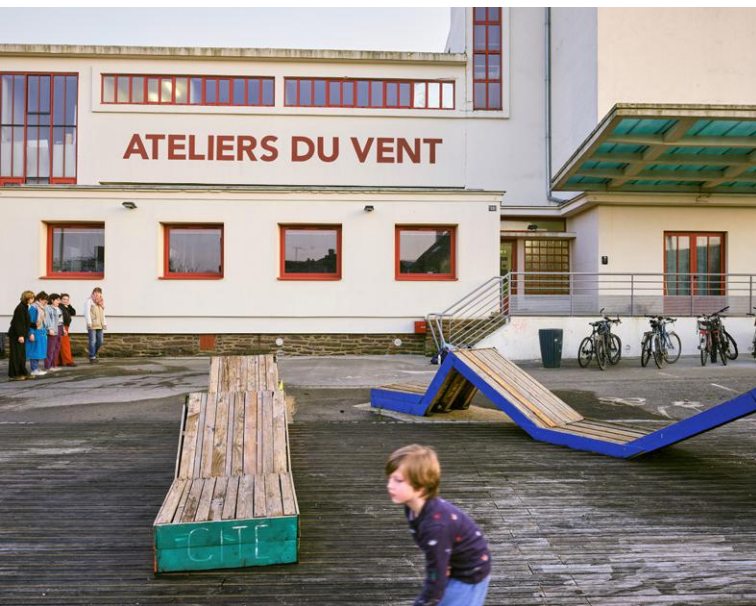
↑ Les animations du collectif artistique Les Ateliers du vent débordent volontiers sur la place.