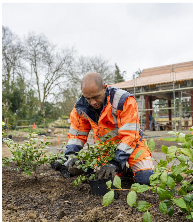
↑ Savez-vous planter du thé ? Ce n'est pas banal par chez nous, mais ça pousse bien.