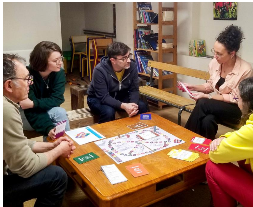
↑ Un groupe d'éducateurs a imaginé Co Quartier, un jeu de société permettant d'aborder le vivre ensemble avec les collégiens.

➤ Plus d'infos : Marie Pincet 06 17 47 30 14