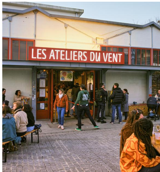
↑ Jeudi soir, c'est le grand jour de la Buvette: on vient y chercher son panier de légumes et causer entre voisins.