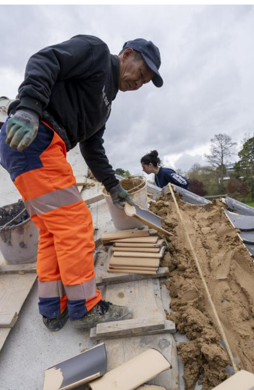
↑ Des couvreurs sont venus de Jinan pour poser les tuiles sur la pagode.

La filière thé en Bretagne commence à se développer depuis une dizaine d'années et compte une vingtaine d'exploitations. À Rennes, 600 pieds vont être plantés. Après transformation, on peut espérer obtenir 6 kilos de thé. Mais il va falloir patienter un peu : un arbuste arrive à maturité entre cinq et sept ans.