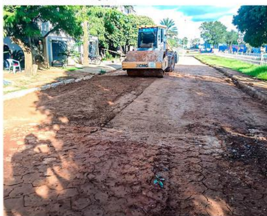
Rua São Cristóvão no trecho entre a avenida Monte Castelo e rua Jamil Pontes

(Da Redação) A Secretaria Municipal de Obras e Serviços Públicos (Semosp) segue com as melhorias na infraestrutura urbana com a restauração de trechos pavimentados em bloquetes no bairro Jardim dos Migrantes.