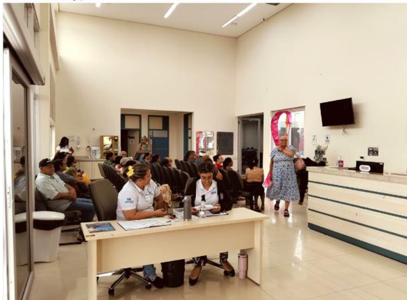
Os atendimentos para o exame preventivo Papanicolau ocorrerão em parceria com o Hospital de Amor