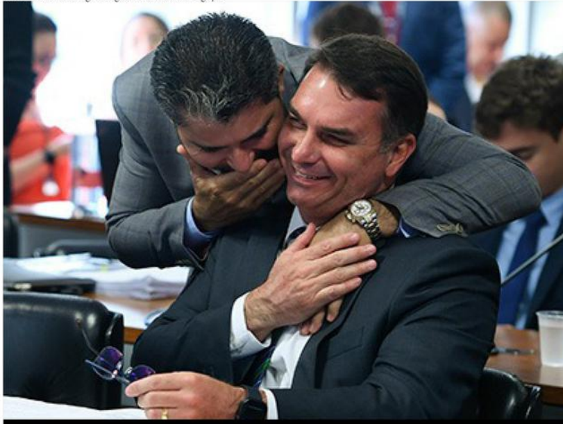
Senador Flávio Bolsonaro participará do lançamento da pré-candidatura do senador Marcos Rogério ao governo de Rondônia