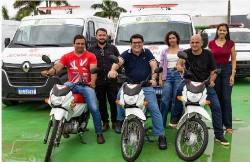
Foram adquiridas seis ambulâncias e três motocicletas para a Secretaria Municipal de Meio Ambiente e Turismo

o empenho dos servidores e reconhecer o trabalho dos parlamentares que destinaram recursos para a aquisição dos veículos.