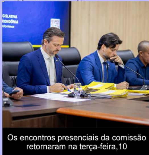
Os encontros presenciais da comissão retornaram na terça-feira, 10