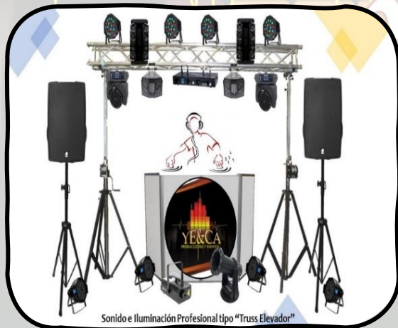
Sonido e Iluminación Profesional tipo "Truss Elevador"

2 estructuras elevadora LS-132 para Truss de iluminación 2 estructura Global Truss en base para Iluminación. 4 Cabeceras Mobil Big Dipper LM108 RGBW Wash. 2 luces Spider Light Lm80 RGBW multicolor. 6 reflectores Par Led Lp005 Secuenciados. 2 luces Dual Gem Pulse Led RGB-Strobe FX. 1 Laser de 4 bocas multicolor. 4 luces Par Led 64 para ambientación. Cableado profesional eléctrico y de seguridad, asistencia Técnica.