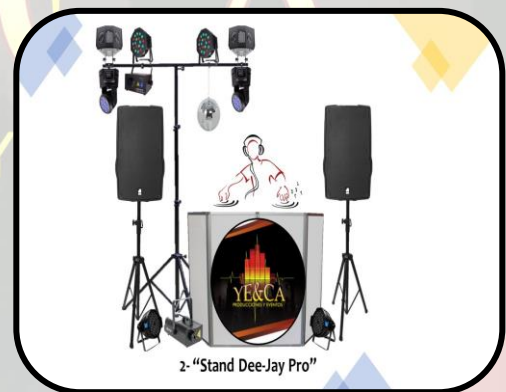
Obsequio: Maquina de Humo.

Set-Up Profesional "Stand Dj Pro en T": ..... $ 410.000 Personal Técnico y de montaje: ..... $ 120.000 SERVICIOS Transporte de equipos en Bogotá DC: ..... $ 120.000