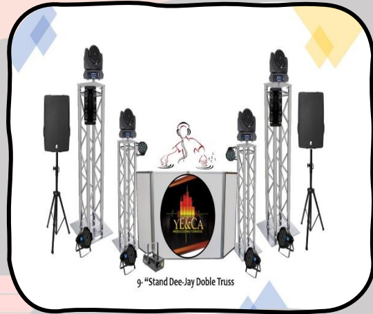
9- "Stand Dee-Jay Doble Truss"

2 estructuras genéricas de 1 ½ en Base X para iluminación. 2 estructuras Global Truss en base para Iluminación. 4 Cabecera Mobil Big Dipper LM108 RGBW Wash. 2 luces Spider Light Lm80 RGBW multicolor. 6 reflectores Par Led Lp005 Secuenciados. 1 Laser KM002RGB Multicolor. 4 luces Par Led 64 para ambientación. Cableado profesional eléctrico y de seguridad, asistencia Técnica.