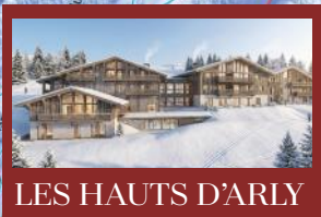
LES HAUTS D'ARLY