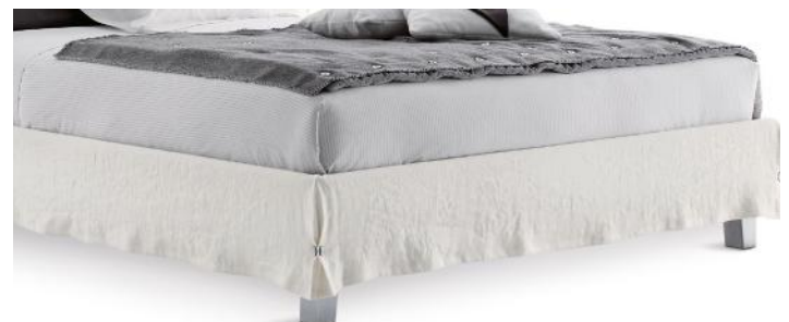
PIEDI IN ALLUMINIO ALUMINUM FEET