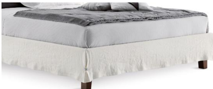
PIEDI LEGNO WOODEN FEET