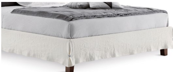
PIEDI LEGNO WOODEN FEET

+++ Indique los pies elegidos en el momento de la compra.