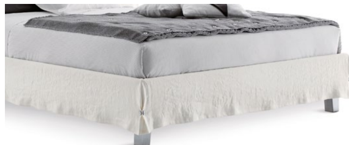
PIEDI IN ALLUMINIO ALUMINUM FEET